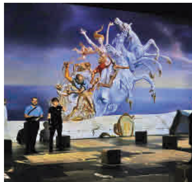
El món oníric, molt present en l'obra daliniana.

LA MOSTRA TRACTA LA SEVA PASSIÓ PER LA CIÈNCIA I L'ART DIGITAL