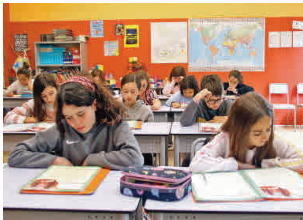
Nova campanya per incrementar el potencial de l'acompanyament lector familiar.

D'altra banda, els ocupadors asseguren que falten persones titulades amb les com-