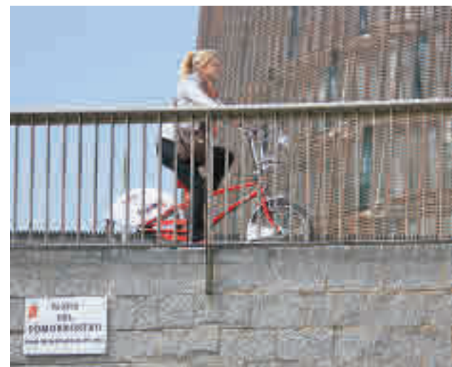
La bicicleta és el protagonista de la nova mobilitat.

El actor Rodolfo Sancho cuenta a GENTE detalles de 'La piel del tambor', que se estrena este viernes 21