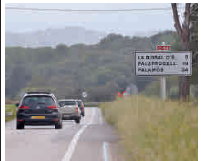
És una infraestructura que consideren prioritària.

Les línies mestres es basen en un compromís amb la sostenibilitat, en el treball conjunt entre el sector públic i el privat, i el treball de la mà del territori. Entre d'altres, l'aposta per la sostenibilitat es plasma amb la creació de 18.480 metres quadrats de plaques solars, que estan cridades a convertir-se en un dels elements diferencials del traçat vallesà gràcies a la seva ubicació en emplaçaments claus.