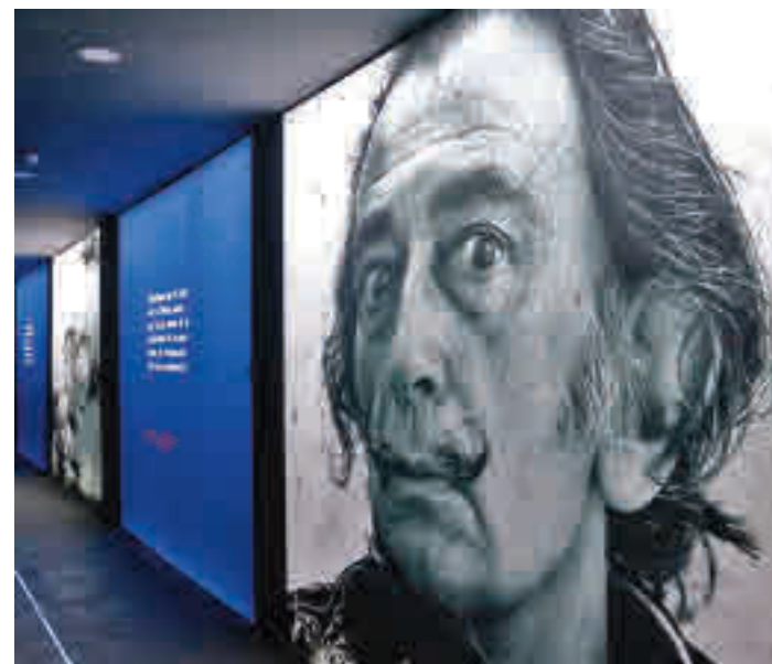
Dalí va ser un pioner en la utilització d'eines digitals.

Amb un pressupost d'1,2 MEUR, la mostra arrencarà una gira mundial després d'oferir-se a Barcelona. En concret anirà a ciutats com Londres, Brussel·les, Zurich, Budapest, Munich, Torino, Roma, Colònia, París, Bristol, Dublin, Manchester, Anvers, València i Bilbao. S'està treballant en un futur recorregut per Amèrica i Àsia-Pacífic.