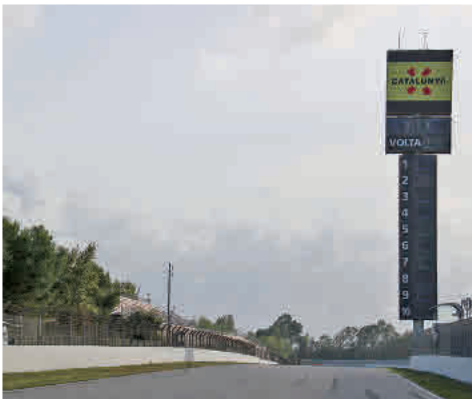
L'espai també busca vincular-se a actes de eSport. ACN