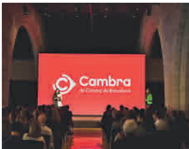
El trasllat es faria al 2026.

Si el nou espai tira endavant, acollirà les oficines centrals de la corporació que, tanmateix, pretén mantenir la propietat de la seva seu a la Diagonal per concentrar-hi allà els seus "hubs" i espais per empreses.