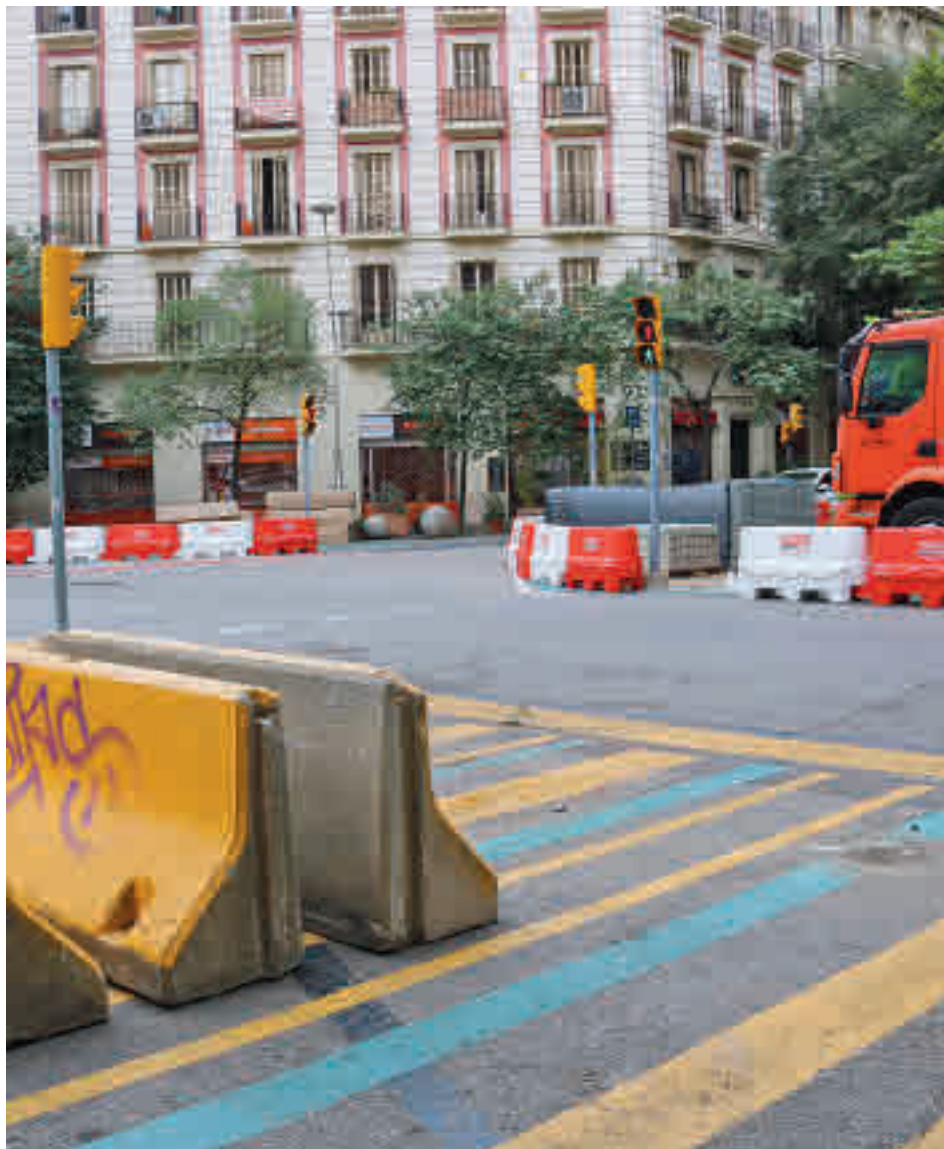
Les voreres prioritzaran l'ús del vianant a peu.

El PMU aposta per incrementar la quota dels desplaçaments en modes sostenibles, concretament un 7,5% a peu, un 15,7% en transport públic i un 129,4% en bicicleta. Alhora insta a reduir els que es fan en vehicle pri-