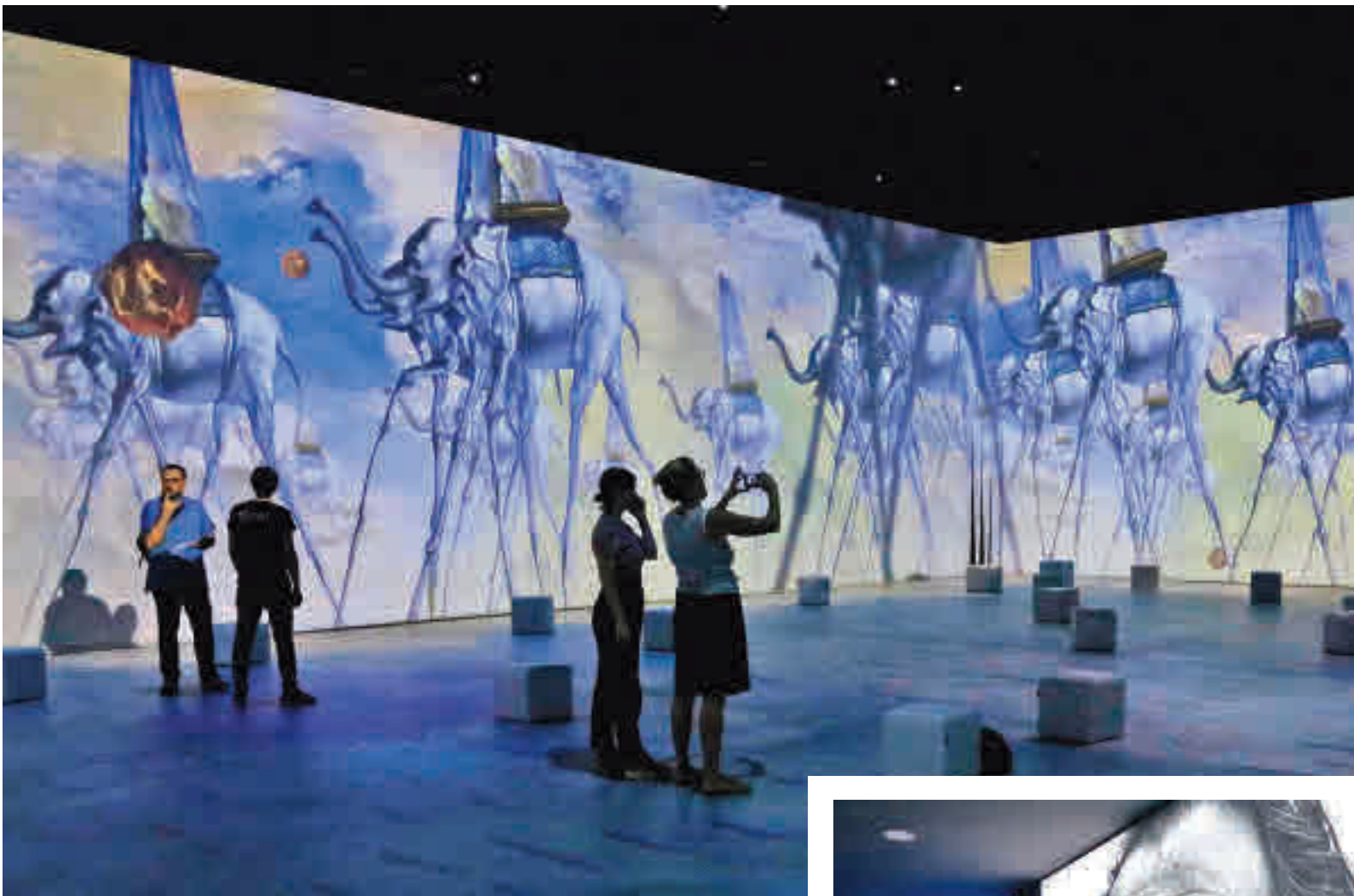
El visitant fa un viatge impossible pel mar, el cel, el desert i el buit.