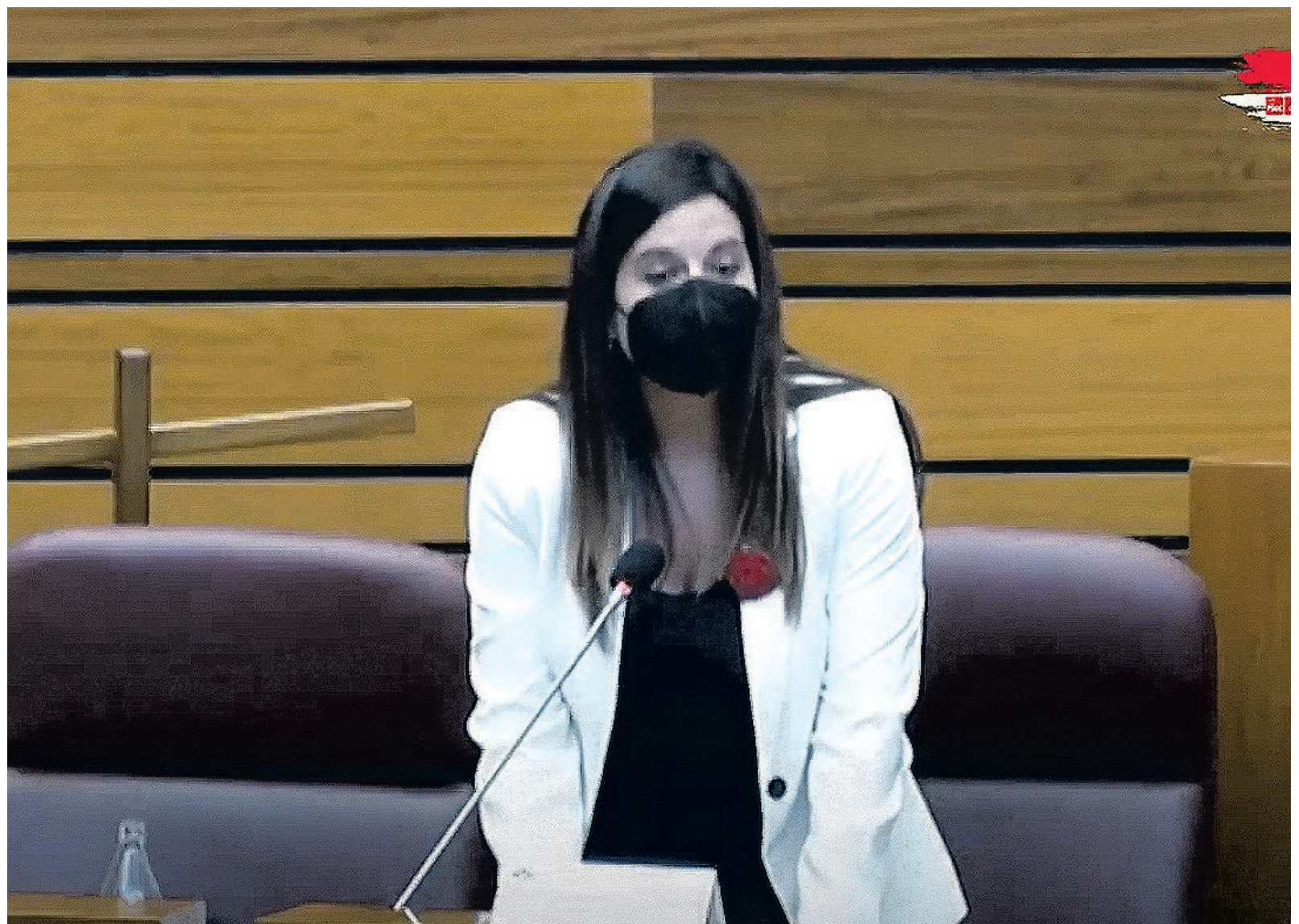
Nuria Rubio es la portavoz de Familia del Grupo Parlamentario Socialista en las Cortes de Castilla y León.

En las entidades sin ánimo de lucro se han contabilizado 570 muertes en las propias residencias (55,2 %) y 463 fallecieron tras ser derivados a hospitales (44,8 %).