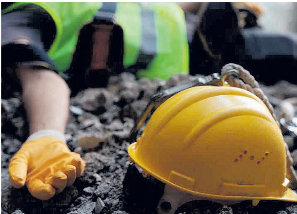
Imagen de archivo de un accidente laboral.

2021 no se haya reunido el Consejo de Seguridad y Salud y considerar “significativo” que tampoco se haya reunido con los inspectores de trabajo de las nueve provincias a pesar del incremento de un 13,95% de los accidentes laborales y del incremento de las bajas por enfermedades laborales en todas las provincias durante 2021 respecto al año anterior.