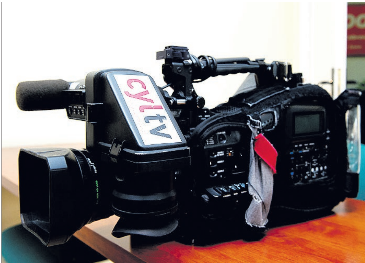
Desde las filas de la oposición en el Parlamento autonómico se ha pedido un modelo de televisión “objetivo” y “transparente”.

Tudanca también recordó que detrás de la mitad de esta televisión está un empresario condenado por delitos vinculados a financiación ilegal del Partido Popular y la Trama Gürtel. Y añadió que “merecer el odio de los que envenenan el pueblo es un honor” sabiendo que ello podría suponer “un coste” para él, como ya ha ocurrido