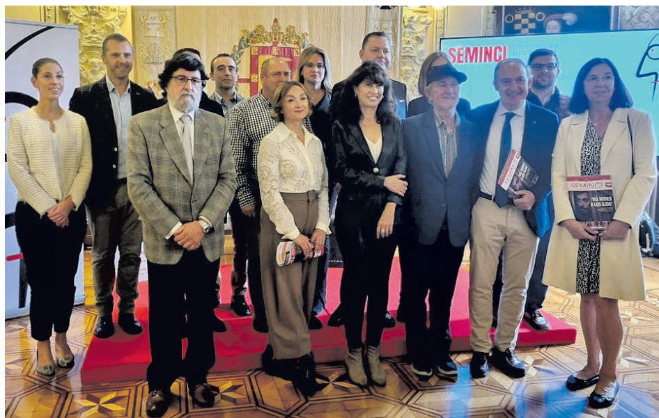
Puesta de largo de la Semana Internacional de Cine 2022.

Por último, la 67ª edición del encuentro de cine más importante de Castilla y León acogerá el sexto Foro de Mujeres Cineastas, que tendrá lugar los días 22 y 23 de octubre. Así, el encuentro organizado por la Seminci y la revista Caimán Cuadernos de Cine cumple una vez más con su cita anual, en esta ocasión para tratar el tema Las mujeres en la crítica de cine .