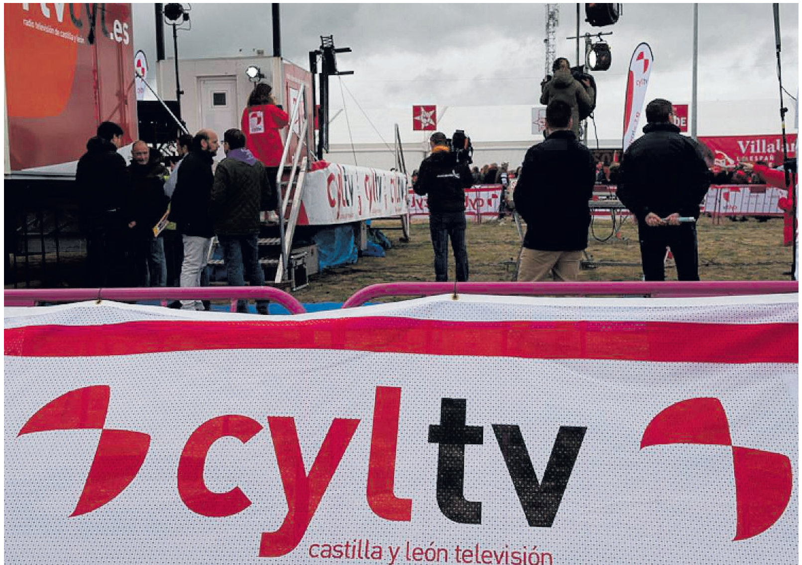
Equipo de trabajo de Radio Televisión de Castilla y León (RTVCyL) en la campa de Villalar de los Comuneros.

Pero la Federación de Servicios a la Ciudadanía de CCOO en Castilla y León (FSC-CCOO CyL) quiere poner especialmente el foco en los graves problemas laborales y salariales que tiene la plantilla de RTVCyL, la televisión regional sufragada en su mayoría con dinero público, donde los salarios de miseria, las jornadas interminables, la falta de la desconexión digital o el hecho de no tener derecho a subrogación, si algún día el Gobierno regional decide "otorgarle" el servicio de televisión pública a otra empresa, se convierten en los problemas reales de los que casi nadie habla.