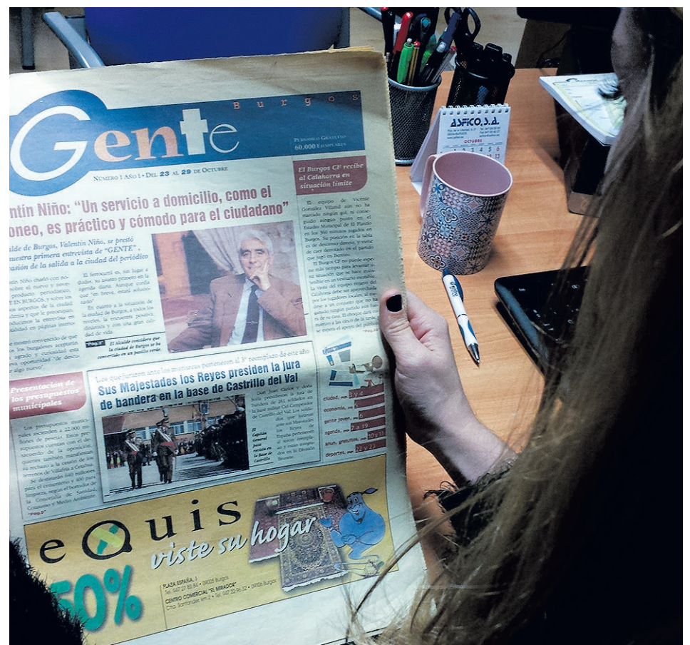
Portada del número 1 de Gente en Burgos, primera de las cabeceras del Grupo Gente.

En estos 24 años, hemos visto cómo la familia Gente ha crecido y el Grupo está presente en quince comunidades autónomas (en todas a excepción de Canarias, Baleares, Ceuta y Melilla) con 42 ediciones que se distribuyen cada viernes en 55 ciudades y 29 provincias. Todas ellas suman más de 172.000 ejemplares publicados y distribuidos cada semana -auditados por OJD y PGD-, lo que supone una difusión de más de 500.000 lectores.