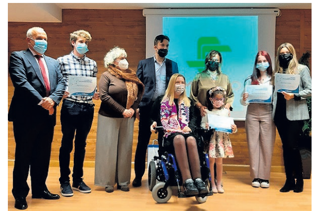
Gala de Entrega del VI Concurso de Cuentos Ilustrados 'Ofelia Blanco Martínez' en 2021.

En las obras deben narrar su experiencia en la convivencia con personas que padecen la enfermedad de Alzheimer, cómo se sienten, cómo ayudan a su familia y todo aquello que quieran expresar. Los interesados pueden consultar las bases en la página de la Fundación CGB.