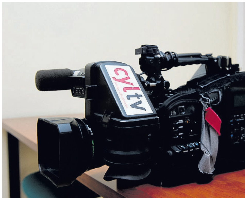
Los problemas de los trabajadores de la Radio Televisión de Castilla y León (RTVCyL) han visto la luz.