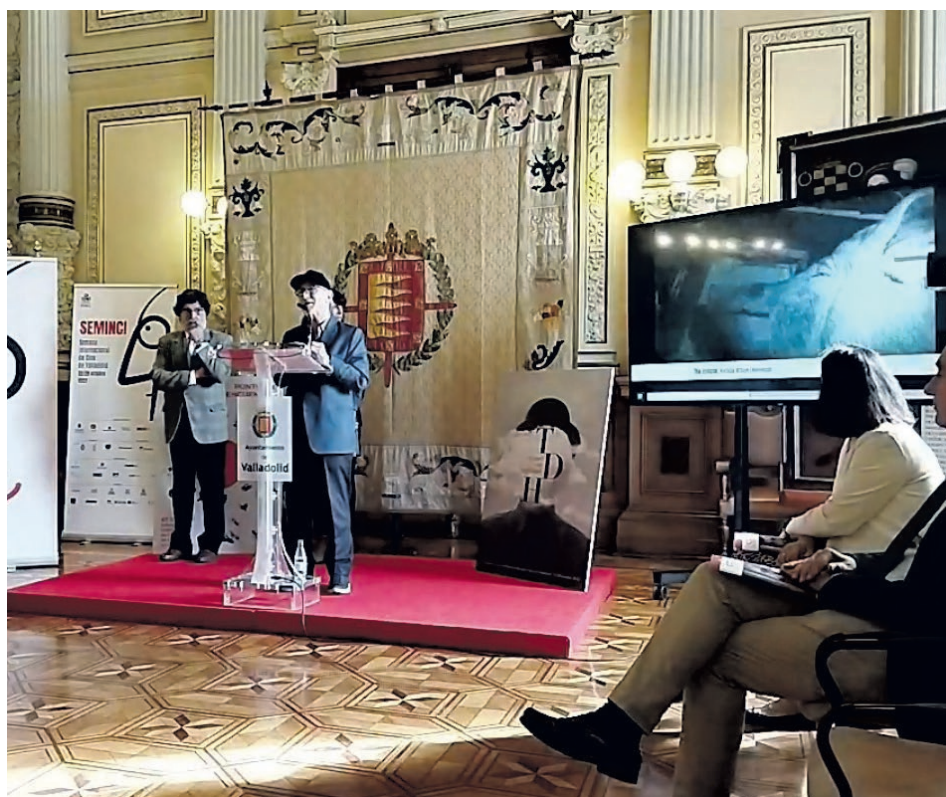
Presentación de la Seminci en el Ayuntamiento de Valladolid.