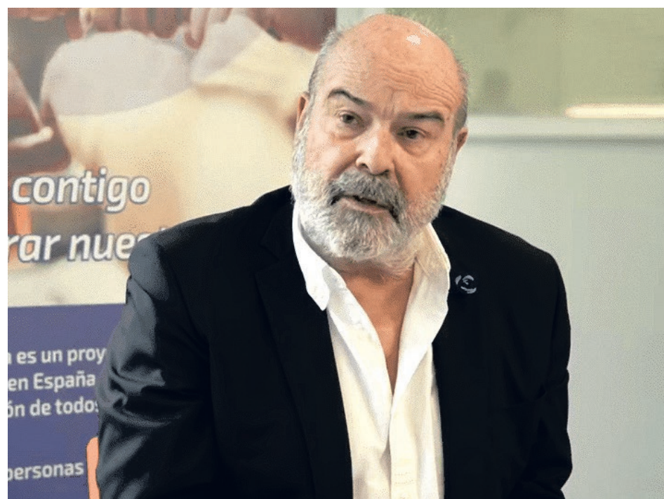
Antonio Resines recibirá la Espiga de Honor en la 67ª Edición de la Seminci.