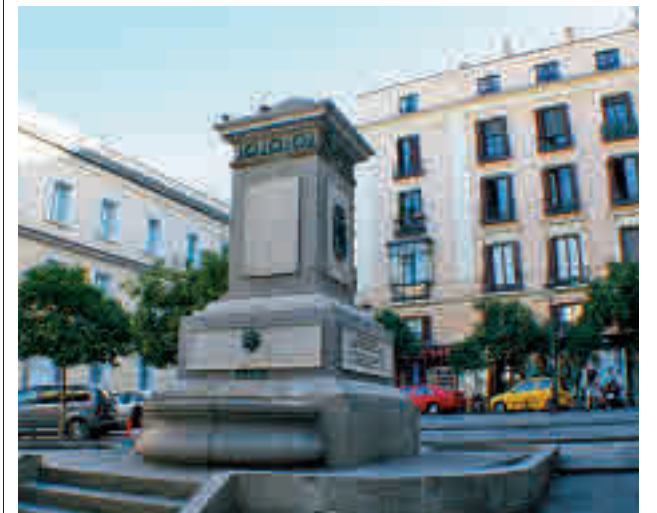
La emblemática plaza de la capital

Además, se creará una nueva plaza frente al remozado Teatro Albéniz, con bancos y arbolado de sombra, que funcionará como espacio de recepción y encuentro durante la entrada y salida de los espectáculos. Y también el actual aparcamiento en batería, destinado a vehículos oficiales, se pavimentará con el mismo material y configuración que el resto de la plaza.