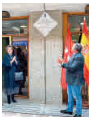
El acto oficial

La colocación de esta placa, que responde a un acuerdo