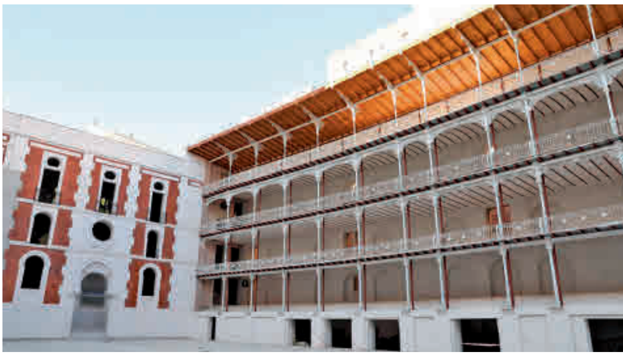
El patio interior del emblemático espacio deportivo situado en la calle de Marqués de Riscal