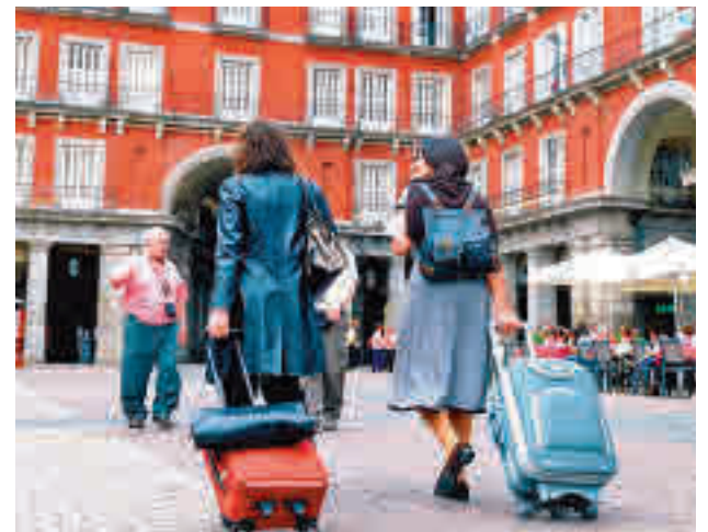
Turistas europeos en España

Esta incertidumbre se deja sentir de manera especial en dos países que son básicos para el turismo nacional. Reino Unido y Alemania atraviesan una situación económica delicada por cuestiones como el Brexit o la guerra de Ucrania, por lo que habrá que esperar a ver cómo se desarrollan los próximos meses para hacer una previsión.