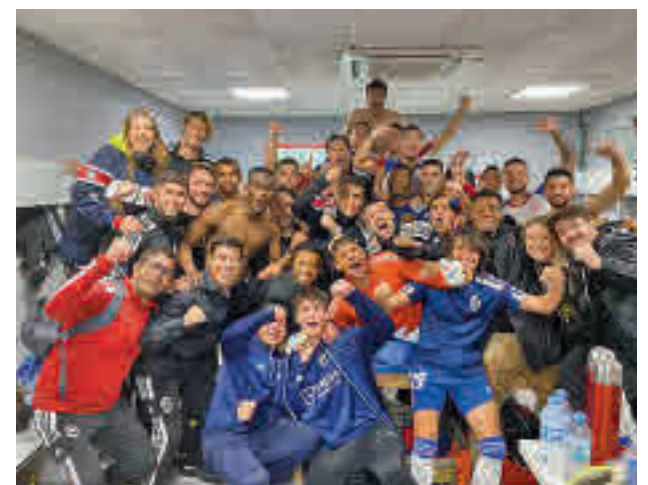
El vestuario del Rayo celebró su triunfo (4-1) ante el 'Fuenla'

ya se han metido en puestos de 'play-off' a la espera de lo que ocurra en Santo Domingo en el choque frente al Badajoz. La cita, este domingo 30 a partir de las 18 horas. Casi 24 horas antes, el sábado (19 horas) el Sanse visitará a un Depor inmerso en un mar de dudas, mientras que el Fuenlabrada recibe el domingo al líder, el Racing de Ferrol.