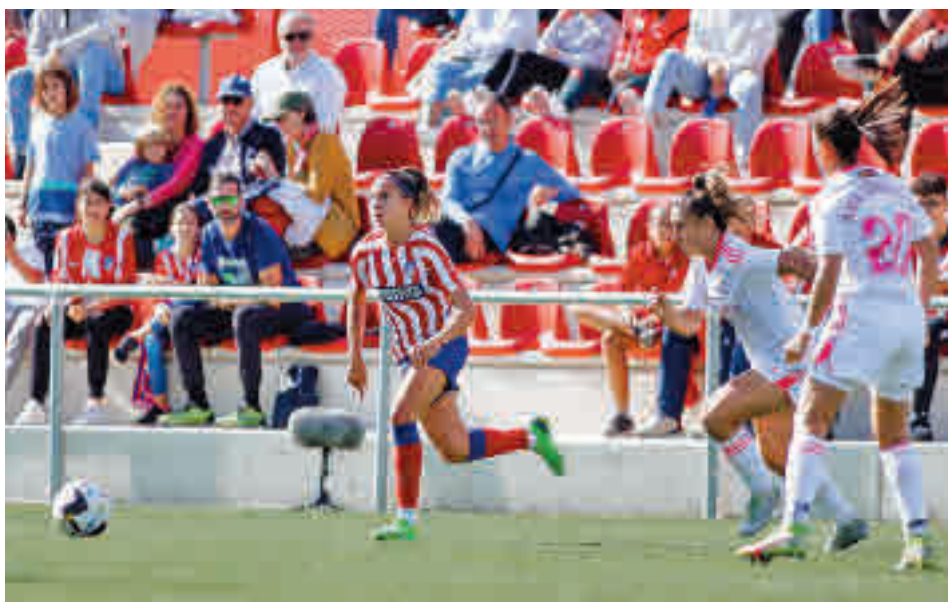
El derbi entre Atlético y Madrid CFF acabó en tablas (1-1)