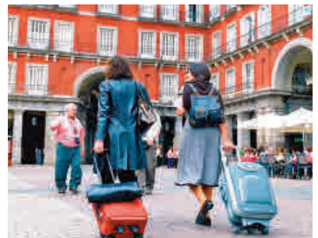
Turistas europeos en España

Esta incertidumbre se deja sentir de manera especial en dos países que son básicos para el turismo nacional. Reino Unido y Alemania atraviesan una situación económica delicada por cuestiones como el Brexit o la guerra de Ucrania, por lo que habrá que esperar a ver cómo se desarrollan los próximos meses para hacer una previsión.