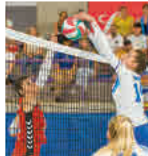
Regreso al Luis Buñuel

Con tres triunfos en otros tantos partidos, el Alcobendas Rugby encabeza el Grupo C de la División de Honor B. Este domingo (12:30 horas) jugará en Las Terrazas con el CD Arquitectura.