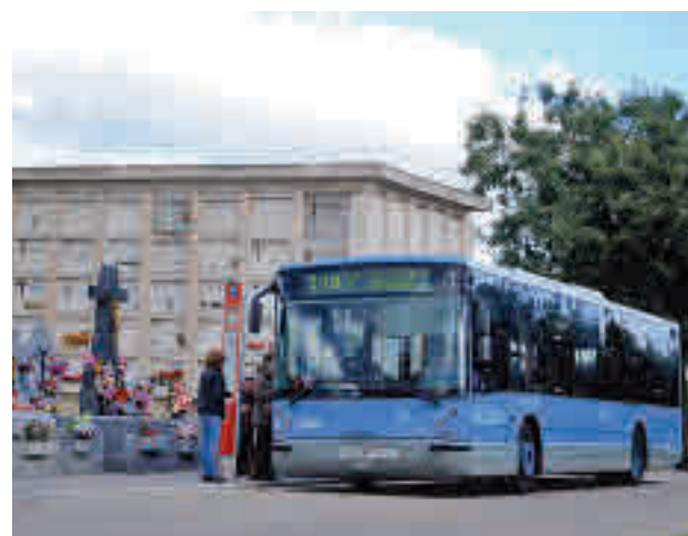
El autobús 110 que da servicio al cementario de la Almudena

visitantes se incrementará el número de vehículos en las rutas 25 (Plaza de España-Casa de Campo), 106 (Manuel Becerra-Vicálvaro), 108 (Oporto-Cementerio de Carabanchel), 110 (Manuel Becerra-Cementerio de La Almudena), 113 (Méndez Álvaro-Ciudad Lineal) y 118 (Embajadores-La Peseta), además de activar los servicios especiales Plaza Elíptica-Cemen-