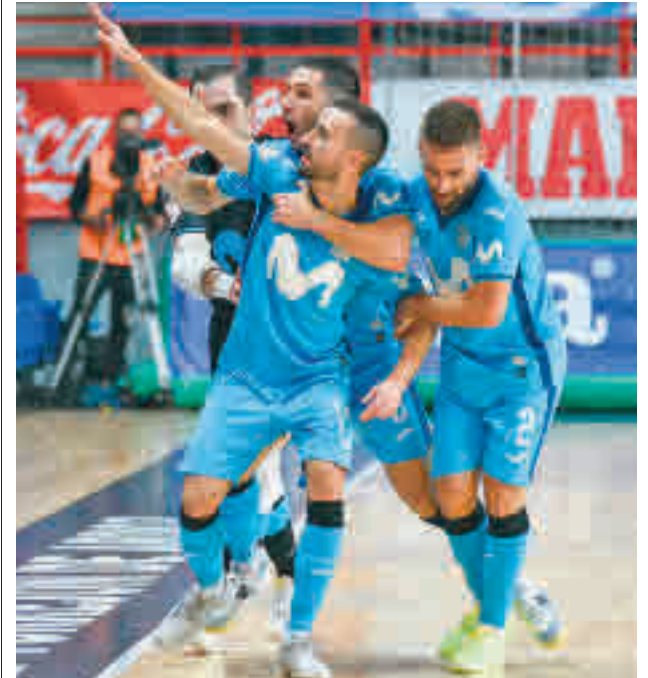
Segundo triunfo en el Jorge Garbajosa

Con tantas aperturas clasificatorias, el Inter tratará de afianzarse en la zona de 'play-off', un objetivo a corto plazo que pasa por sacar los tres puntos en su visita de este sábado 29 (17:30 horas) de la pista del Quesos Hidalgo Manzanares, un rival que viene de perder sus dos últimos partidos ante Cartagena y Antequera por el mismo resultado: 5-3.