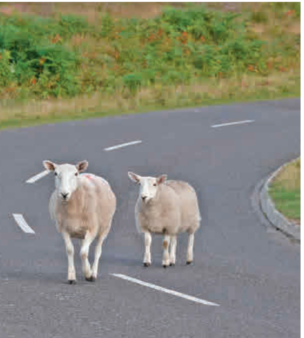
Los accidentes con animales son cada vez más frecuentes

Las partes del coche más afectadas son el parachoques delantero, la rejilla y el capó (39%), seguidos de los faros e intermitentes delanteros