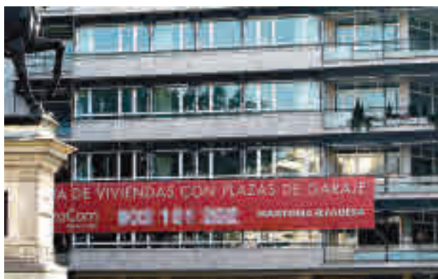
Viviendas en venta

En concreto, en la Comunidad de Madrid se registraron en agosto 1.826 transac-