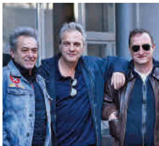
El grupo Hombres G, protagonista indirecto

EL PERIÓDICO GENTE NO SE RESPONSABILIZA NI SE IDENTIFICA CON LAS OPINIONES QUE SUS LECTORES Y COLABORADORES EXPONGAN EN SUS CARTAS Y ARTÍCULOS