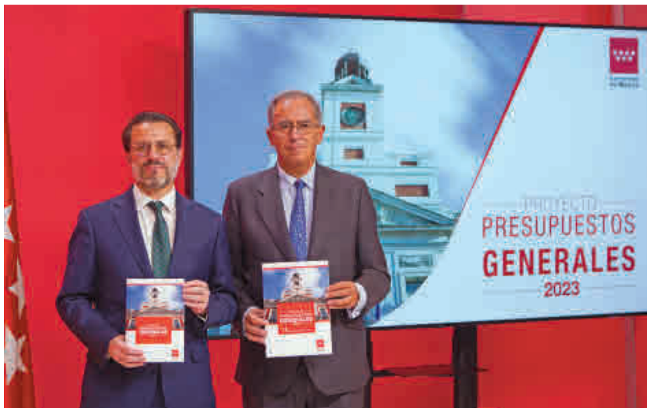
Presentación de los Presupuestos de la Comunidad de Madrid para el año que viene

Los nuevos Presupuestos, los últimos de la legislatura, se han elaborado basándose en unas previsiones de crecimiento de organismos externos del 1,8% para el próximo año y la generación de 50.000 puestos de trabajo. Las cuentas incluyen las últimas rebajas aprobadas en impuestos, como la deflactación del IRPF o la ampliación hasta el 25% de la bonificación del impuesto de Sucesiones y Donaciones para hermanos y entre tíos y sobrinos.