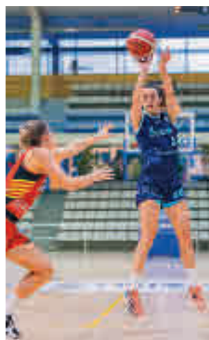
El Leganés es colista

pero parece que equipos como el Innova-tsn Leganés deberán hacer méritos para obtener la permanencia. El cuadro pepinero es colista