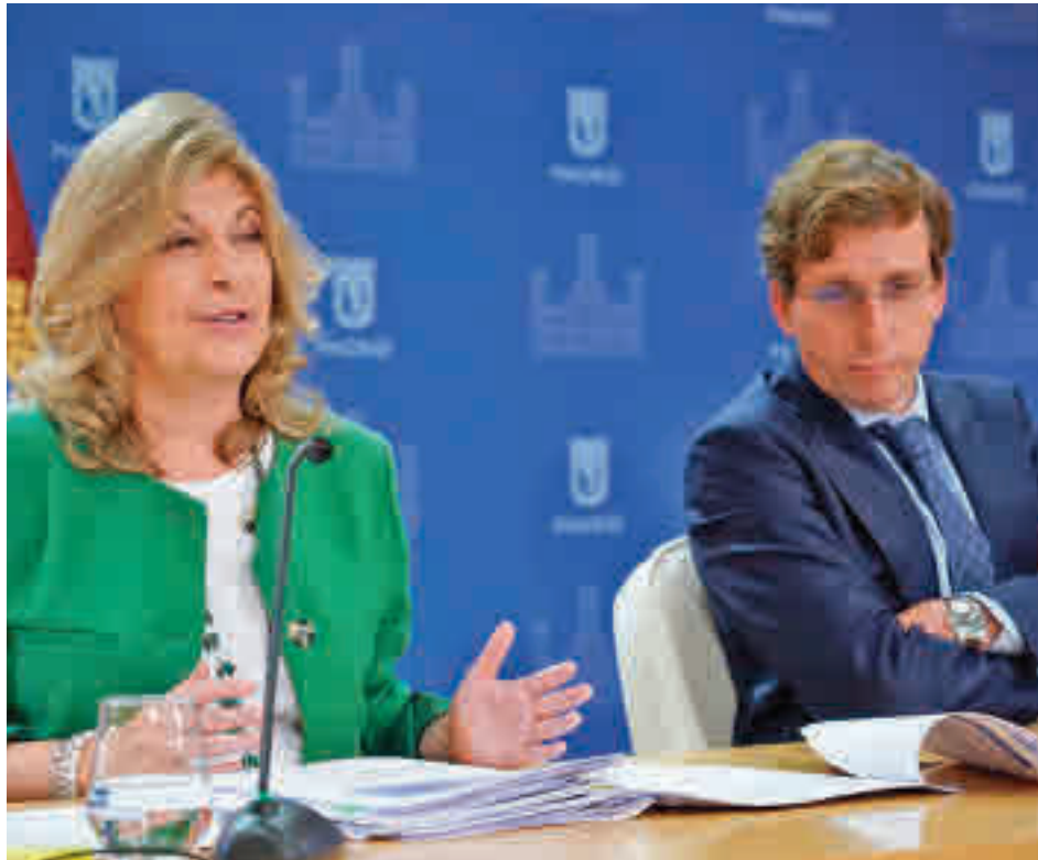
La presentación del proyecto de cuentas tuvo lugar en el Palacio de Cibeles el 27 de octubre

Al respecto, el proyecto de ordenanzas fiscales para el próximo año quiere rebajar el tipo del Impuesto de Bienes Inmuebles (IBI) al mínimo legal pasando del 0,456% al 0,40% para beneficiar a 2,2 millones de recibos. A juicio del primer edil, se trata de unos presupuestos decisivos.