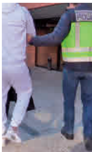
La actuación policial

mercial La Gavia, en el Ensanche de Vallecas, que tuvo lugar justo hace dos meses y en el que se sustrajeron joyas valoradas en 250.000 euros. Tras varias gestiones, fueron identificados los cuatro autores, que contaban con