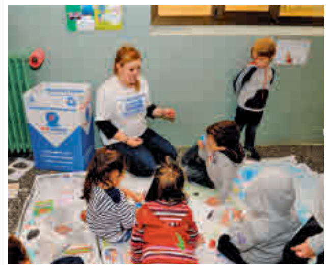
Una de las actividades de anteriores ediciones

Toda la actualidad de los distritos de Madrid en nuestra web