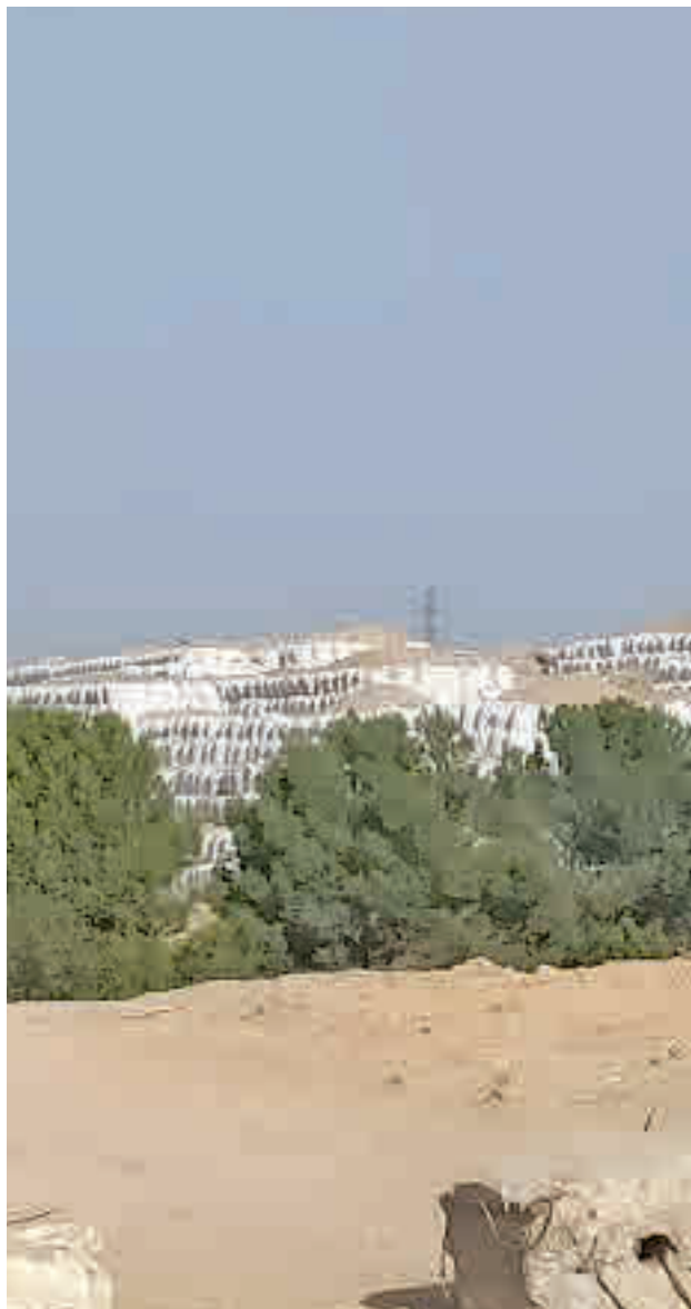
Las sacas que contienen los residuos tóxicos de Las Lomas

Además, la semana pasada colectivos vecinales y ecologistas llevaron el caso ante la Guardia Civil, solicitando también su investigación.