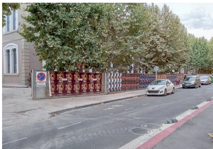
La primera sección de Duquesa de la Victoria.

Así, Izquierda Unida plantea que el avance en peatonalizar el centro de Logroño vuelva a ser