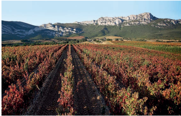
El paisaje de Rioja Alavesa.

Con la misma mayoría, el Pleno decidió que, en caso de que