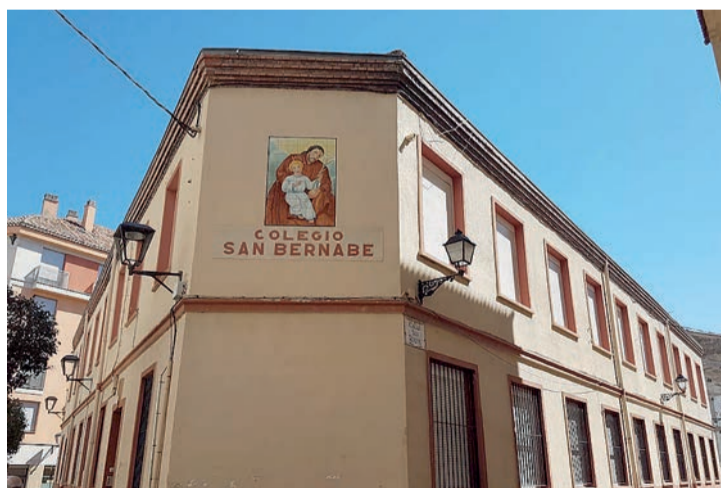
El colegio San Bernabé, en La Villanueva.

Además, el Consistorio continúa avanzando en los trámites para abrir el Centro de la Cultura del Ríoja