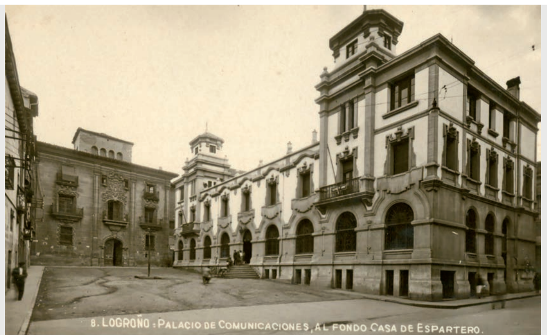
B. LOGROÑO · PALACIO DE COMUNICACIONES, AL FONDO CASA DE ESPARTERO.