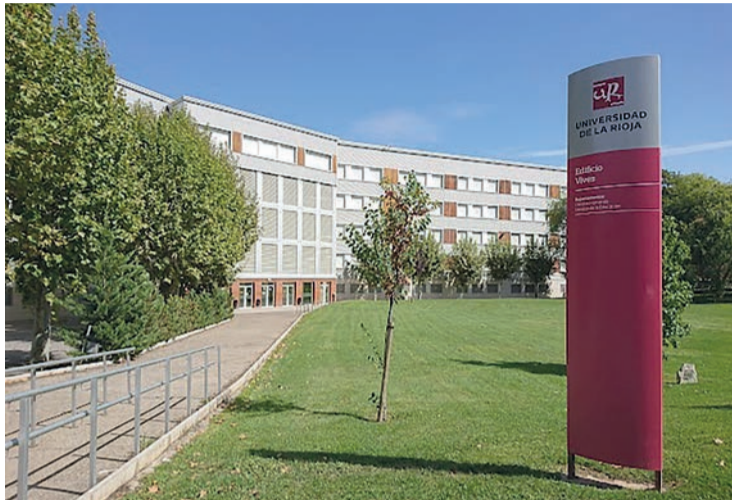
El campus de la Universidad de La Rioja.

El Consejo de Estudiantes de la Universidad de La Rioja (UR) criticó el retraso en el inicio de varias asignaturas debido a lo que consideran que “una mala gestión y falta de profesorado”, lo que, según sus datos, provocó la pérdida de 44 horas lectivas: “La mala planificación para cubrir las plazas docentes causó procesos de contratación una vez comenzado el curso académico, a pesar de que muchas ya se conocían desde el 18 de julio. Eso conllevó un mínimo de 44 horas perdidas de docencia, que el estudiantado ya había pagado en su matrícula, una presión