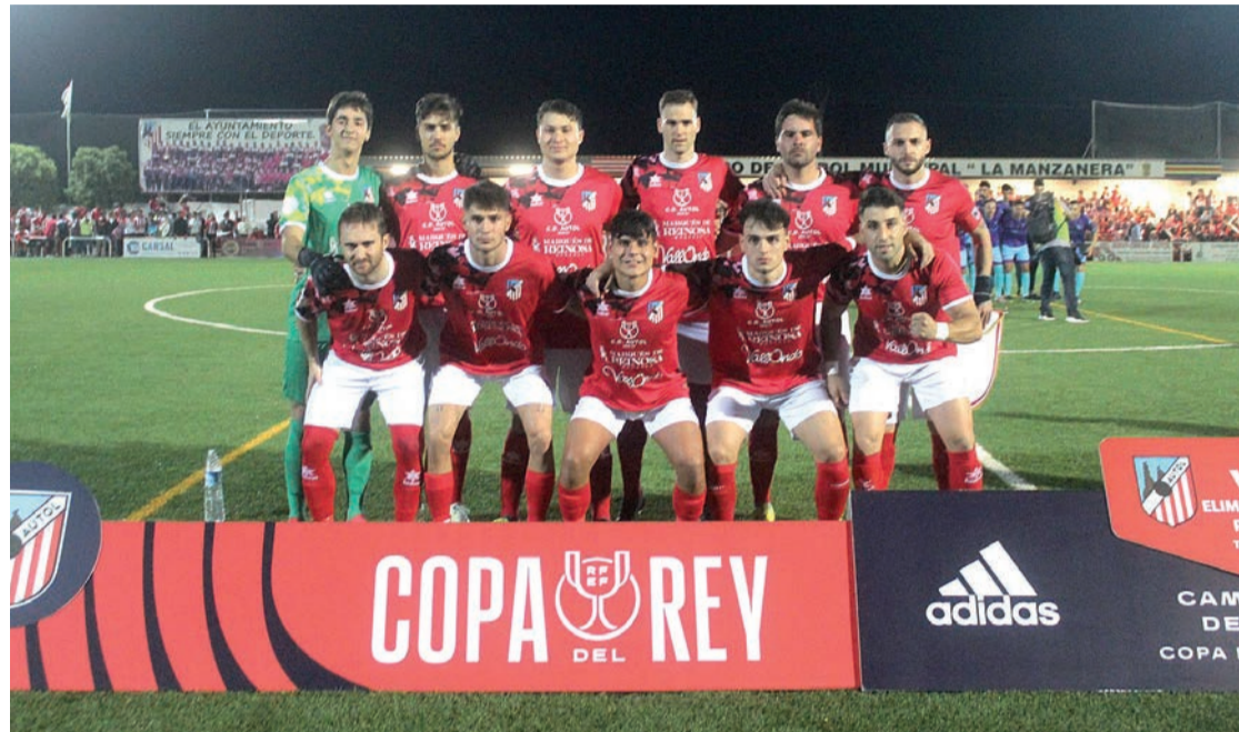
La alineación que saltó al campo de La Manzanera contra el Dinamo San Juan.