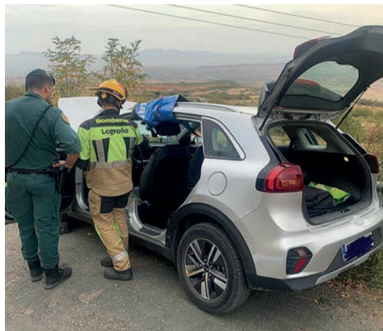
El vehículo accidentado en la LR-345.