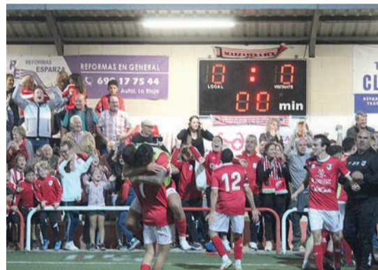
La alegría de los jugadores y la afición del Autol.