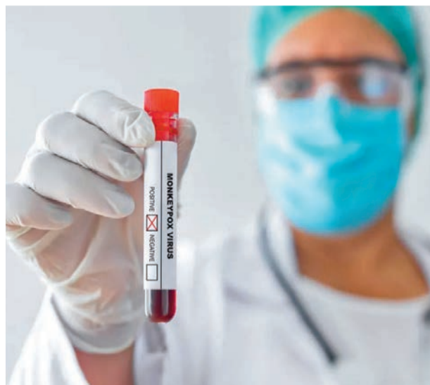
La viruela del mono sigue presente

ropeo para el Control y la Prevención de Enfermedades (ECDC, por sus siglas en inglés) y la Oficina Regional para Europa de la Organización Mundial de la Salud (OMS). De acuerdo con el informe de ECDC y OMS, publicado este miércoles, hasta el momento se han producido en Europa 736 hospitalizaciones, el 6% del total de casos diagnosticados. De ellos,