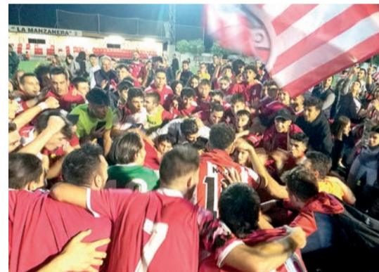
Futbolistas y aficionados catones, abrazados en el césped.