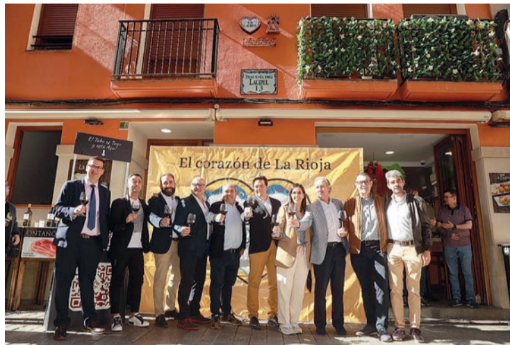
La foto de hermandad de Laurel y El Tubo.