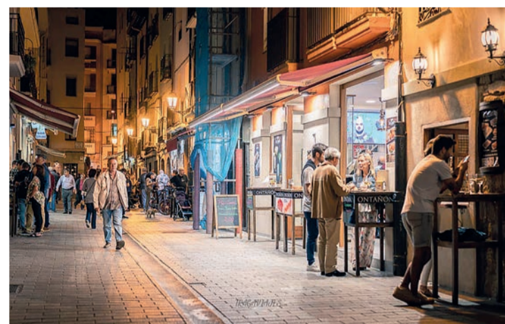
La Travesía de Laurel, foco de turismo en Logroño.

La región tuvo 224.547 personas alojadas en hoteles, por 235.411 de 2019