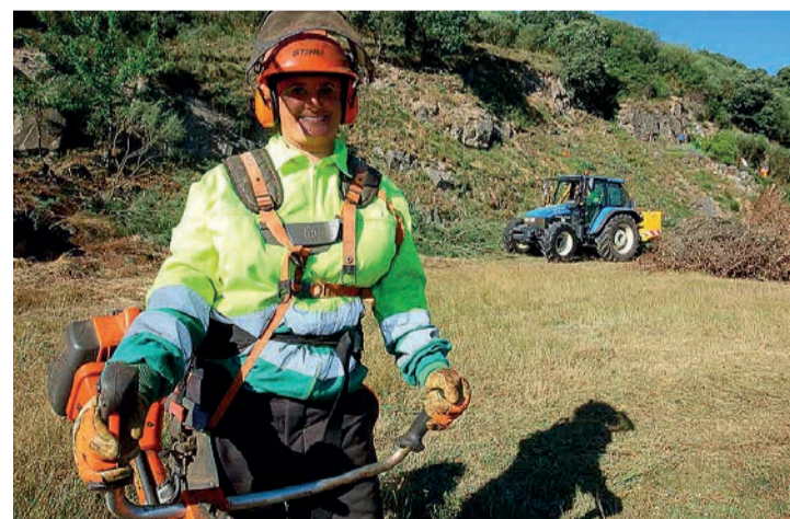
Trabajos forestales en la comunidad riojana.

En el conjunto de España, el paro subió en 60.800 personas entre julio y septiembre, lo que significa casi un 2,1% más que en el trimes-