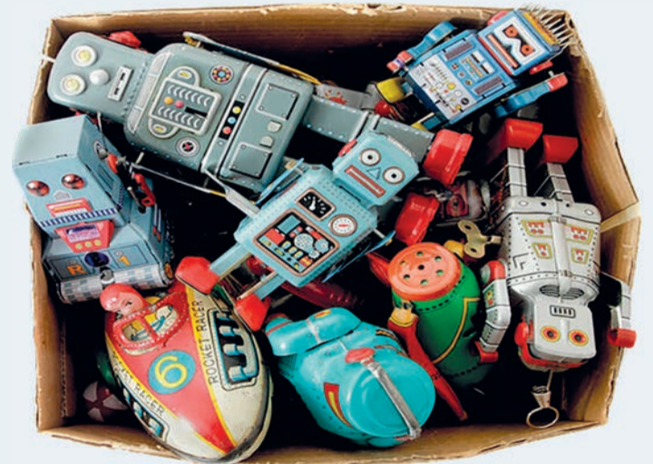
La caja de juguetes.

co, en mi casa estas herramientas se guardaban en una maleta pequeña de madera, que todavía conservo. Estaba la caja de los papeles, donde se guardaban los recibos y papeles importantes que pudieran hacer falta en un futuro. Todas las cosas tenían su caja particular, pero una sola. Y la caja de los juguetes. Yo recuerdo que tenía dos cajas de zapatos que guardaba en mi mesilla: una para los indios de goma y otra para los demás juguetes. Vamos, parecido a mis nietos, que tienen más juguetes que en una juguetería de aquellos años. La verdad es que entonces teníamos pocas cosas, en cambio ahora creo que tenemos demasiadas. Pero es el momento que nos ha tocado vivir y hay que apechugar con ello.