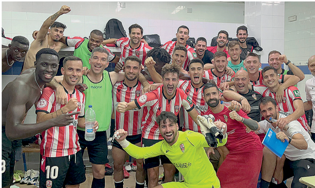
La celebración de los futbolistas de la Unión Deportiva Logroñés en Alcoi.