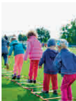
Habrá diferentes actividades

de enero de 2023 en los colegios públicos. Tomás Bretón, Tirso de Molina y Menéndez Pelayo, de 9 a 16 horas. La inscripción se podrá realizar online hasta el próximo 10 de noviembre y al día siguiente se realizará el sorteo de plazas. En esta iniciativa podrán participar niños y niñas de 3