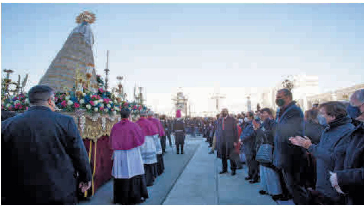
La procesión del año pasado por las calles de la ciudad