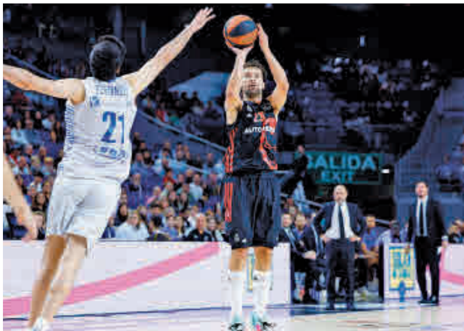
El Real Madrid volvió a la senda de la victoria a costa del Carplus Fuenlabrada