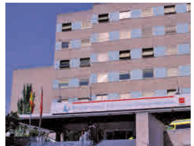
Presentación del nuevo edificio