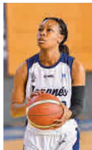
Triunfo del Leganés

También ganó el Movistar Estudiantes, en su caso ante el Barça CBS (66-61), resultado que coloca cuartas a las colegiales antes de visitar este sábado (18:15) al Bembibre.