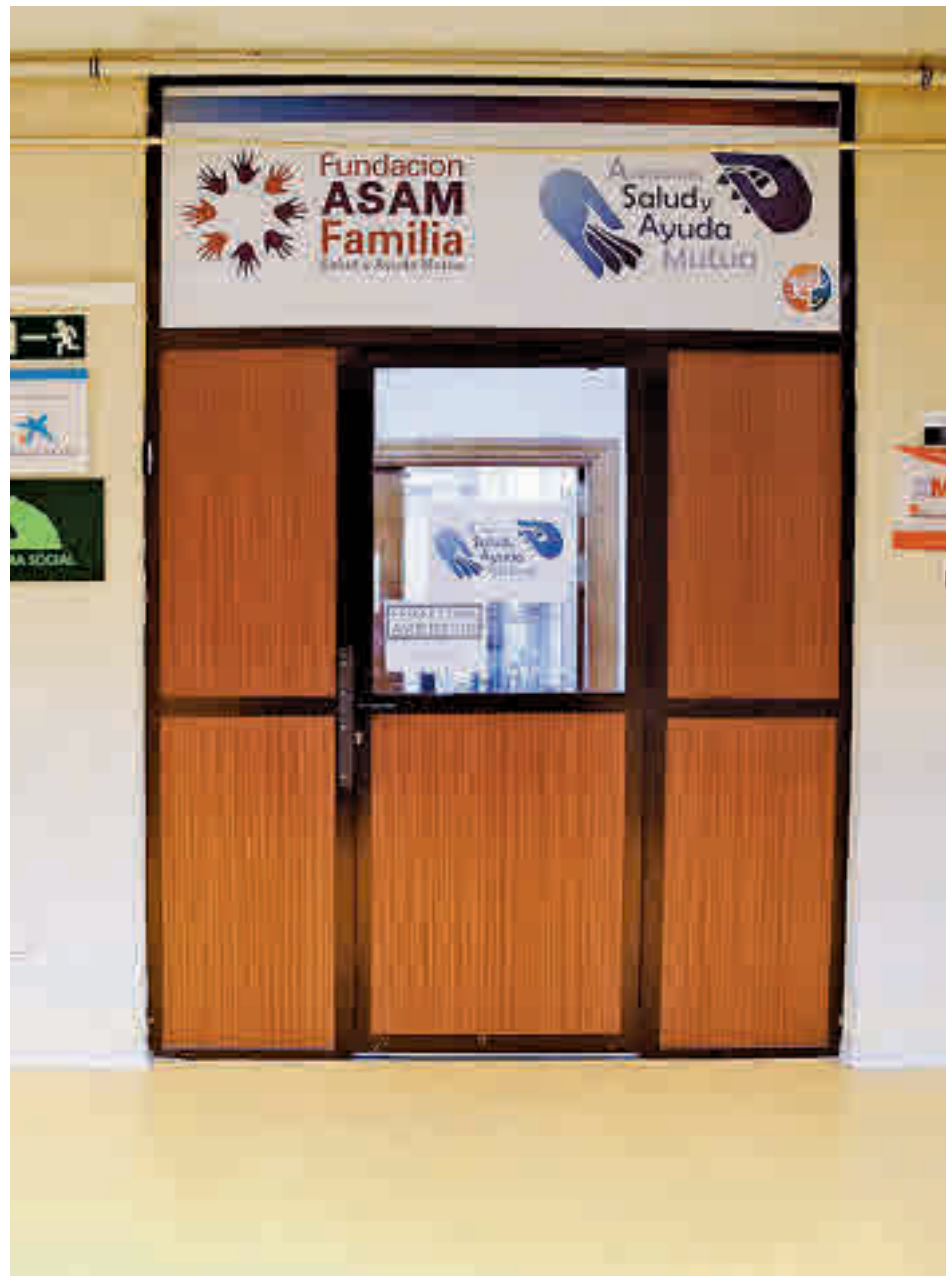
El programa se ofrece en un centro de Aluche

El programa ofrece una "atención integral" para jóvenes y se sustenta en el ocio saludable durante los fines de se-