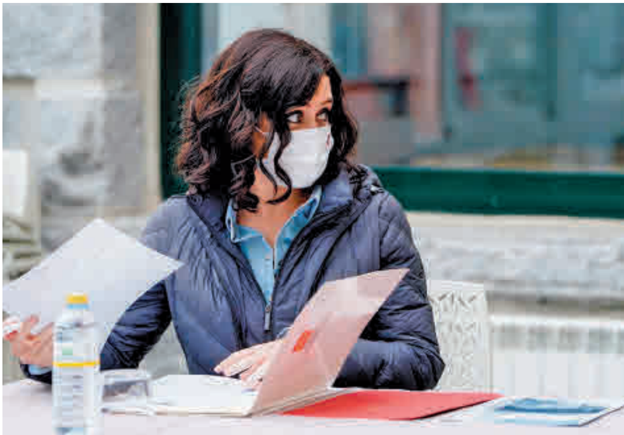
Visita el año pasado de Isabel Díaz Ayuso a la estación de Navacerrada