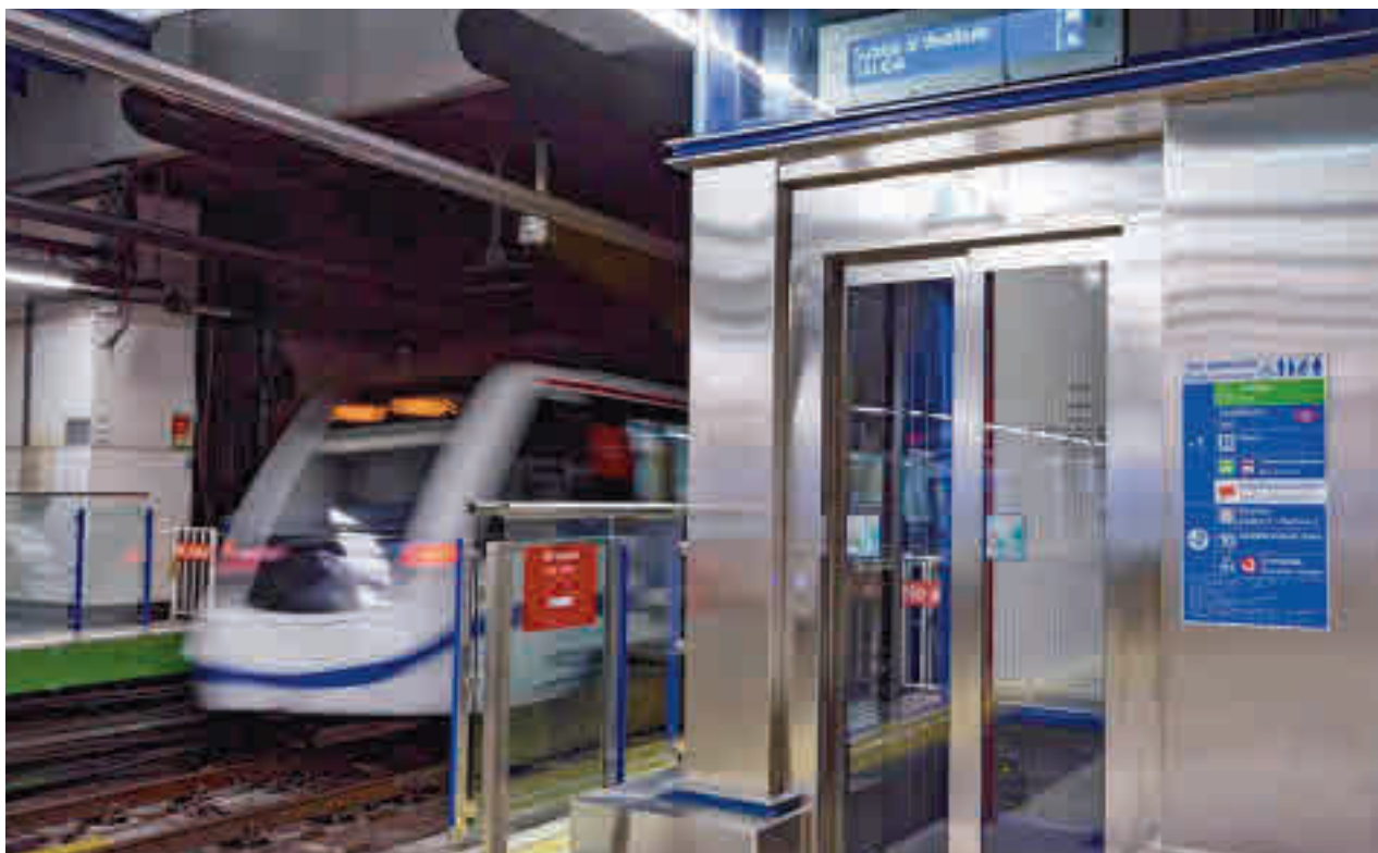
Actual estación de la Línea 11 de Metro