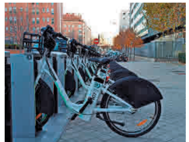
Uno de los puntos de anclajes de BiciMAD

El alcalde de Madrid, José Luis Martínez-Almeida, aseguró el pasado lunes 31 de octubre que las primeras estaciones de la futura ampliación llegarán a los nuevos distritos en enero y se situarán en Hortaleza, Villaverde, Villa de Vallecas, Vicálvaro, San Blas-Canillejas y Barajas.