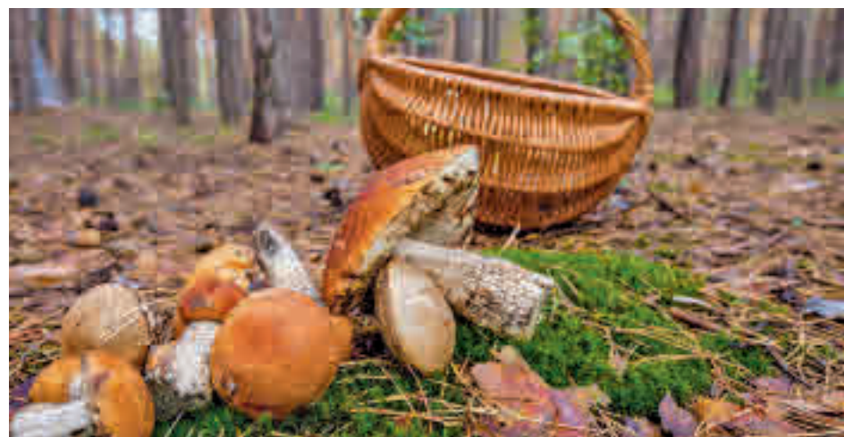
Los montes madrileños se pueblan de setas

Desde el Gobierno regional han hecho hincapié en que Madrid cuenta con una extensísima variedad, pero es imprescindible identificarlas correctamente, ya que algunas son tóxicas, veneno-