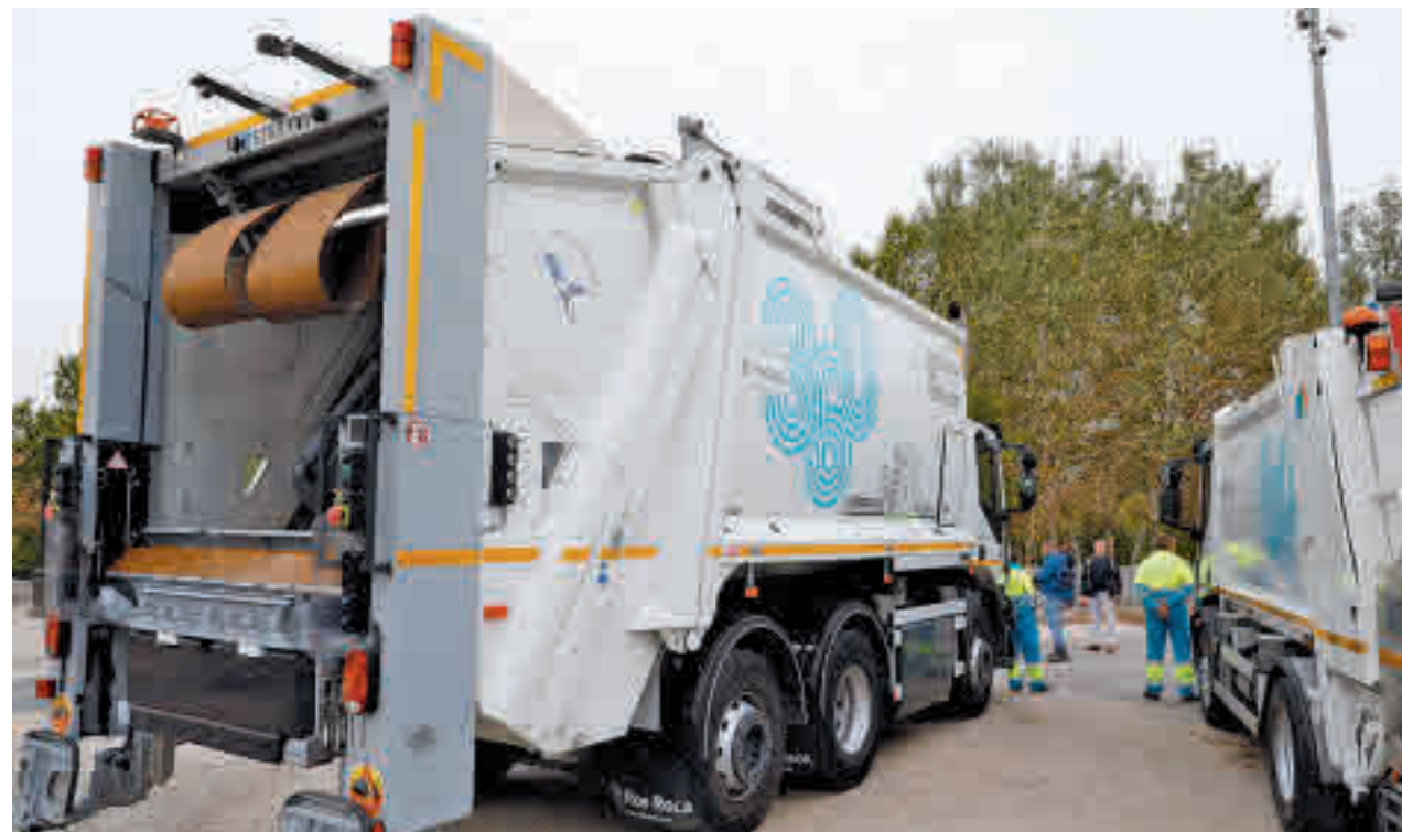
Otra de las novedades será la retirada de cartón comercial 'puerta a puerta'

El distrito Centro implantará un proyecto piloto de contenedores soterrados en una treintena de ubicaciones, que deberán estar funcionando en un plazo máximo de 18 meses. Fuentes municipales explican que esta medida tiene como objetivo reducir el impacto visual de los residuos en la vía pública. Además, se renovarán los buzones de los recipientes ya existentes en el distrito de Salamanca.