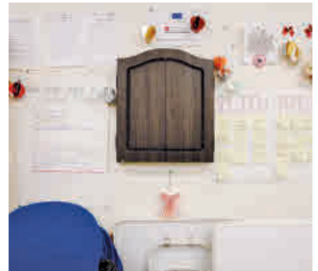
Centro de la Fundación ASAM

El objetivo de la Fundación ASAM es conseguir un apoyo psicológico "de calidad y más accesible". Aunque este programa está limitado a los jóvenes, pueden ofrecer ayuda a "cualquier otra persona que necesite apoyo".