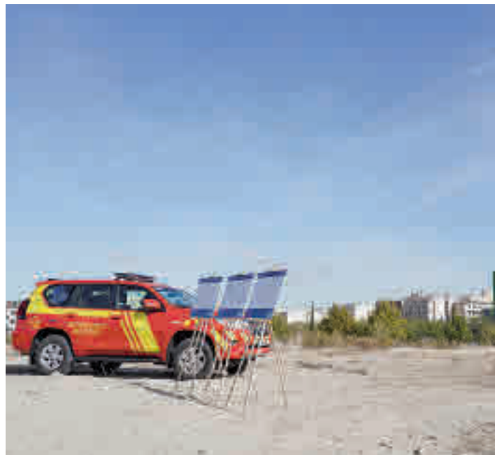
Los terrenos donde se levantarán las nuevas dependencias

El alcalde de Madrid, José Luis Martínez-Almeida, puso la primera piedra de la actuación el 2 de noviembre • Las nuevas instalaciones estarán situadas en el polígono industrial de la Atalayuela