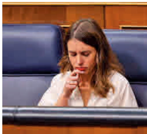
La ministra de Igualdad, Irene Montero

EL PERIÓDICO GENTE NO SE RESPONSABILIZA NI SE IDENTIFICA CON LAS OPINIONES QUE SUS LECTORES Y COLABORADORES EXPONGAN EN SUS CARTAS Y ARTÍCULOS