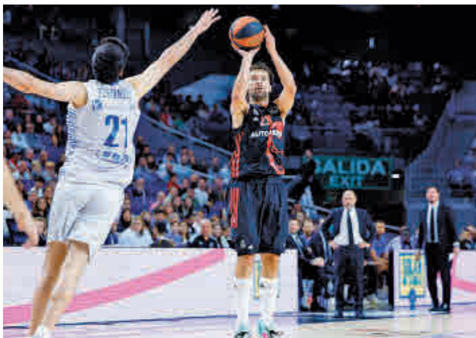
El Real Madrid volvió a la senda de la victoria a costa del Carplus Fuenlabrada