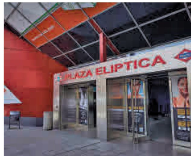
Línea 11 de Metro