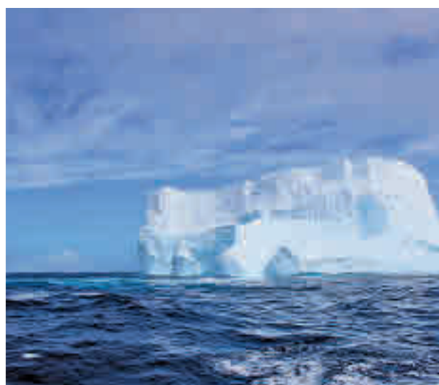
Iceberg flotando en el océano Antártico

2021, lo que significa que continúa su tendencia a la baja, según los datos de la NASA. En cuanto a la superficie que ocupa, el agujero de ozono antártico alcanzó un área promedio de 23,2 millones de kilómetros cuadrados entre el 7 de septiembre y el 13 de octubre de 2022. "Con el tiempo, se está logrando un progreso constante y el agujero se está hacien-