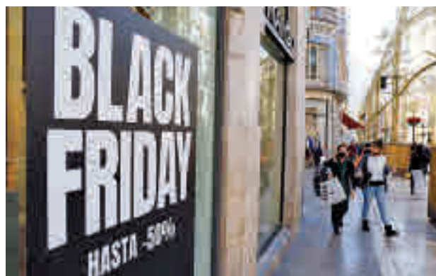
Ofertas en el Black Friday

ge más de 700 puestos de trabajo ofertados. En este sentido, InfoJobs ha recordado que en Toledo y Guadalajara se encuentran algunos de los centros de distribución más importantes a nivel nacional. A falta de un mes para la celebración del 'Black Friday', la plataforma ha señalado que