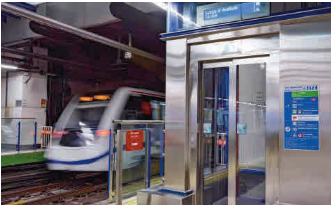
Actual estación de la Línea 11 de Metro