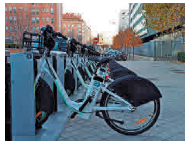
Uno de los puntos de anclajes de BiciMAD

El alcalde de Madrid, José Luis Martínez-Almeida, aseguró el pasado lunes 31 de octubre que las primeras estaciones de la futura ampliación llegarán a los nuevos distritos en enero y se situarán en Hortaleza, Villaverde, Villa de Vallecas, Vicálvaro, San Blas-Canillejas y Barajas.