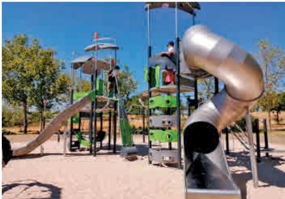
Uno de los parques en los que se ha actuado

Para estos trabajos cada barrio y en cada área infantil se ha valorado los grupos de edad más adecuados para que desde los más pequeños hasta los adolescentes, cuenten cerca de su casa con elementos de esparcimiento como estos en los que poder divertirse. En las diferentes áreas no solo se han renova-