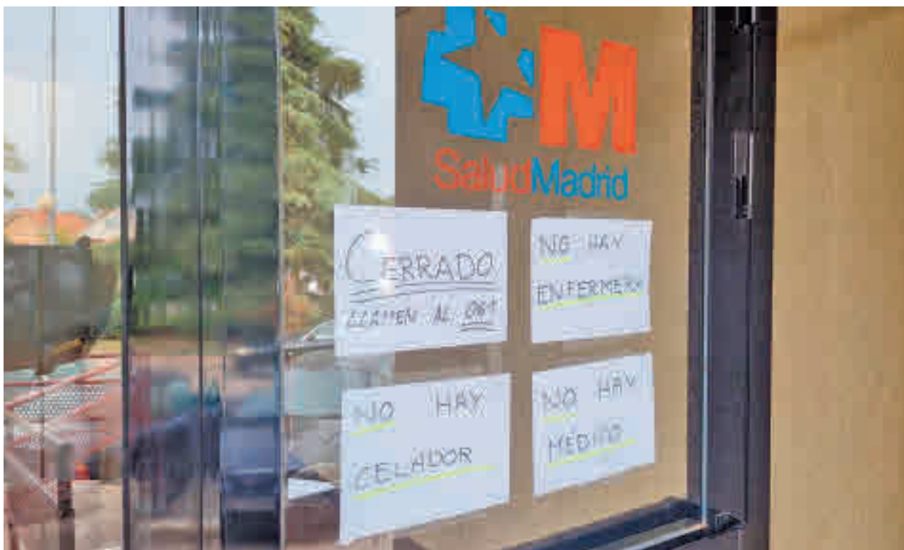
Carteles alertando del cierre del servicio de urgencias del Jaime Vera de Coslada