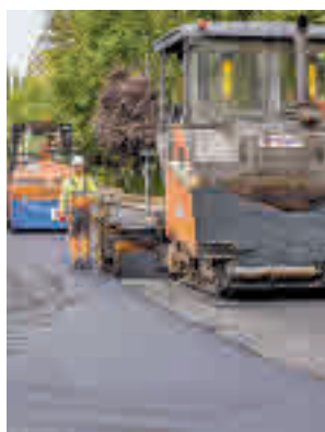
Trabajos en la calle Apolo

cie. El tipo de pavimentación usado tiene un mejor comportamiento fonoabsorbente, y disminuye la contaminación acústica que provocan los vehículos a su paso. La inversión ha sido de 565.000 euros y entre las calles se encuentran la avenida de la Constitución, la carretera de