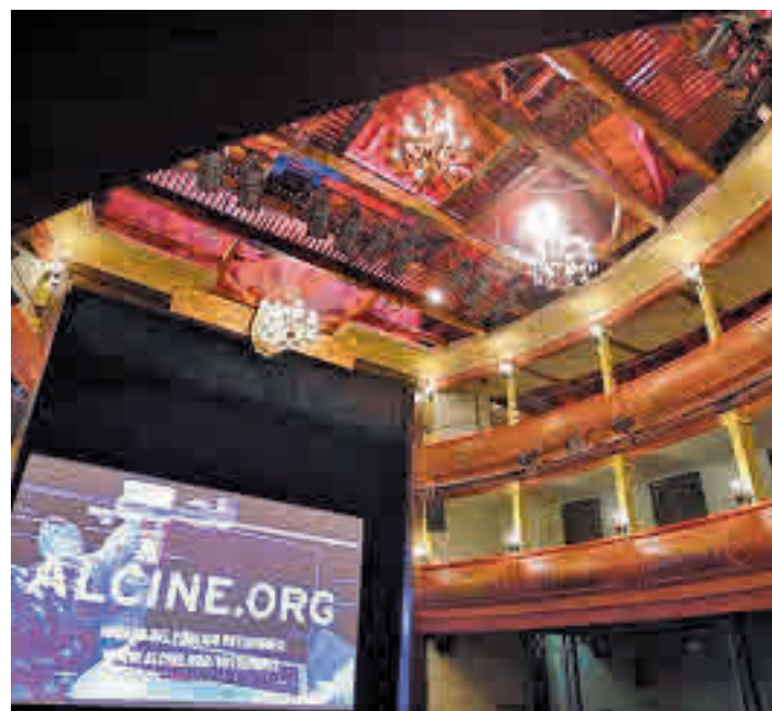
Patio de butacas del Teatro Salón Cervantes COMUNIDAD DE MADRID

Para el Certamen Europeo de Cortometrajes se han presentado 1.226 cintas, de las cuáles han sido escogidas 53 • La selección de Pantalla Abierta proyectará los debuts de antiguos premiados