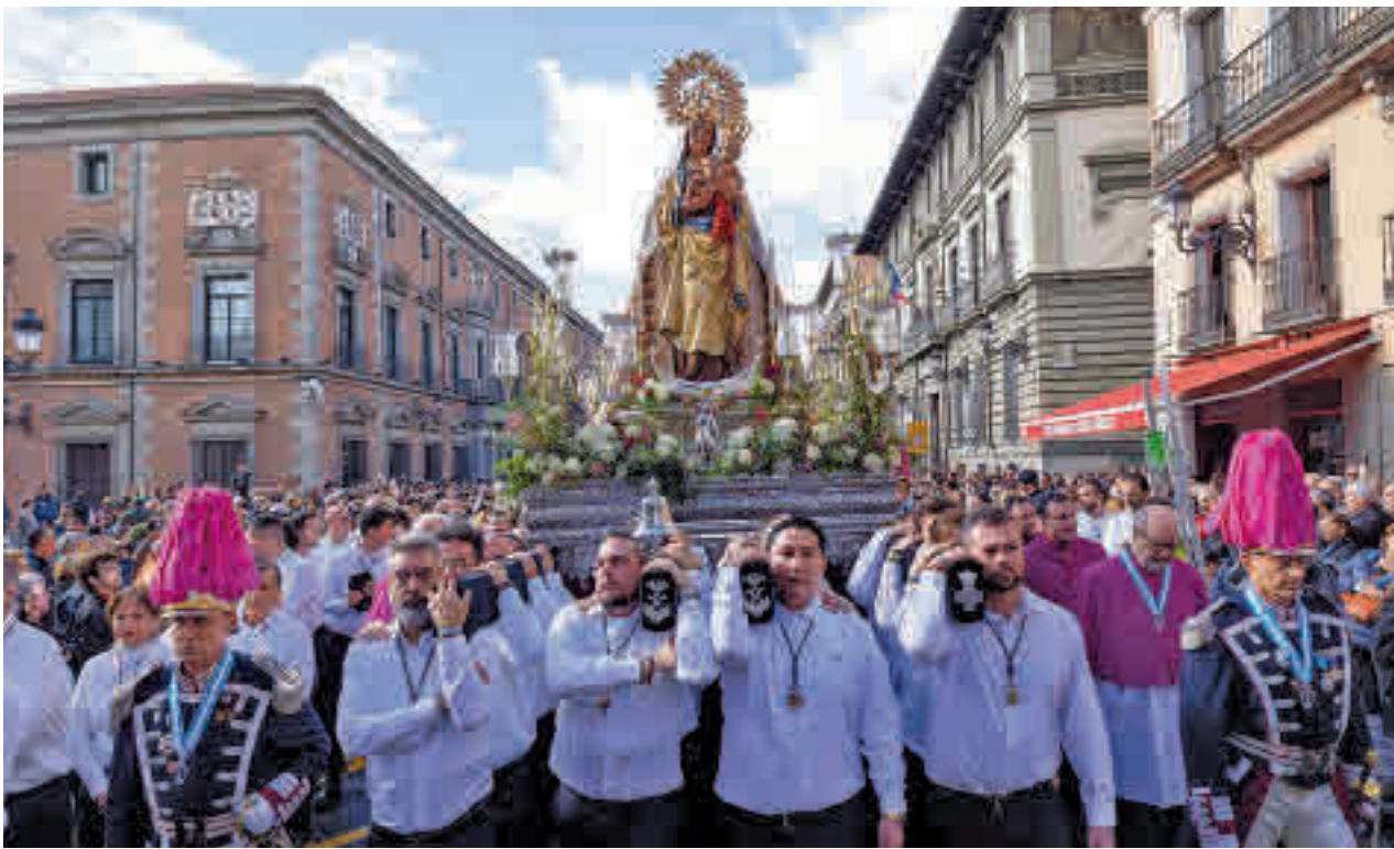
La procesión de la Virgen de la Almudena que discurrió por las calles del Centro el miércoles 9 de noviembre