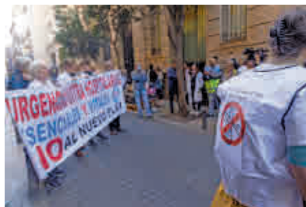
Protestas de los médicos

La organización sindical reclama a la Consejería de Sanidad que se sienta a negociar “un ver-