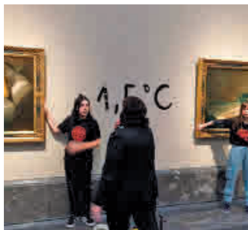
Protesta de unas activistas en El Prado

EL PERIÓDICO GENTE NO SE RESPONSABILIZA NI SE IDENTIFICA CON LAS OPINIONES QUE SUS LECTORES Y COLABORADORES EXPONGAN EN SUS CARTAS Y ARTÍCULOS