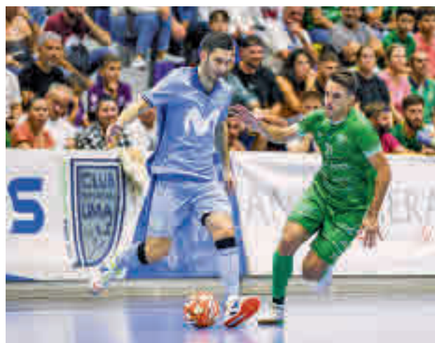
El equipo de Torrejón perdió en su visita a Antequera

off' (tres puntos le separan del octavo clasificado). Con estos números en la mano y tras dos derrotas consecutivas, el equipo de Torrejón de Ardoz tratará de reencontrarse con la victoria. El próximo partido lo jugará este sábado (18 horas) en casa ante Industrias Santa Coloma.