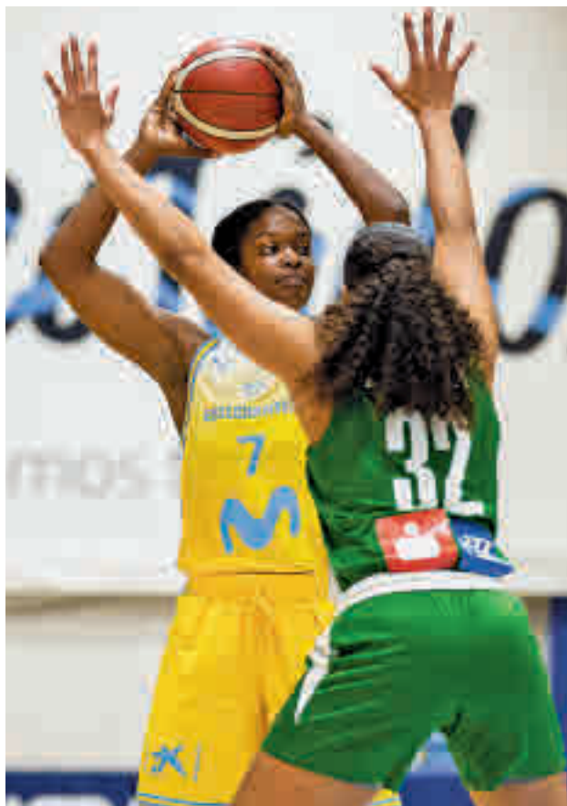
El equipo colegial regresa a Magariños

EL INNOVA-TSN LEGANÉS VISITARÁ LA PISTA DEL KUTXABANK ARASKI