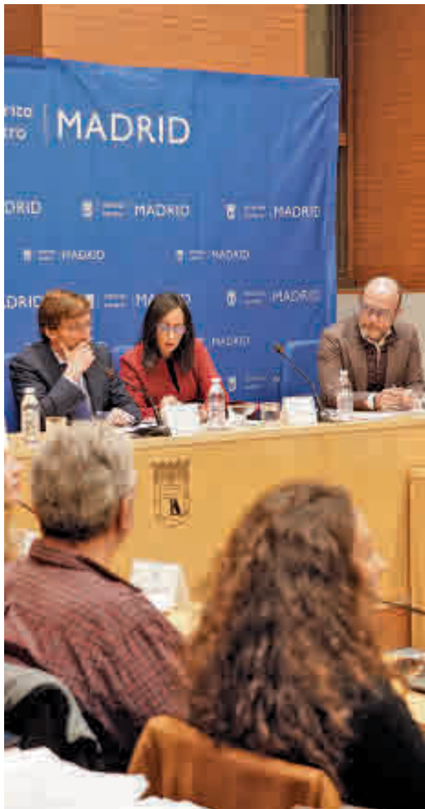
Un momento de la reunión del 7 de noviembre