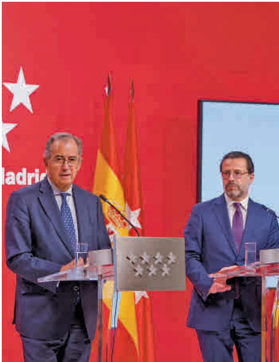
Rueda de prensa del Consejo de Gobierno posterior a la aprobación

El objetivo es que las deducciones anunciadas en estos días inicien ahora su trámite parlamentario y se apliquen a partir del próximo año.