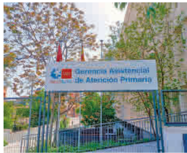
La Atención Primaria, en el punto de mira