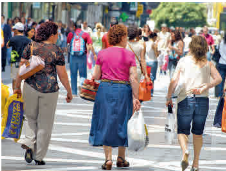
Las compras se están viendo afectadas por la inflación

Cetelem también ha hecho un estudio a nivel nacional en relación al efecto de la inflación en los gastos generales de los españoles, donde ocho de cada diez aseguran que reducirán sus inversiones por culpa de las subidas de precios. En este caso, los productos que los consumidores han descartado adquirir son los smartphones (con un 27,3%, frente al 19% de antes del verano), los viajes (también con un 27%) y los artículos relacionados con los videojue-