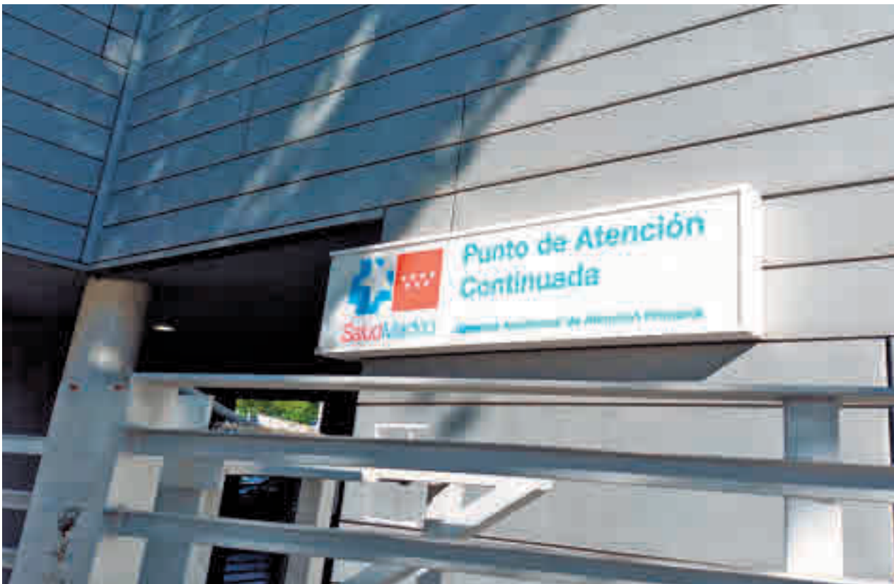
Punto de Atención Continuada en la Comunidad de Madrid