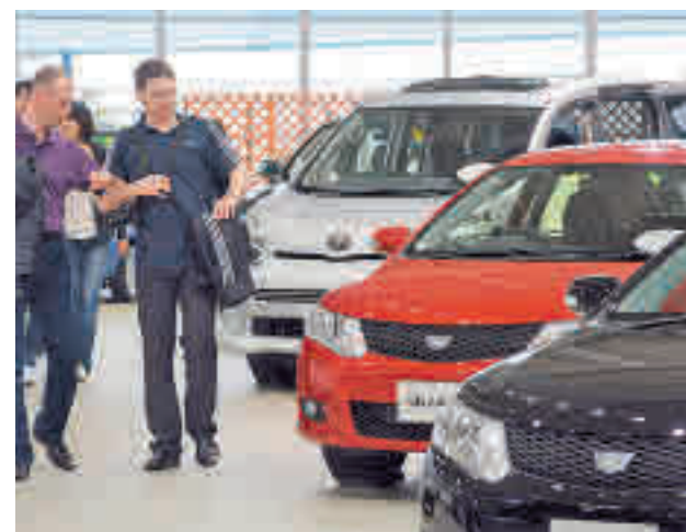
Concesionario de coches

Los datos de Madrid contrastan con lo que se registran en el conjunto del país, donde las ventas se redujeron un 5,6% en el mes de octubre con respecto al de 2021. Es el noveno mes consecutivo de descenso, lo que se traduce en una pérdida del 4,8% en lo que va de 2022.