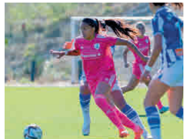
El Madrid CFF es la revelación del campeonato