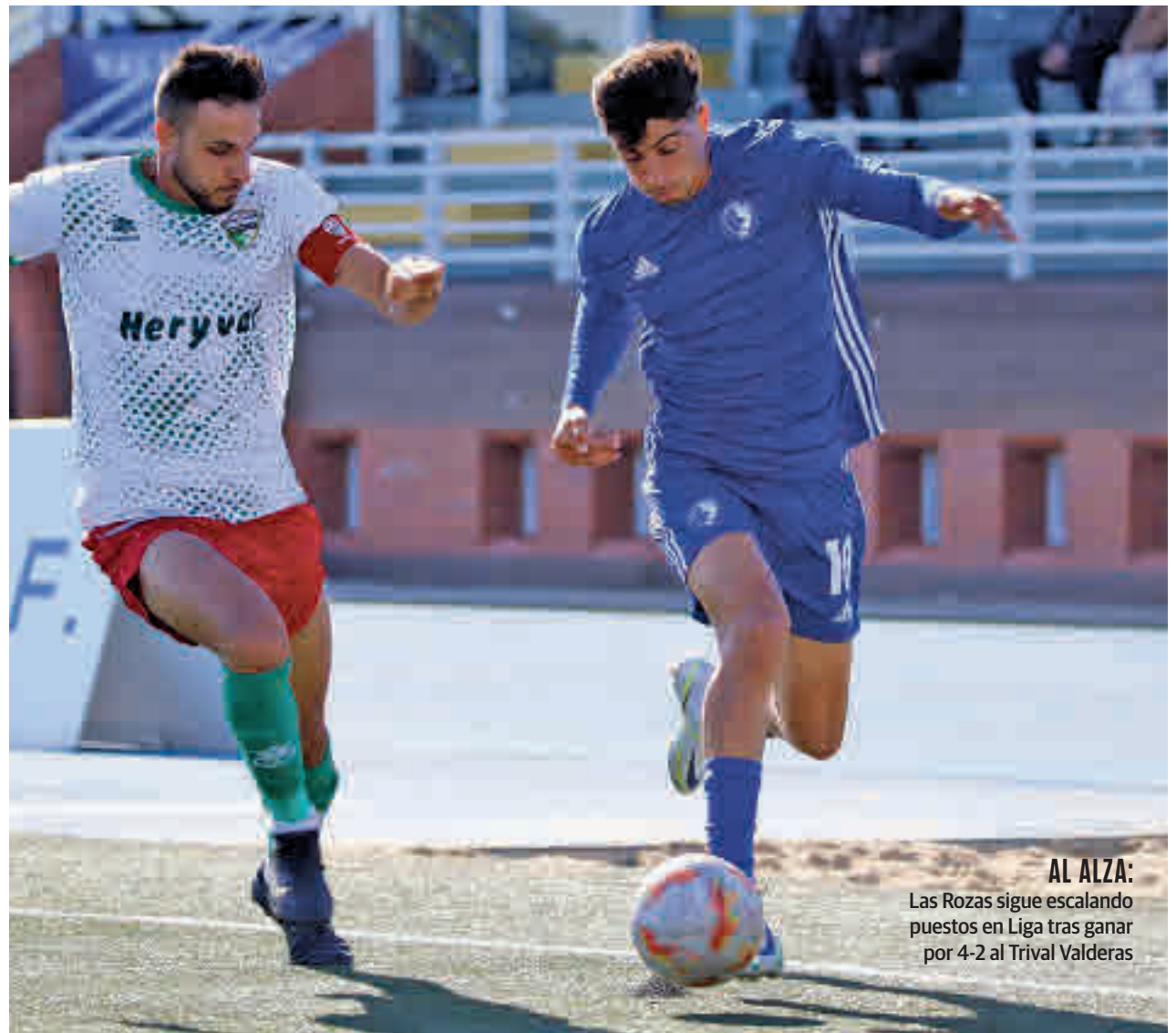
AL ALZA: Las Rozas sigue escalando puestos en Liga tras ganar por 4-2 al Trival Valderas

Por su parte, tanto a Navalcarnero como a Unión Adarve, clubes que compiten en el Grupo 5 de Segunda Federación, les tocaron en suerte sendos rivales de Primera Federación. A pesar de no contar con ese regalo que supon-