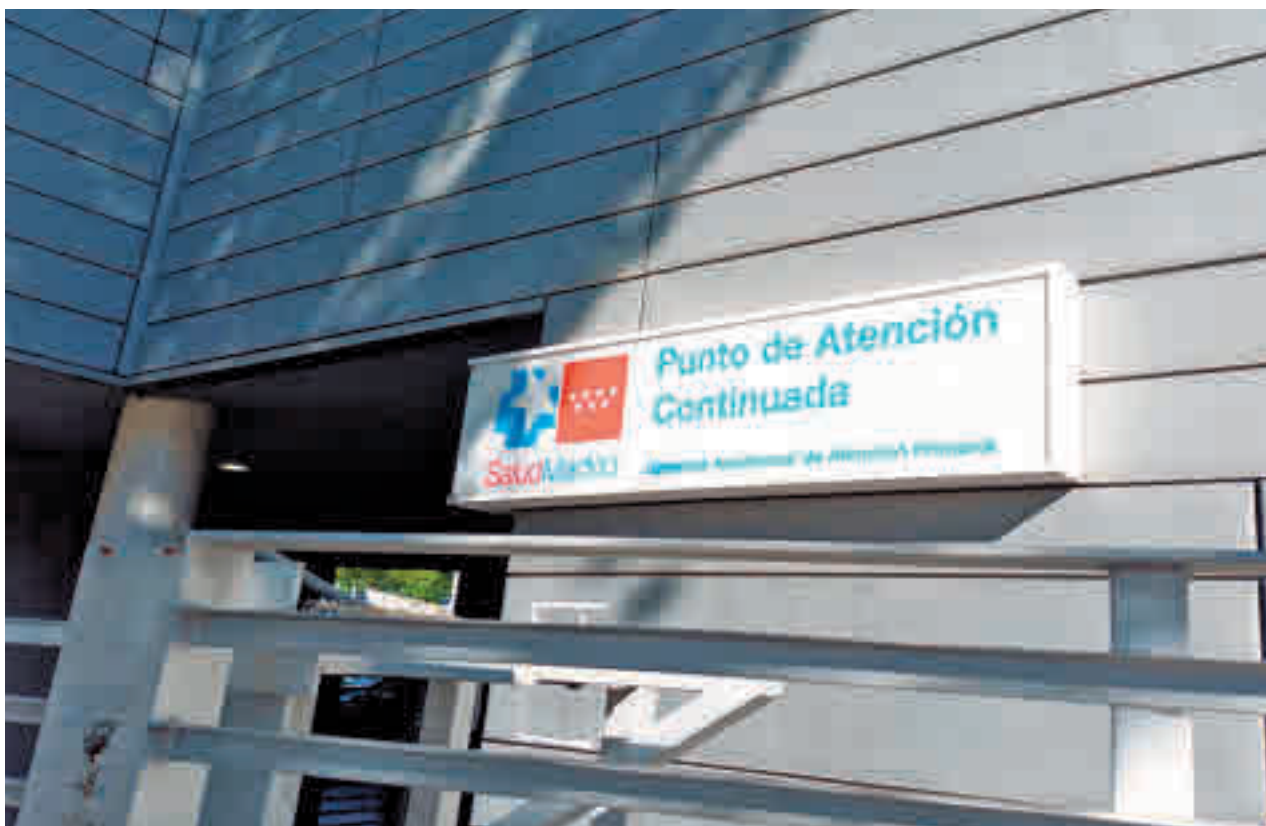
Punto de Atención Continuada en la Comunidad de Madrid