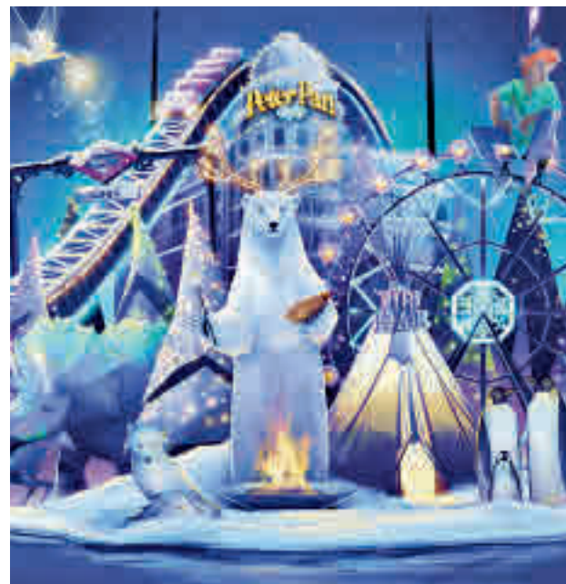
La parada de Metro de Lago, una de las vías de acceso

tinando diversas zonas que harán las delicias de todos los miembros de la familia, sin olvidar una importante oferta gastronómica.