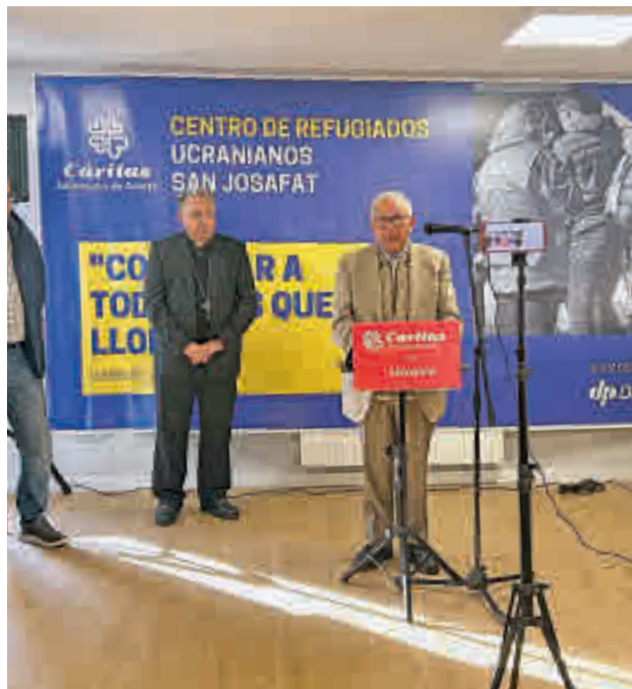
Acto de bendición del centro

Toda la actualidad de Leganés, en nuestra página web