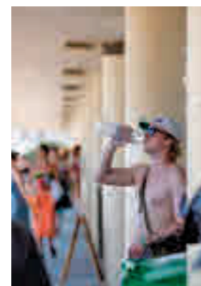
Hombre bebiendo agua

Se estima que al menos 15.000 personas han fallecido específicamente por el calor en Europa en 2022, según datos de la Organización Mundial de la Salud (OMS), casi 4.000 de ellas en España. La Región Europea acaba de