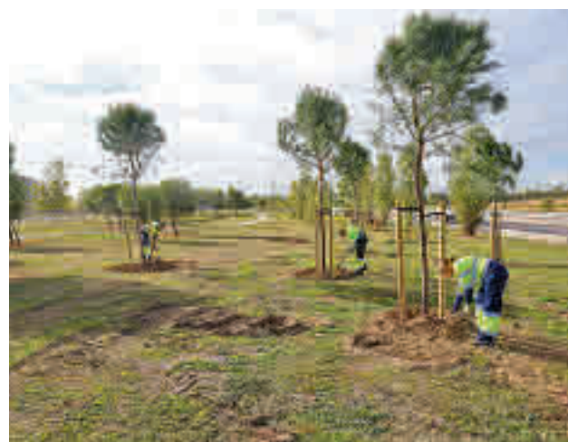
Zonas verdes de Leganés