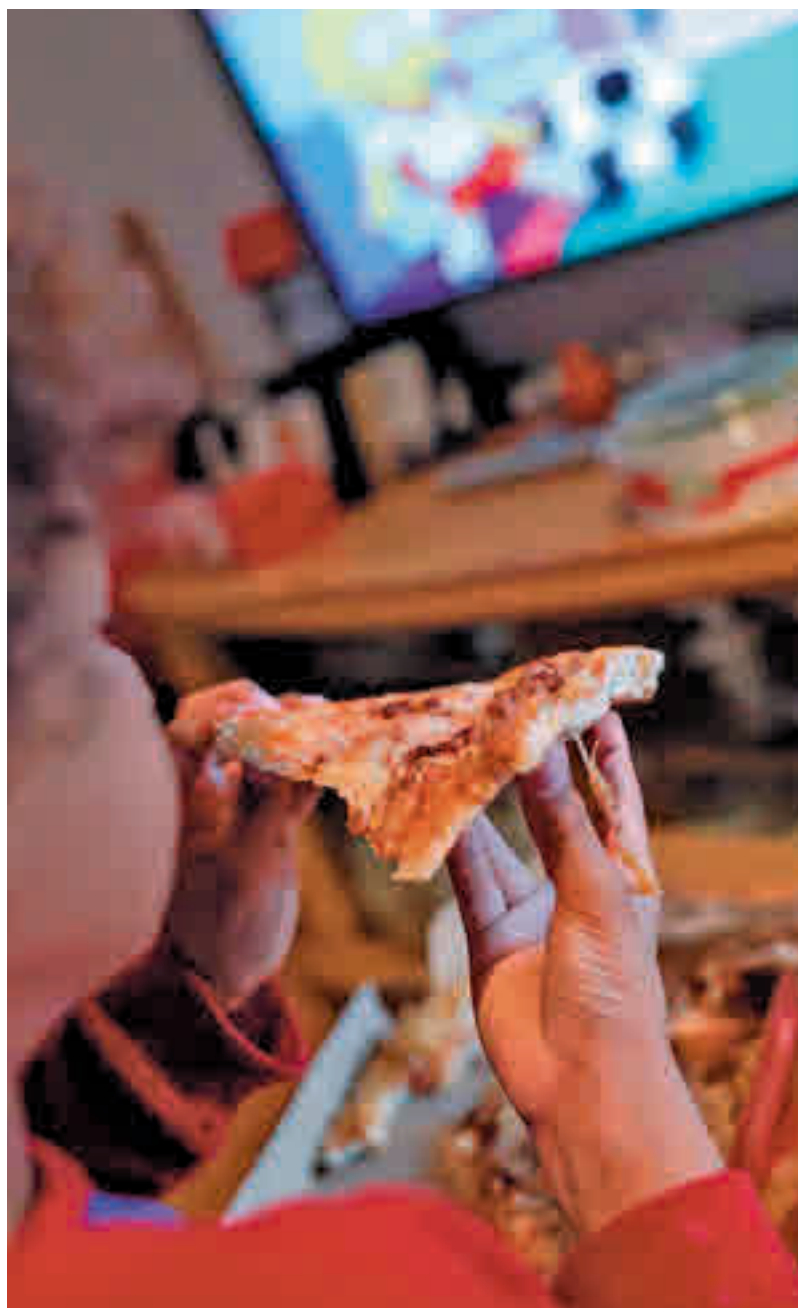
Un niño comiendo pizza

texto, Amanda Grech. “Cada vez está más claro que nuestro cuerpo come para satisfacer un objetivo proteico. Pero el problema es que los alimentos de las dietas occidentales tienen cada vez menos proteínas”, añade.