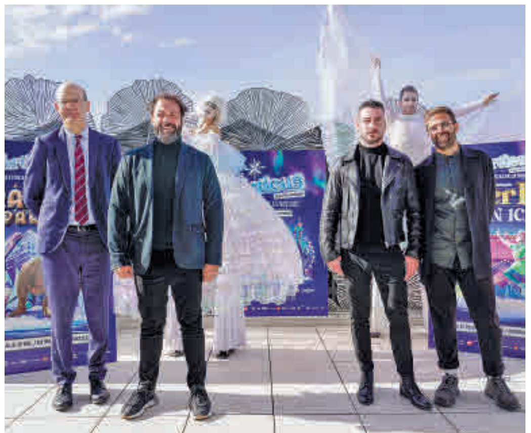
Representantes de Madrid Futuro y LetsGo en la presentación

Después de todos estos años de trabajo, 'Árticus' ya es prácticamente una realidad, aglu-