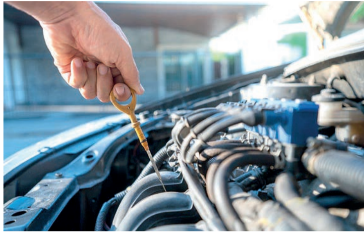
La comprobación del aceite de un vehículo.

A pesar de la crisis provocada por el aumento de los precios de la energía, y de su impacto en los costes de gestión del aceite industrial usado, el pasado año se recogió el 100% de este residuo peligroso en La Rioja. Durante 2021, a través de la red de gestores que trabajan en el marco del Sistema Integrado de Gestión de Aceites Usados (SIGAUS), se atendieron a 570 establecimientos generadores de aceites usados (siendo el 51% talleres mecánicos) distribuidos por 63 municipios riojanos, en los que se recuperaron 1.474 toneladas. Tras su recogida y tratamiento, las 944 toneladas de aceite usado resultantes se devolvieron al mercado como nuevos lubricantes o combustible, haciendo posible evitar la emisión de más de 600 toneladas de CO 2 y ahorrar 10 GWh de