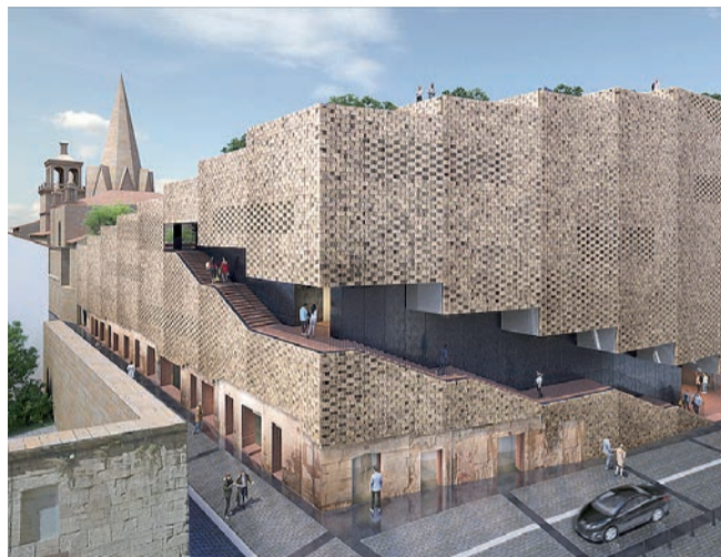
El futuro edificio de Bosonit en el Casco Antiguo.

proyectos empresariales para la ciudad y la revitalización del centro histórico", contestó el alcalde, Hermoso de Mendoza. También explicó que "no se debatía el proyecto concreto, que deberá presentarse oficialmente y tendrá que proceder a su correspondiente tramitación". Por-