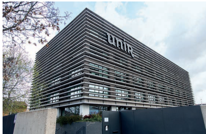
El edificio de la UNIR en Logroño.

Respecto al total de los centros de España clasificados en el ranking THE, en Educación, UNIR es la decimoquinta, situándose en la posición 28 sobre el total de las más de 90 universidades nacio-