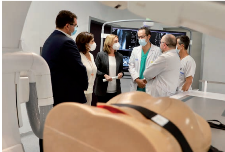
Andreu y Somalo, en su visita al San Pedro.

El Ejecutivo aportó 592.900 euros para la adquisición de este nuevo equipamiento, financiado con fondos europeos del Mecanismo de Recuperación y Resiliencia-Next Generation EU a través del Plan INVEAT del Gobierno de España para la renovación de equipos sa-