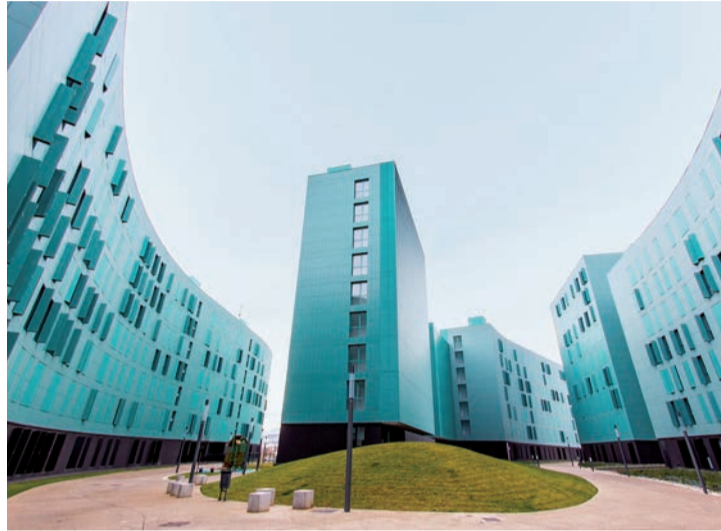
La urbanización de Toyo Ito en Logroño.

La detenida, de mediana edad y afectada por problemas de salud mental, se encontraba recogiendo hierbas con un cuchillo y se cortó en una de las manos. Sus gritos llamaron la atención del guardia civil, que transitaba en ese momento por la zona y se identificó pertinentemente como autoridad, preguntándole qué estaba ocurriendo. Entonces, la mujer guardó el cuchillo y se marchó mientras profería insultos al agente. Pero, escasos metros más ade-