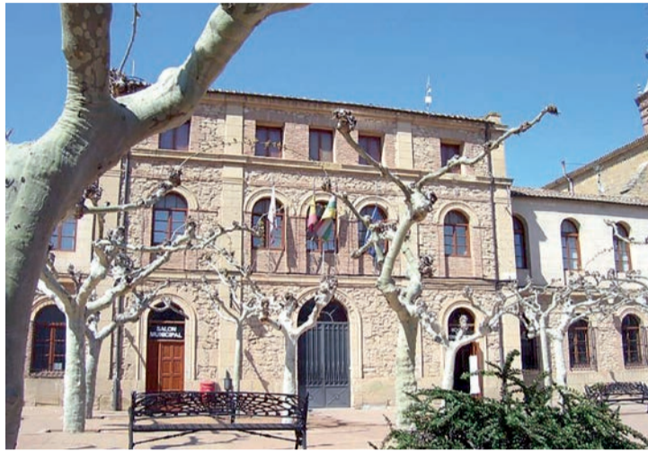
Una imagen del centro de Fuenmayor.

Los investigadores de la Sección Localización de Fugitivos hicieron gestiones indagatorias, averiguan-