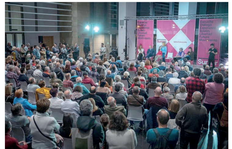
Yolanda Díaz, en su exposición en Riojaforum.