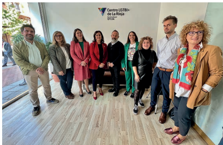
El Centro LGTBI+, gestionado por GYLDA.

Las inscripciones superaron los dos centenares, aunque el aforo reservado permitirá a algo más de 150 personas procedentes de todo el país asistir a la iniciativa, que se complementa con otras actividades en las que participa GYLDA LGTBI+, entidad social riojana referente en el apoyo y la defensa de la diversidad sexual, familiar y de género.