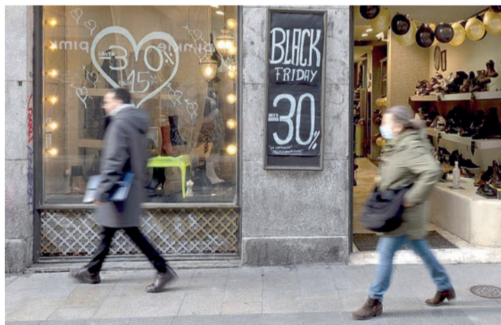
Un escaparate anuncia los descuentos del 'Black friday'.

De acuerdo con las estimaciones de esta compañía, el 64% de las contrataciones para estos días prenavideños (21.359 contratos) se producirán en logística, mientras que el 36% (12.020) tendrán lugar en el comercio. En el primer caso, los empleos que se generarán serán un 17,7% inferiores a los de 2021, y en el segundo el descenso interanual será del 16,6%.