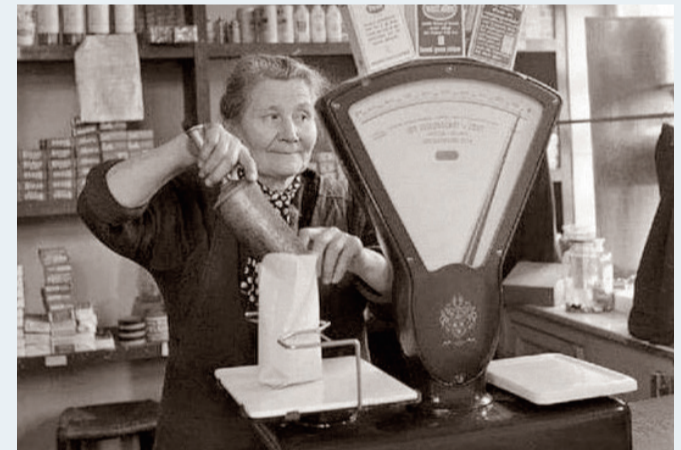
La tienda de la esquina.

sin dinero, y luego iba mi madre y se lo pagaba, y otra que se acogió a la Cadena de Supermercados SPAR. Era lo más novedoso de los años sesenta. Además de colocar unas estanterías nuevas, por cada cantidad de dinero que comprabas te daban un punto, que era como un sello con el anagrama de SPAR y que tú ibas pegando en una cartilla que te daban para tal fin, y cuando la rellenabas tenías opción a un regalo. Recuerdo que el primer regalo que cogimos fueron unos vasos de Durablex, creo que media docena, que venían en una caja de cartón, bastante burdo, no como los embalajes actuales de cualquier producto. Decían que eran irrompibles y la verdad es que yo los he visto por casa de mis padres durante toda mi vida.