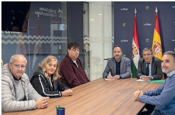
El consejero de Servicios Sociales, Pablo Rubio, con el Tercer Sector.

zará el diálogo, la cooperación y intervención efectiva del Tercer Sector de Acción Social en el diseño y ejecución de las políticas públicas para promover, proteger y avanzar en los derechos sociales de la ciudadanía, alcanzar la cohesión y la inclusión en todas sus dimensiones y evitar la exclusión de los colectivos más vulnerables”, explicó Rubio.