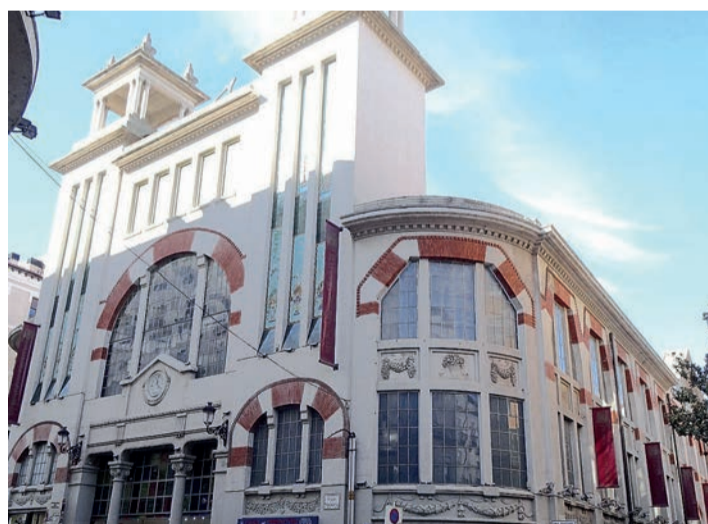
El Mercado de San Blas de Logroño.

"Infojoven tendrá una sede propia en pleno centro de Logroño, en el edificio del Mercado de San Blas, porque queremos también poner en el centro de nuestras políticas a la juventud. Pretendemos dar más visibilidad a este servicio y acercarlo a la juventud logroñesa", explicó