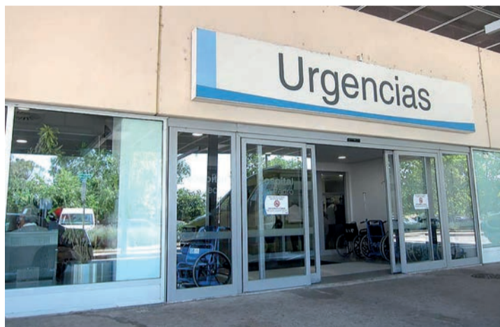
La entrada de Urgencias del San Pedro.