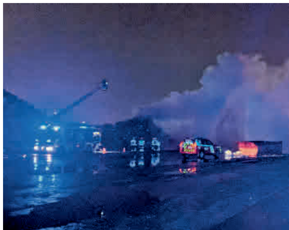
Las labores de extinción del cuerpo de Bomberos del Ayuntamiento