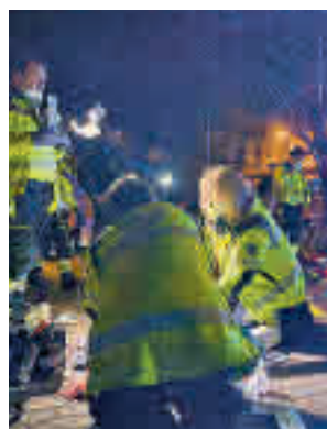
La atención sanitaria

calle de José Bielsa (Usera) de Usera. A su llegada, Samur-Protección Civil atendió y estabilizó a las cuatro víctimas de la agresión con heridas de diversa gravedad. Entre ellas, una mujer de 42 años que presentaba un traumatismo craneoencefálico leve. Además, un varón de 53 años