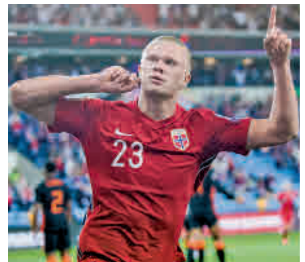
La Noruega de Haaland no se pudo clasificar

Diogo Jota, Reece James o Giovanni Lo Celso son otras ausencias ilustres, a las que podría sumarse Sadio Mané.