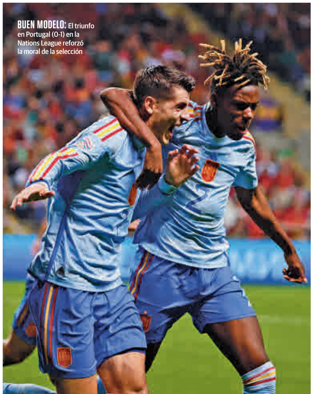
BUEN MODELO: El triunfo en Portugal (0-1) en la Nations League reforzó la moral de la selección

El moderno estadio Al Bayt acogerá un España-Alemania que recuerda a la semifinal de 2010 y a la final de la Eurocopa 2008. El Bayern Munich aporta la columna vertebral de una selección con problemas en la parcela defensiva, pero con argu-