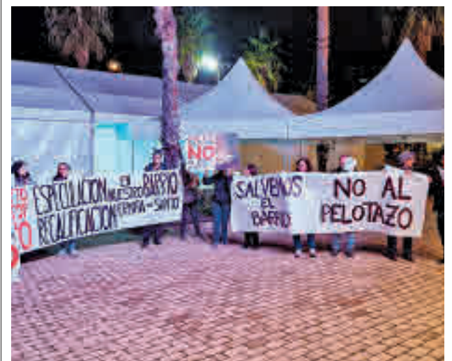
Varios residentes, a las puertas del Teatro Goya

gentedigital.es Toda la actualidad de los distritos de Madrid, en nuestra web