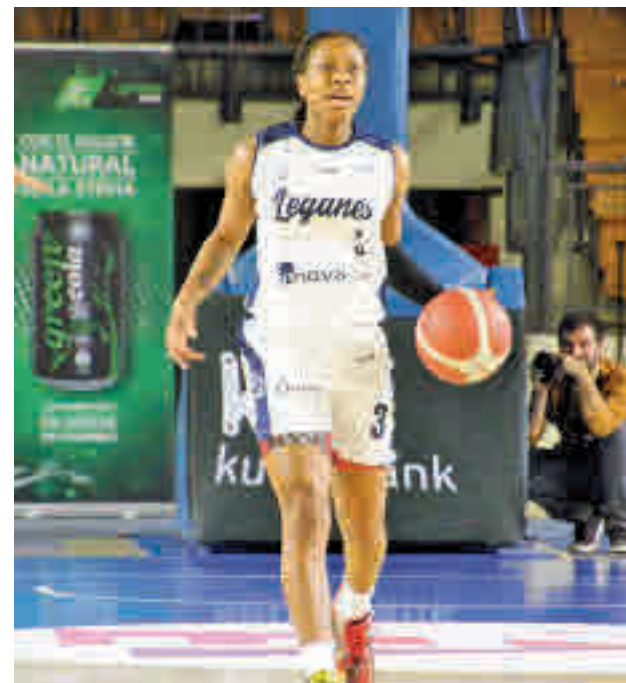
Meritorio triunfo del Leganés en Vitoria FEB

Por su parte, el Movistar Estudiantes afronta una complicada salida a la cancha del Spar Girona (viernes 18, 20 horas). El rival de las madrileñas es tercero pero cuenta con un partido menos que el dúo de líderes. A la entidad del adversario se suma el escaso descanso tras el partido de este miércoles en Eurocup.