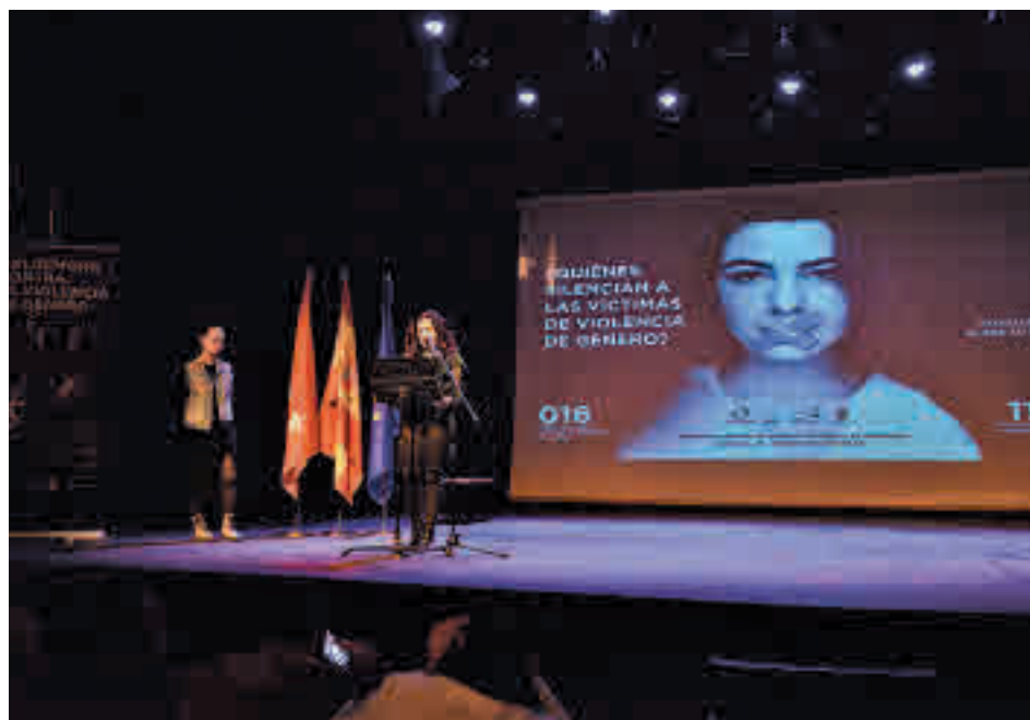
Acto del 25-N en Valdemoro del año pasado

Una de las más novedosas es el curso de defensa personal dirigido a la población femenina mayor de 16 años, cuyo objetivo es mostrar la forma de afrontar un ataque y librarse de él del mejor modo posible. Tiene una duración de 10 horas repartidas en cuatro sesiones y las asistentes aprenderán a prever y repeler una agresión, así como a poner en práctica recursos y técnicas de autoprotección. Se impartirá los domingos 20 y 27 de noviembre y 4 y 11 de diciembre en el Pa-