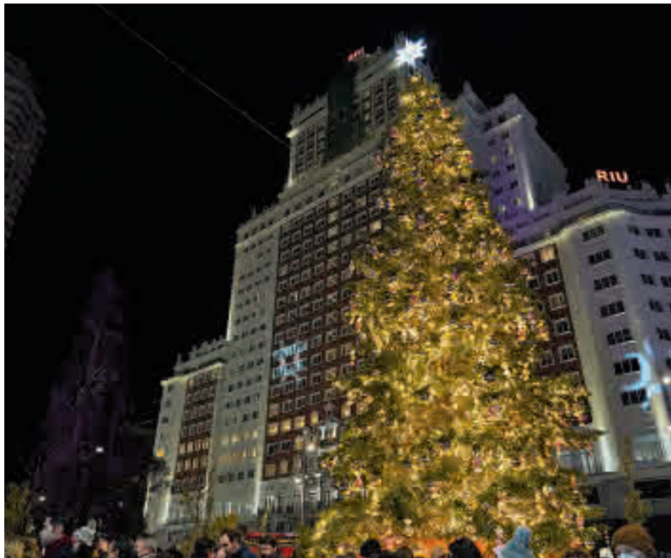
El gran abeto natural instalado en la Plaza de España en las pasadas navidades

Además, los días 25, 26 y 27 de noviembre, será gratis viajar en los autobuses de la EMT para fomentar la movilidad de un fin de semana donde se prevé mucha afluencia