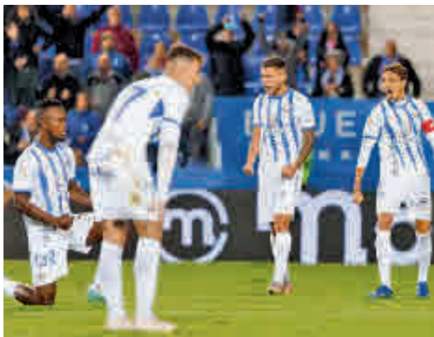
Último partido liguero del Leganés LALIGA

Los grupos políticos convocaron una primera manifestación en favor de la sanidad pública el pasado mes de septiembre. Alrededor de 2.000 personas, según la Policía Local, acudieron.