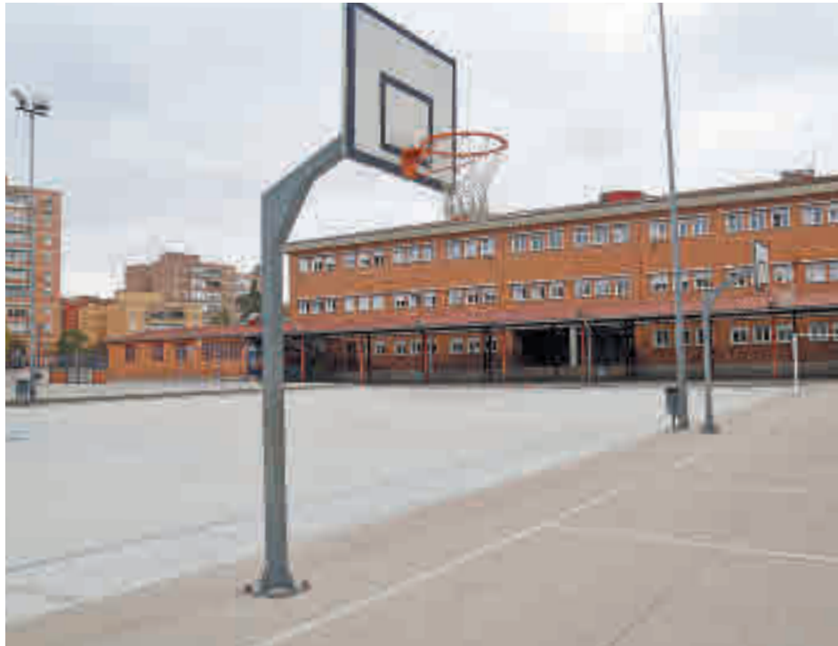
Patio de uno de los colegios participantes

Los centros que participan por el momento en este proyecto son los colegios de Educación Infantil y Primaria Aben Hazam, Ángel González, Antonio Machado, Concepción Arenal, Gonzalo de