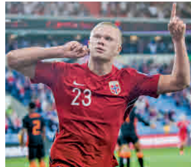
La Noruega de Haaland no se pudo clasificar

Diogo Jota, Reece James o Giovanni Lo Celso son otras ausencias ilustres, a las que podría sumarse Sadio Mané.