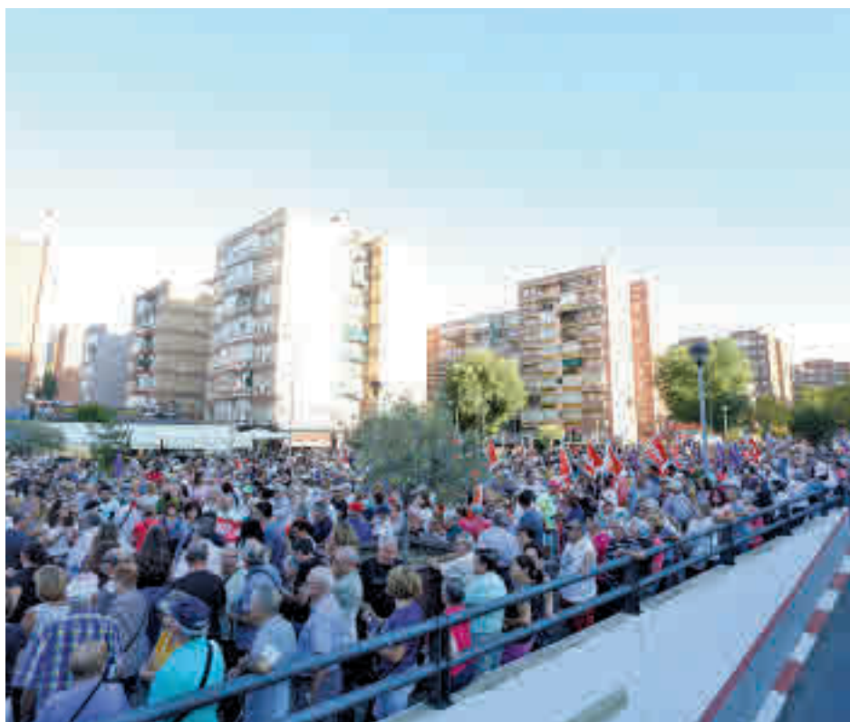
Anterior protesta en favor de la sanidad pública