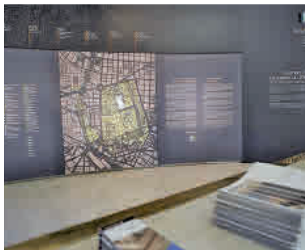
Uno de los espacios del centro de interpretación

La pieza central del espacio es una maqueta circular que reproduce toda la zona declarada patrimonio mundial y sobre la que se proyecta un 'videomapping' que narra el devenir de este ámbito a lo largo de los siglos. Imágenes, gráficos, textos, vídeos o