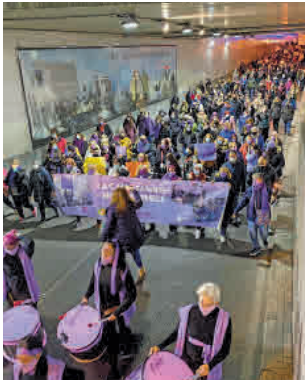
Marcha nocturna del pasado año

El evento central del programa tendrá lugar el viernes 25 con el acto conmemorativo organizado por la Comisión