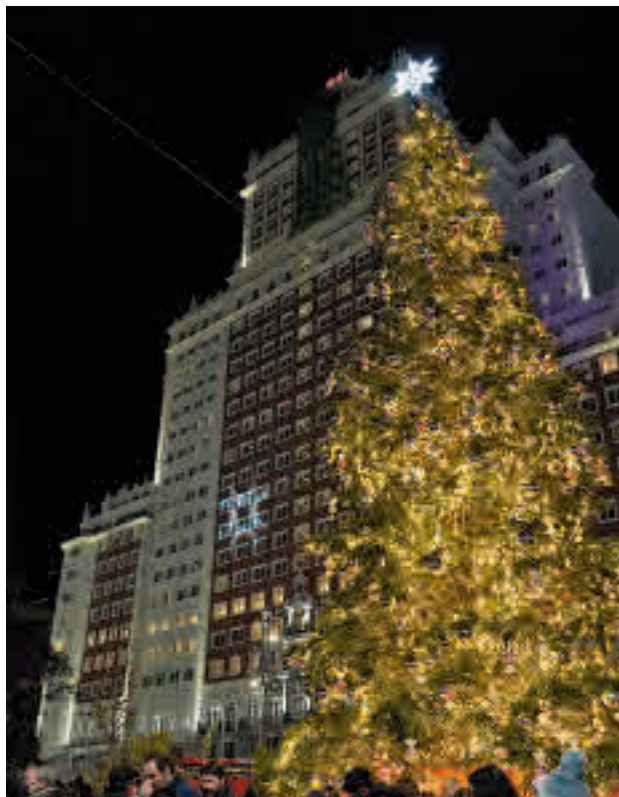
El gran abeto natural instalado en la Plaza de España

La Navidad llegará a Madrid en forma de 6.700 ca-