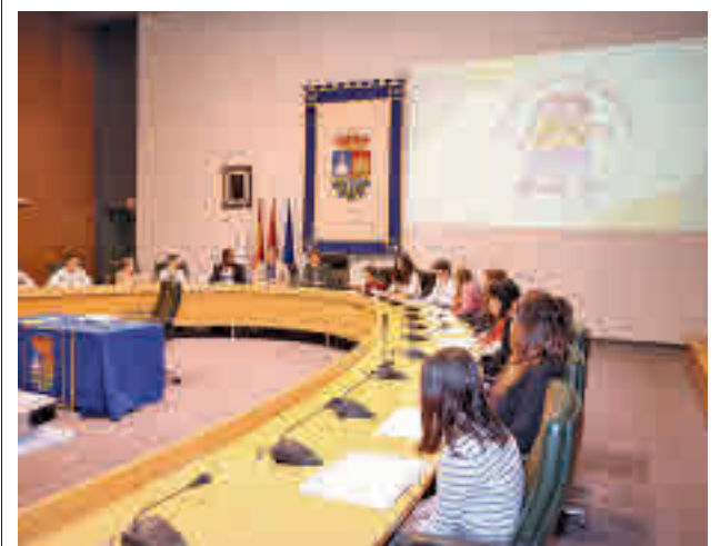
Reunión del alcalde con niños

Las personas que deseen participar podrán puntuar, mediante votación digital, el plato degustado en cada establecimiento. La creación más votada se llevará un premio, mientras que los clientes participantes entrarán en el sorteo de cinco comidas o cenas por valor de 50 euros en alguno de los restaurantes.