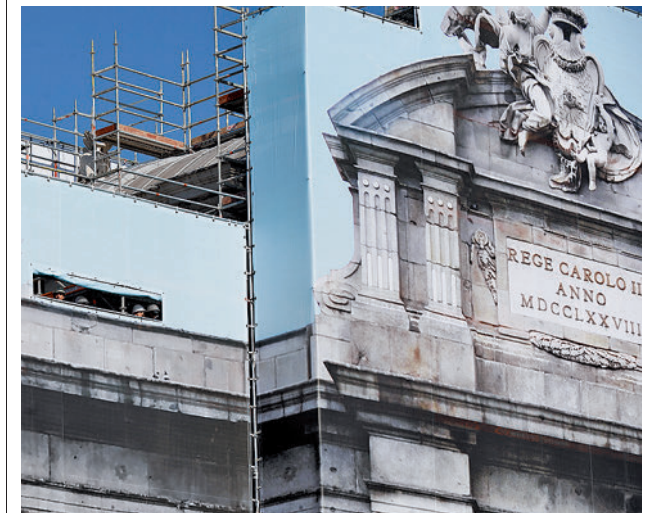
Los andamios instalados en la Puerta de Alcalá