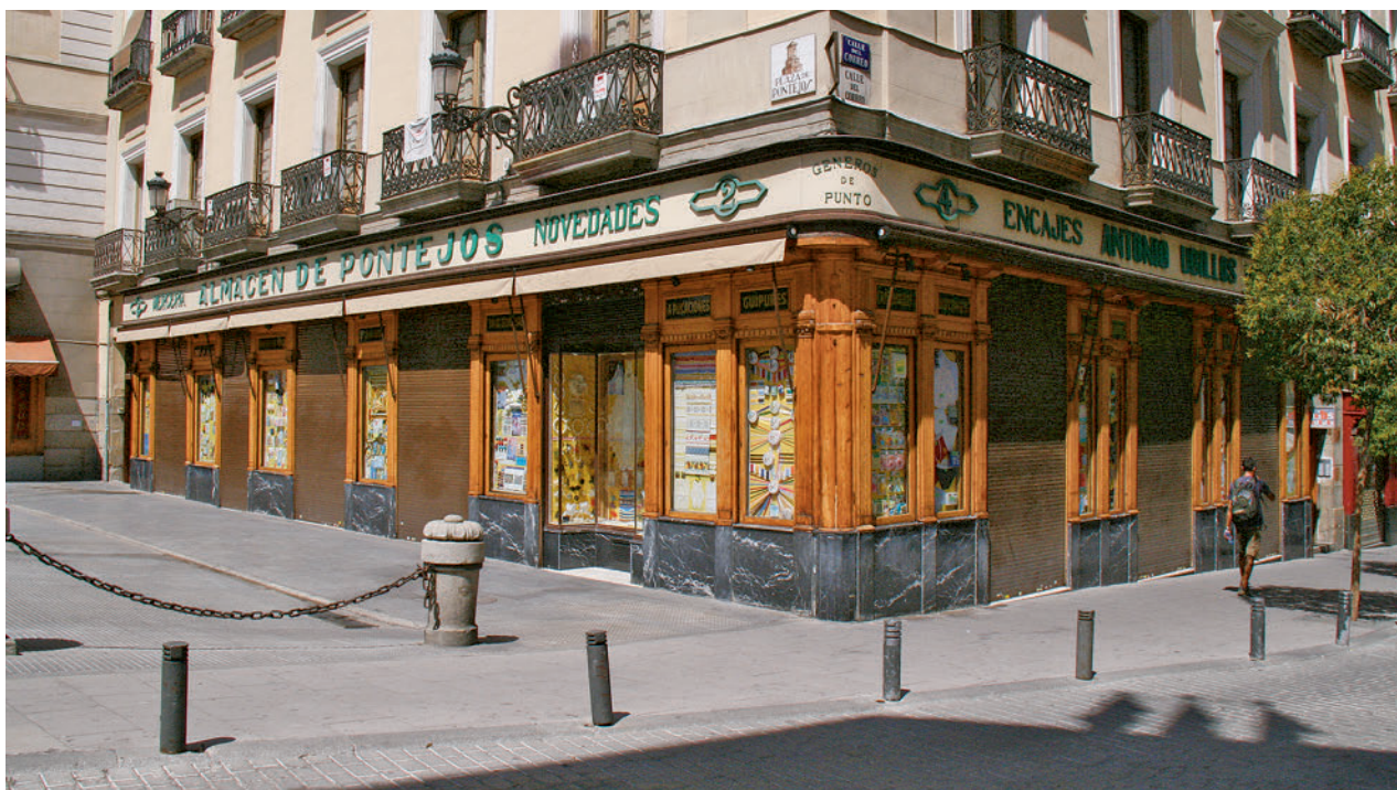
El emblemático espacio de la capital, situado junto a la Puerta del Sol