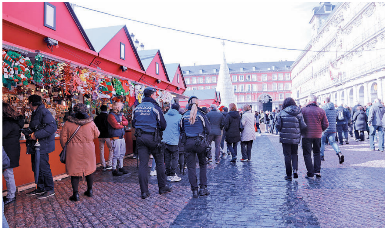
Agentes de la Policía Municipal patrullan a pie la Plaza Mayor

Al igual que en años anteriores, el Ayuntamiento restringirá el tráfico de vehículos pesados en la Gran Vía desde las 0 horas del 2 de diciembre hasta las 0 horas del 7 de enero, además de prohibir el estacionamiento de todo tipo de vehículos en horarios y espacios concretos en sus calles aledañas. Esta medida se adoptará teniendo en cuenta que España continúa en el nivel 4 de alerta antiterrorista.