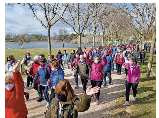
Marcha de mujeres en Leganés

“Somos conscientes de que el camino hacia la igualdad y hacia una sociedad libre de toda violencia todavía es largo”, añadió, recordando que en España desde 2003 han sido asesinadas 1.168 mujeres y 48 menores.