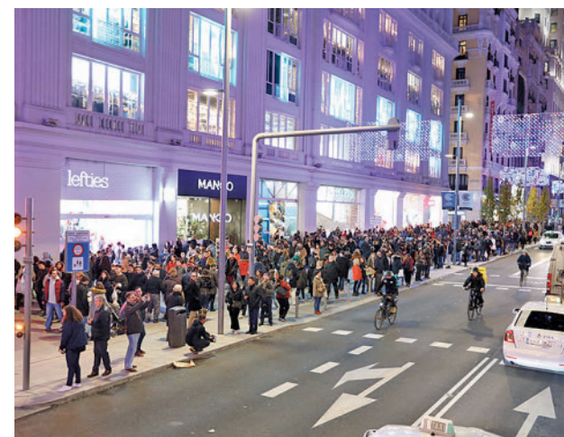
Las calles de Madrid se llenarán en diciembre

El mes de diciembre es uno de los más fuertes para el turismo regional, con especial influencia del Puente de la Constitución, donde se suele llegar al pico más alto.