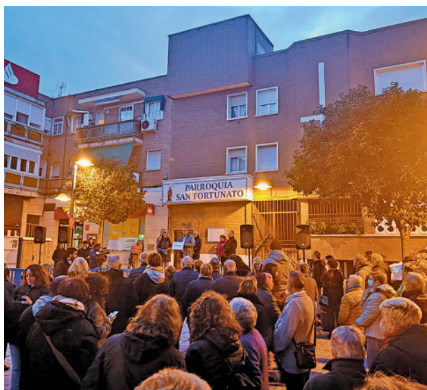
Concentración en La Fortuna

Desafiando al frío, las decenas de personas que secundaron la movilización (convocadas por todos los partidos del Ayuntamiento, excepto el PP y Podemos) leyeron un comunicado para reclamar la retirada del vi-