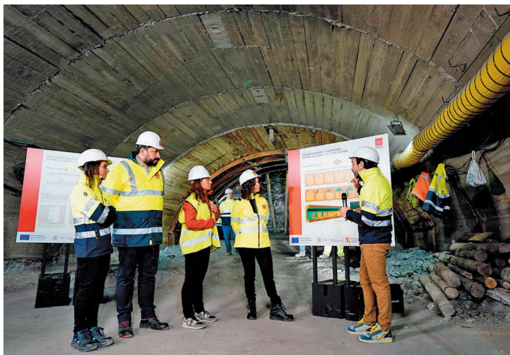
Díaz Ayuso, durante su visita a las obras

entrada a la estación del túnel de línea y la losa de cubierta. “Se va a realizar un movimiento de tierras de más de medio millón de metros cúbicos, lo que equivale a rellenar un estadio como el Santiago Bernabéu”, detalló la jefa del Ejecutivo madrileño.