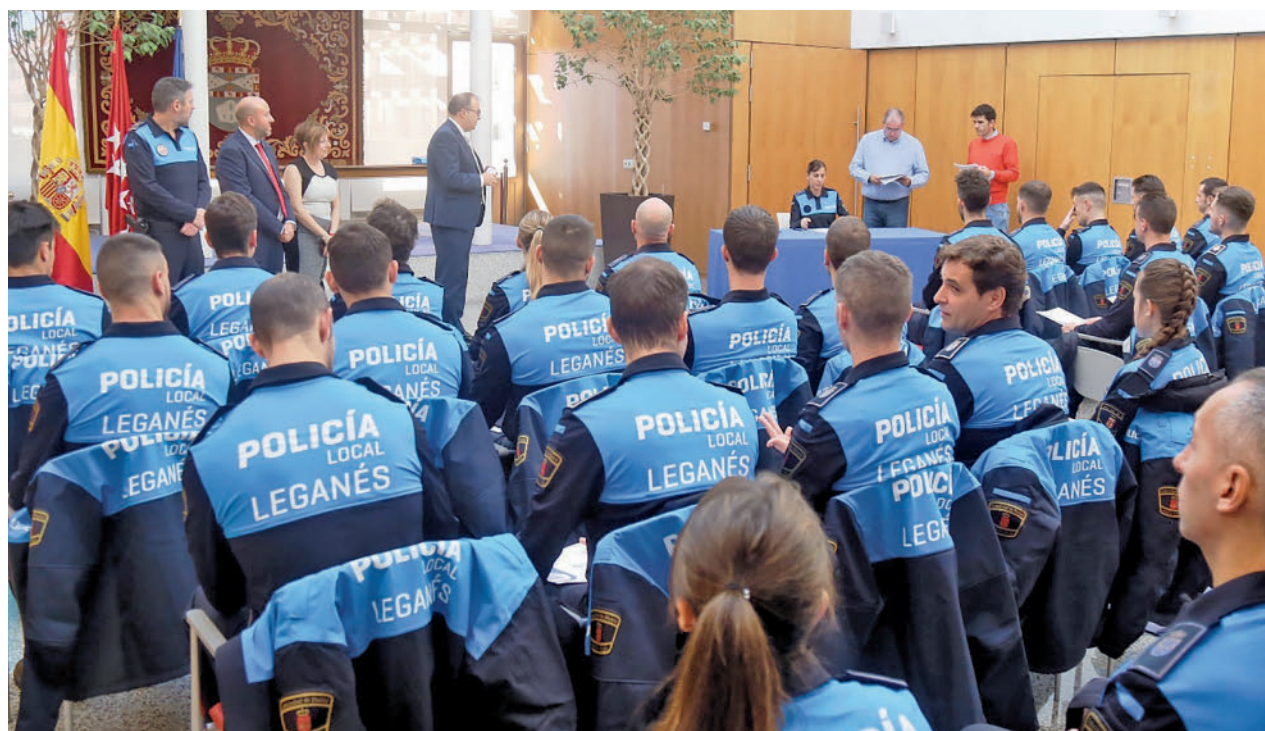
Los nuevos agentes recibieron sus distintivos

tes públicos que estaban allí reunidos. Los sindicatos negaron los hechos y también desmintieron que exigieran una subida salarial, acusando al alcalde de mentir y afirmando que realizan su trabajo en unas condiciones que no son las deseables, poniendo como ejemplo las goteras de la Comisaría.