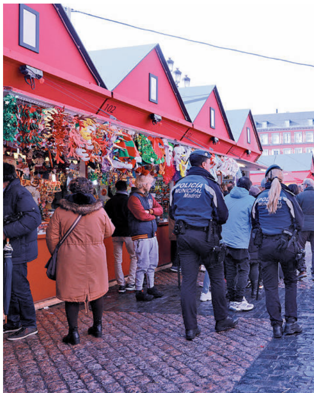
Agentes de la Policía Municipal patrullan a pie la Plaza Mayor

Desde Cibeles prevén que los días con más personas en las calles de la ciudad serán este viernes, día 25 de noviembre (Black Friday), y el día siguiente (sábado 26), el fin de semana del 2 de diciembre y todo el puente de la Constitución, los siguientes fines de semana (incluyendo el 23 de diciembre), las fechas festivas navideñas