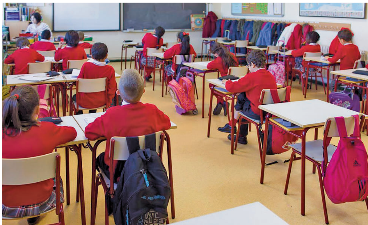
Los profesores sufren cada vez más agresiones

Sin embargo, la demanda no efectiva (los que quieren alquilar y no lo han conseguido) se mantiene estable.