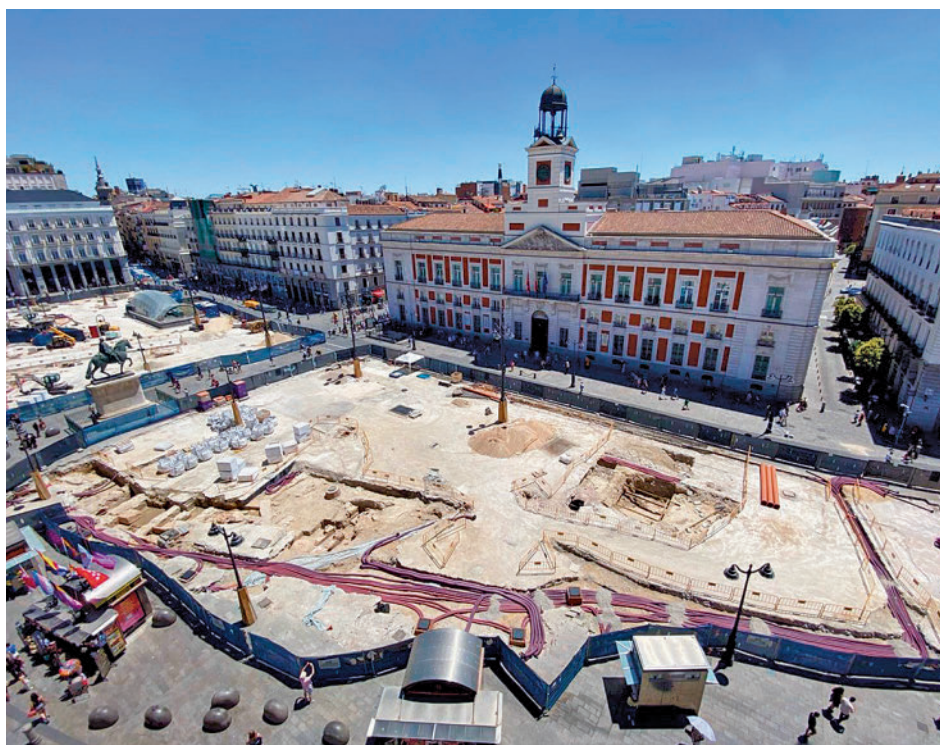
Obras en la Puerta del Sol

Almeida puso en valor la "reordenación de elementos monumentales, el reparto del espacio, la ordenación de quioscos que se agruparán en dos zonas" que se ha conseguido con las obras, después de las que "quedará un espacio mu-