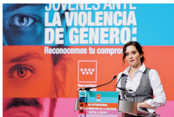
Isabel Díaz Ayuso, el pasado 25-N

El objetivo es mostrar "su solidaridad con la lucha que han emprendido en las últimas semanas con manifestaciones y reivindicaciones por todo Irán", según desveló el Gobierno regional. Durante el encuentro, que tendrá lugar en la Real