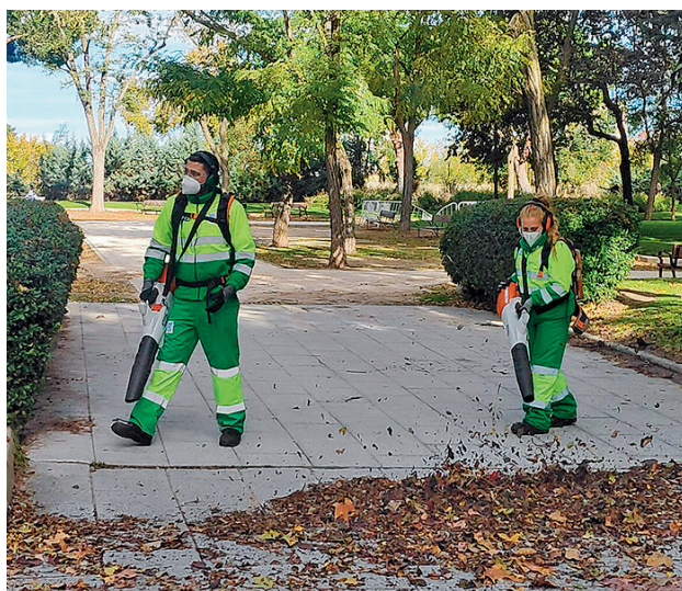
Dos trabajadores utilizan sopladoras

El operativo contará con 137 barredoras, que podrán incrementarse en caso necesario hasta las 152, y estarán activas en tres turnos de trabajo. Además, dispondrá de 80