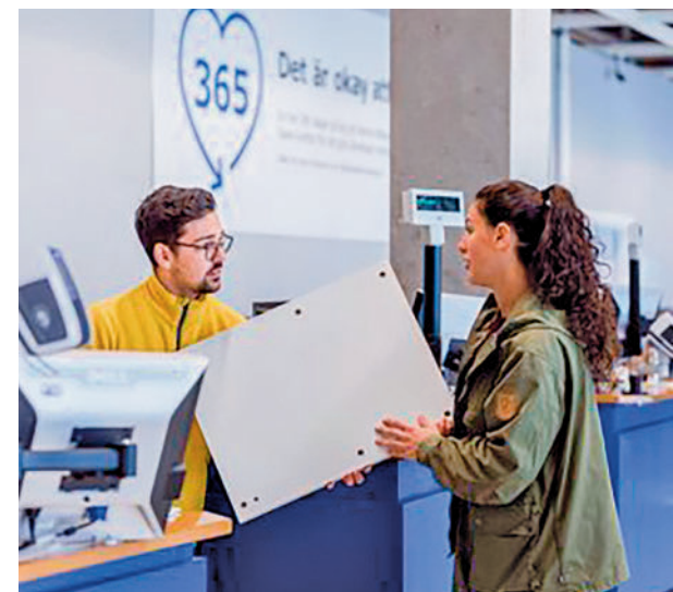
Empleados en la campaña de Navidad

A pesar de estas previsiones de caída, en el caso de la hostelería se pronostica un incremento del 12,4%, hasta los 96.987 contratos. Randstad precisa que el sector logístico será uno de los principales dinamizadores, con cerca de 200.000 contratos.