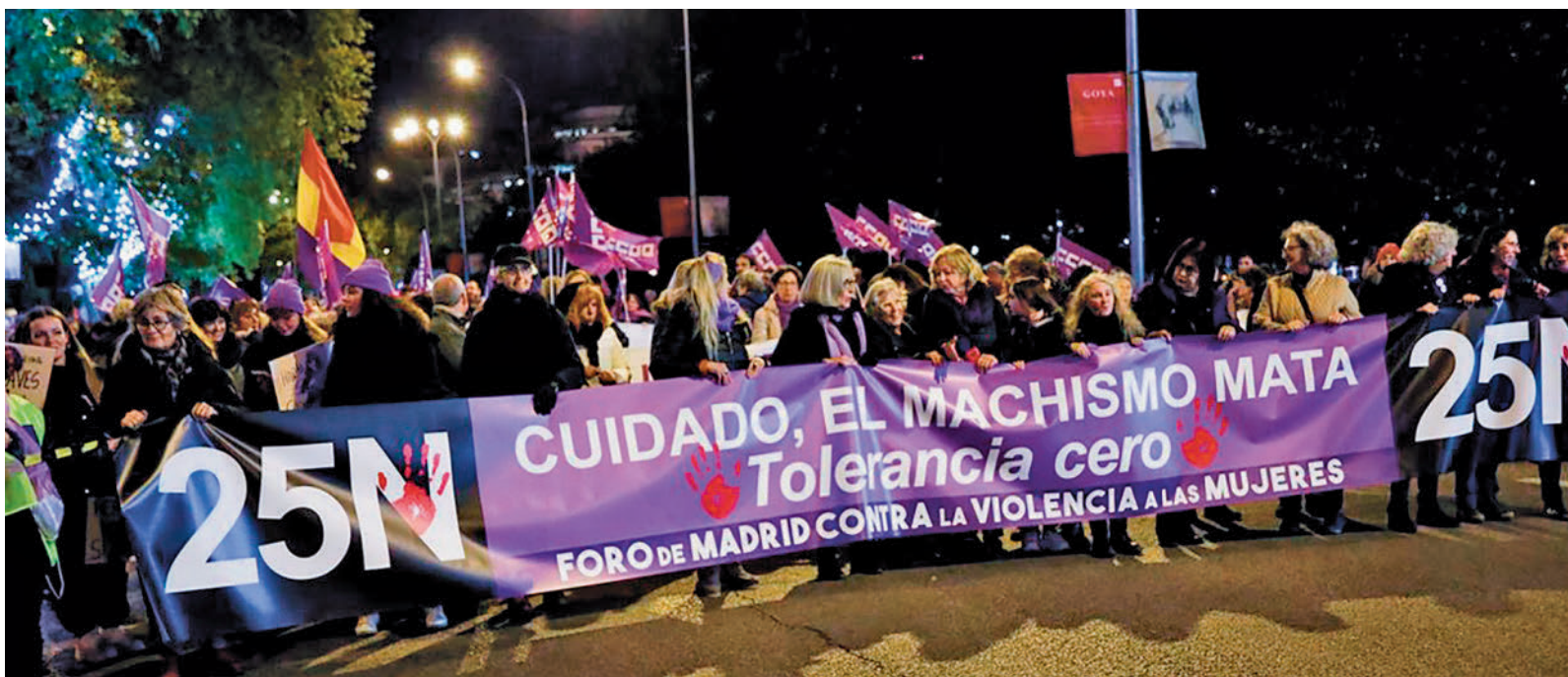
Manifestación contra la violencia machista en las calles de Madrid