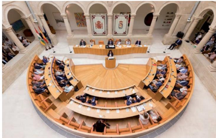
Una imagen panorámica de la Cámara riojana.

En cuanto a las enmiendas parciales presentadas a las cuentas de 2023, hay 507 del PP (por valor de 178 millones de euros), 102 de Ciudadanos (por 66,5 millones), 67 del PSOE (24 al articulado y 43 al estado de gastos, por 28,7 millones), 62 del grupo Mix-