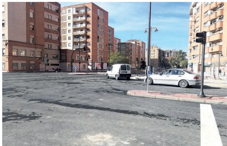
El Nudo de Vara de Rey, ya en funcionamiento.

La Junta de Gobierno Local del Ayuntamiento de Logroño autorizó a la dirección de las obras del Nudo Vara de Rey "la iniciación de un expediente de modificación de estos trabajos, que tendrá un importe algo superior a los 475.000 euros", como informó el portavoz municipal, Kilian Cruz-Dunne. Se trata de las labores relacionadas con el desmontaje del puente sobre lo que era la vía ferroviaria y su zona adyacente, para cumplir los condicionantes impuestos por terceros ajenos al Consistorio, como son ADIF e I-DE Redes Eléctricas Inteligentes. "Estos cambios no suponen la suspensión temporal de las