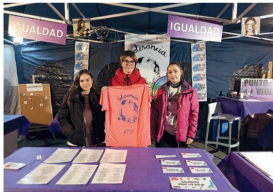
Punto violeta en la Universidad de La Rioja.