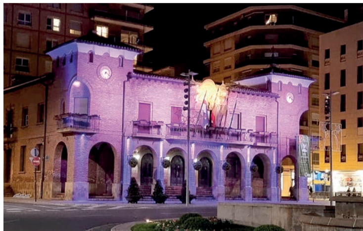
La fachada del Ayuntamiento de Calahorra, iluminada de morado.