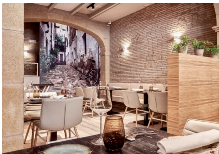
El restaurante ‘Ajo Negro’, en Hermanos Moroy.

Además, ‘Venta de Moncalvillo’, que cuenta con una Estrella Michelin en Daroca, obtuvo una Estrella Verde, distinción que mate-