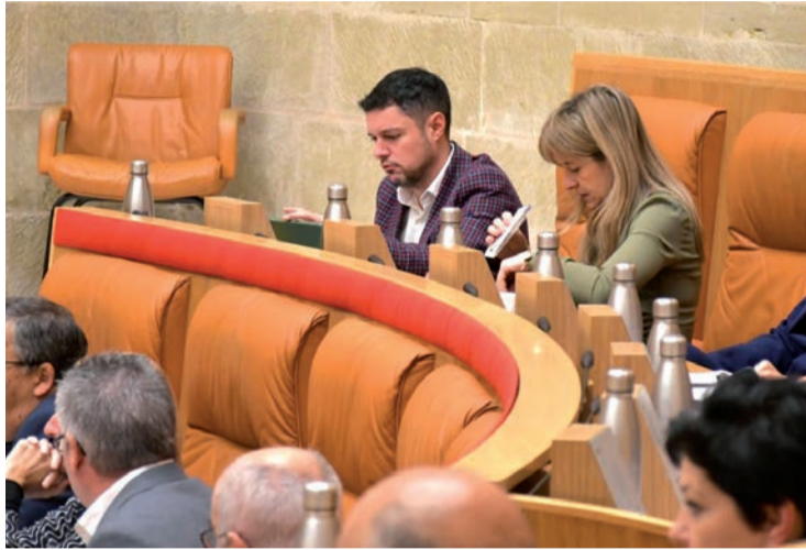
La bancada socialista en la Cámara riojana.