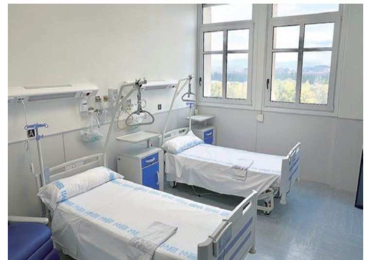
Una remozada habitación del Hospital General de La Rioja.

SANIDAD | Renovación del centro hospitalario