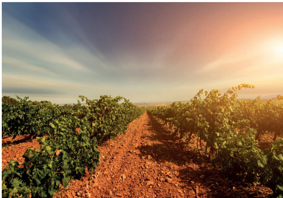
Viñedos centenarios en Bodegas Escudero, una de las pioneras en la elaboración de cavas en España.

Y, por supuesto, la altitud de nuestros viñedos centenarios que genera un óptimo contraste térmico que proporciona, a la uva, las condiciones perfectas de ma-