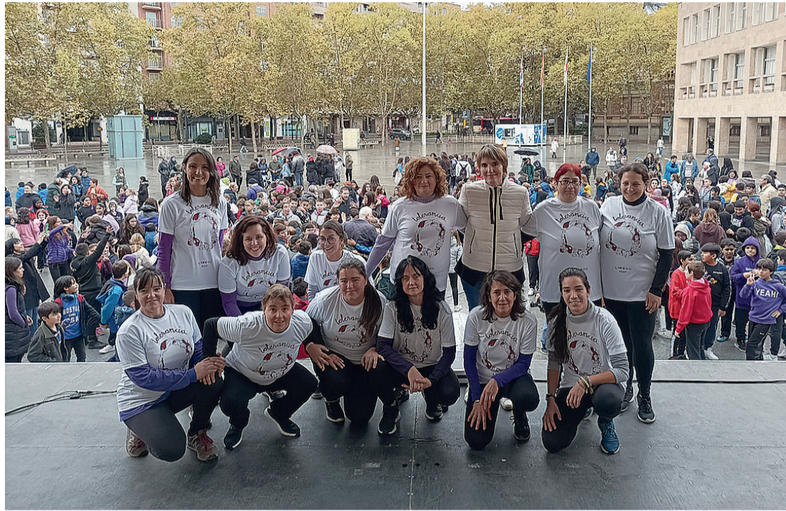
La acción colectiva en la Plaza del Ayuntamiento de Logroño con la coreografía de 'Yo sólo quiero bailar'.

El Ayuntamiento de Logroño también se ha sumado a la sensibilización sobre este grave proble-