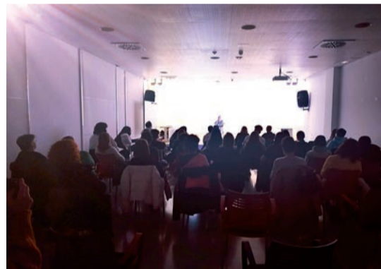
La obra de teatro 'Corazón de campeona', en Calahorra.