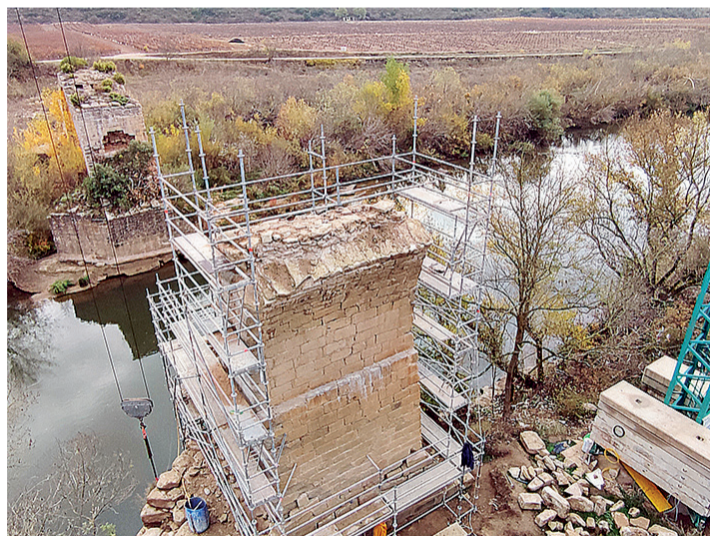
El estado de las labores de consolidación en el Puente Mantible.