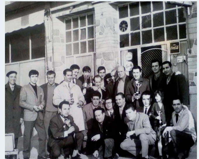
El bar 'Argentina'.

la tele ponían 'Galas del sábado', llenaba el local de sillas y allí bajábamos medio barrio a ver la tele. Las sillas eran para las mujeres y los niños, los hombres se quedaban de pie en la barra consumiendo café, copa y puro... y alguna que otra copa más con el puro. Pero cuando de verdad hacían el agosto era los domingos que había fútbol en Las Gaunas. Casi todo el mundo subía a pie, y República Argentina era la calle más recta a la entrada del campo de fútbol. Y era costumbre, antes de entrar a ver el partido, tomarse un café y una copa... el puro se solía traer puesto. A mí de pequeño me parecía un local bastante grande, luego lo vi de mayor y no me explico cómo entrábamos allí tanta gente.