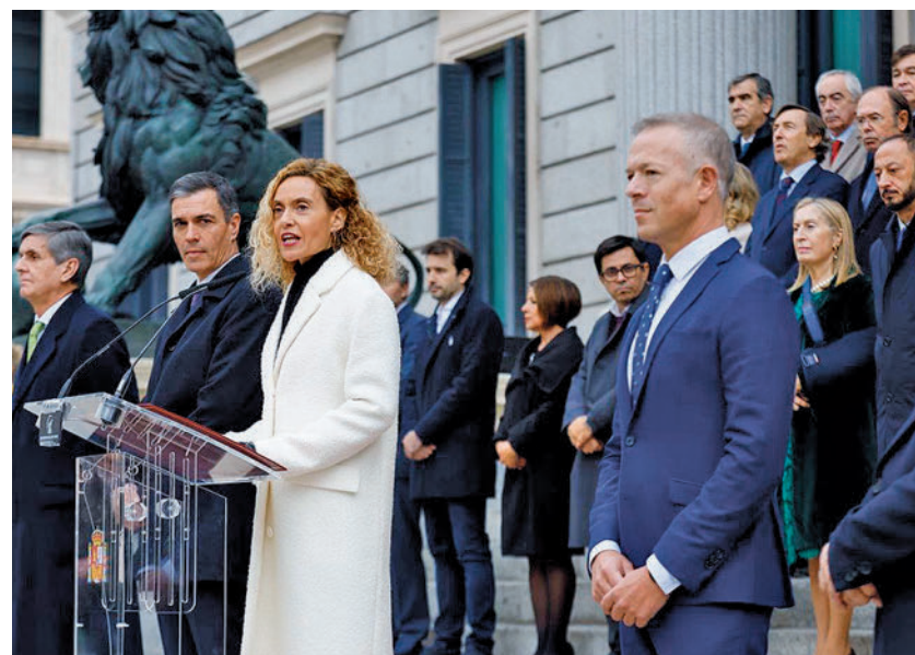
La presidenta del Congreso, Meritxell Batet, durante su discurso