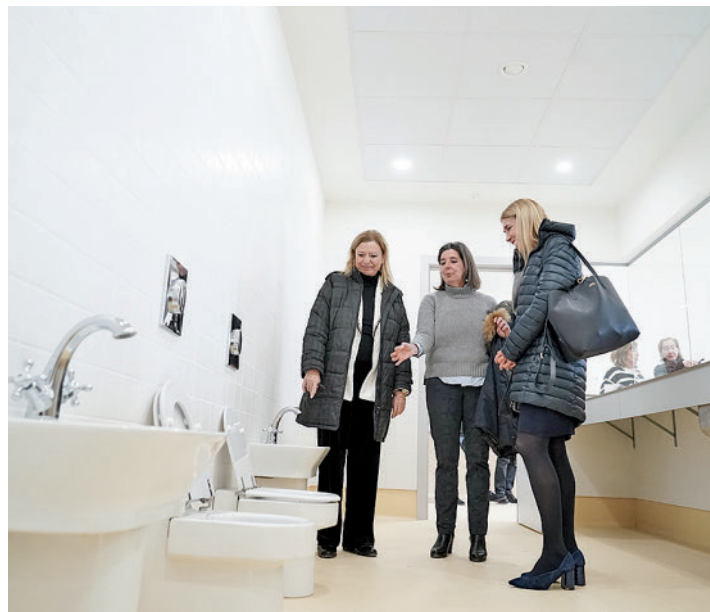
Las autoridades municipales visitaron la escuela el 7 de diciembre

Los primeros alumnos de 0 a 3 años de edad llegarán previsiblemente en la primavera de 2023 • El equipamiento ofertará 156 plazas y dispondrá de 12 aulas en una sola planta