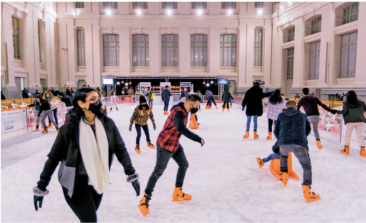
La pista instalada en la Galería de Cristal del palacio de Cibeles