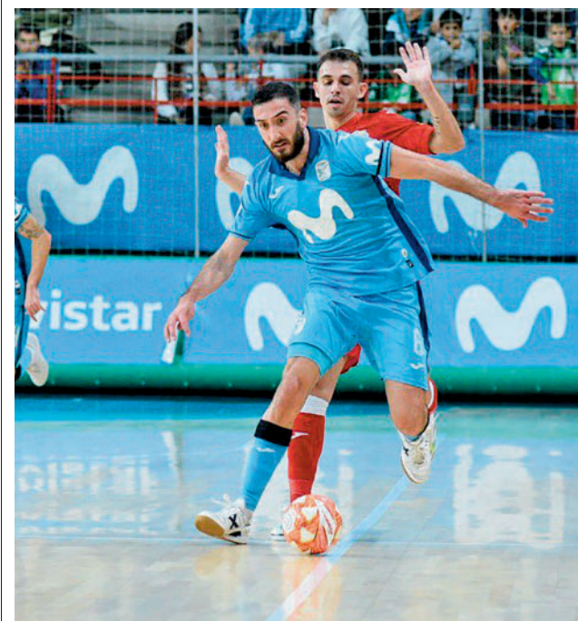
El 'Clásico' ante ElPozo cayó del lado del Inter

La exigente carrera de fondo de la fase regular tampoco da respiro al Real Madrid. Los blancos se imponían la semana pasada al Valencia Basket, aprovechando el tropiezo del Barça en la pista del Monbus Obradorio. Sin embargo, el Leno-vo Tenerife sigue marcando el paso, por lo que, a la espera de un tropiezo de los canarios, al conjunto que dirige Chus Mateo no le queda otra alternativa que seguir haciendo sus deberes. Estos pasan por imponerse este domingo (12:30 horas) en el WiZink Center al colista, el BAXI Manresa, antes de afrontar otra semana donde deberá redoblar esfuerzos en la Euro-liga, visitando el martes al Bayern Munich y el jueves al Zalgiris Kaunas.