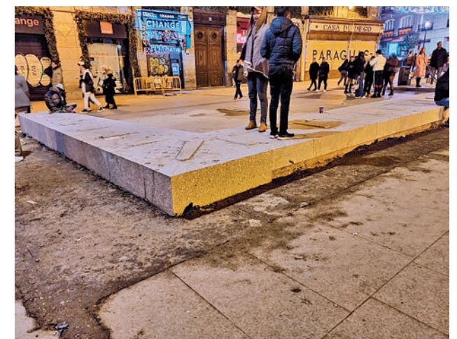
Estado de una de las zonas de la Puerta del Sol MAS MADRID

"Se ha hecho un esfuerzo para adelantar la apertura, no se ha improvisado y es un guiño a comerciantes, que desde marzo aguantan las obras de Sol", argumenta el primer edil.