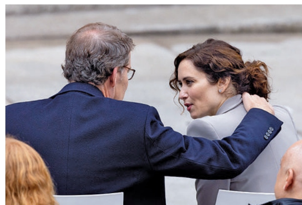
Alberto Núñez Feijóo e Isabel Díaz Ayuso

otro), las declaraciones que más repercusión tuvieron fueron las de la presidenta de la Comunidad de Madrid, Isabel Díaz Ayuso, que pidió que haya un cambio de Gobierno en 2023, ya que entiende que de no haberlo puede llegar el "último capítulo del libro que se empezó a construir en 1978" y que llegarán "situaciones como consultas o tensión entre regiones".