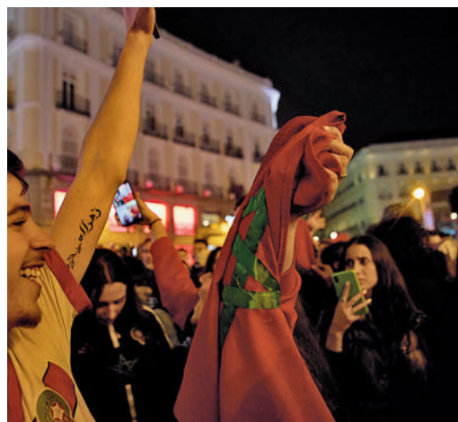
Celebración de aficionados marroquíes

EL PERIÓDICO GENTE NO SE RESPONSABILIZA NI SE IDENTIFICA CON LAS OPINIONES QUE SUS LECTORES Y COLABORADORES EXPONGAN EN SUS CARTAS Y ARTÍCULOS