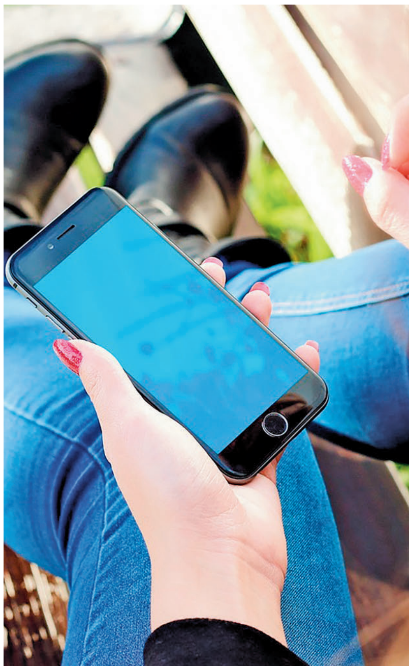
Mujer con un teléfono móvil en la mano

plantar identidades, acciones que por lo general se llevan a cabo mediante comentarios o mensajes privados". Según la encuesta, estos actos los realizan en mayor medida los hombres (16%) que las mujeres (9%). Entre ellos, el tema