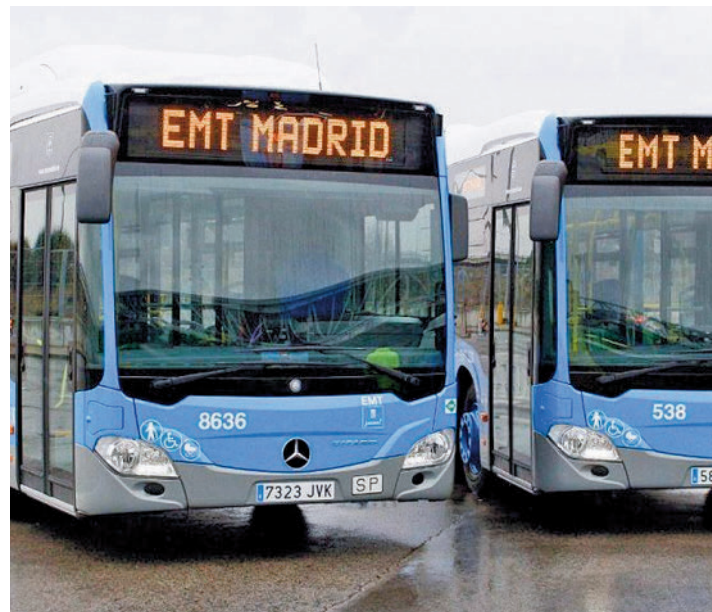
La frecuencia de paso será de 5 a 6 minutos en los días laborables

La ruta iniciará su recorrido en la avenida de América 31 y, desde allí, recorrerá la calle sin paradas intermedias