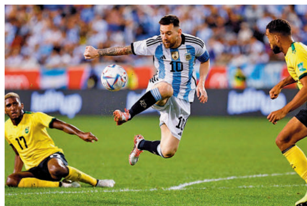
Messi lidera a Argentina

Croacia y Brasil rompen el hielo (16 horas) con un partido donde los vigentes subcampeones del mundo tratarán de