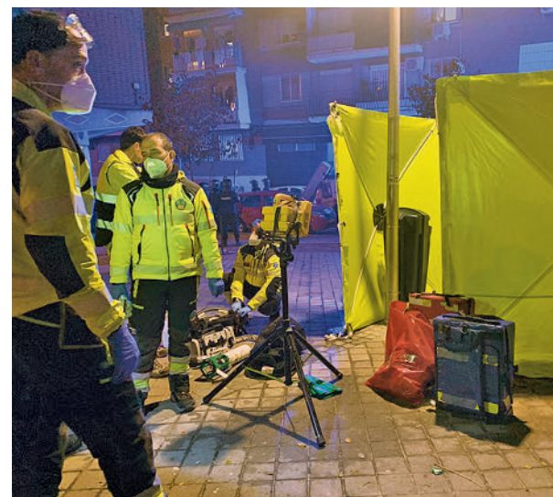
Los servicios de Emergencias atienden al joven fallecido

Según recoge la Federación Regional de Asociaciones de Vecinos de Madrid (FRAVM) en un comunicado, como sociedad “no se puede quedar impasibles ante esta espiral de violencia, un pro-