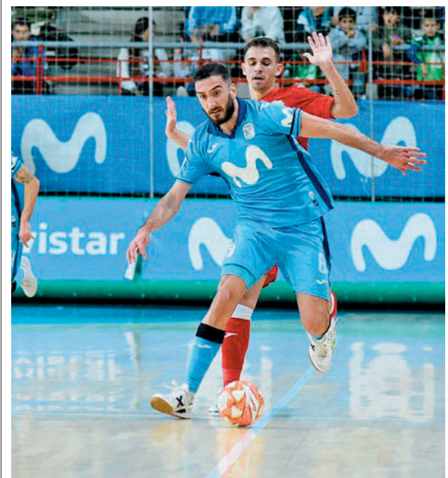
El 'Clásico' ante ElPozo cayó del lado del Inter

La exigente carrera de fondo de la fase regular tampoco da respiro al Real Madrid. Los blancos se imponían la semana pasada al Valencia Basket, aprovechando el tropiezo del Barça en la pista del Monbus Obradorio. Sin embargo, el Leno-vo Tenerife sigue marcando el paso, por lo que, a la espera de un tropiezo de los canarios, al conjunto que dirige Chus Mateo no le queda otra alternativa que seguir haciendo sus deberes. Estos pasan por imponerse este domingo (12:30 horas) en el WiZink Center al colista, el BAXI Manresa, antes de afrontar otra semana donde deberá redoblar esfuerzos en la Euro-liga, visitando el martes al Bayern Munich y el jueves al Zalgiris Kaunas.