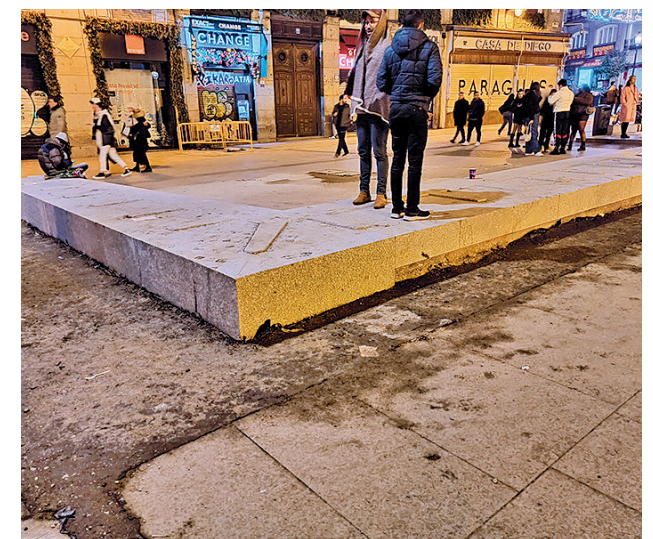
Estado de una de las zonas de la Puerta del Sol MAS MADRID