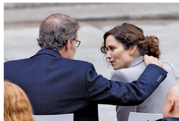
Alberto Núñez Feijóo e Isabel Díaz Ayuso

otro), las declaraciones que más repercusión tuvieron fueron las de la presidenta de la Comunidad de Madrid, Isabel Díaz Ayuso, que pidió que haya un cambio de Gobierno en 2023, ya que entiende que de no haberlo puede llegar el "último capítulo del libro que se empezó a construir en 1978" y que llegarán "situaciones como consultas o tensión entre regiones".