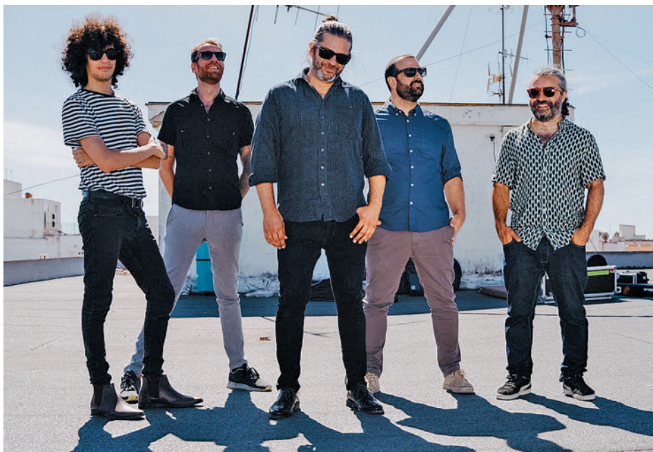
La banda jerezana está trabajando en una gira de presentación de este álbum JAVIER ROSA

» T. Adolfo Marsillach. Sábado 10, 20 horas. Precio: 18 euros.