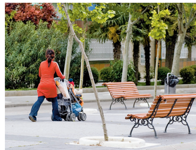
La natalidad bajó el año pasado

Al mismo tiempo, el informe señala que cuando fueron concebidos casi todos los nacidos en 2021 (de abril de 2020 a abril de 2021), se estaba viviendo una "abrupta" caída de la economía y un incremento del paro real. Según el informe, después se siguieron concibiendo hijos a un ritmo normal.