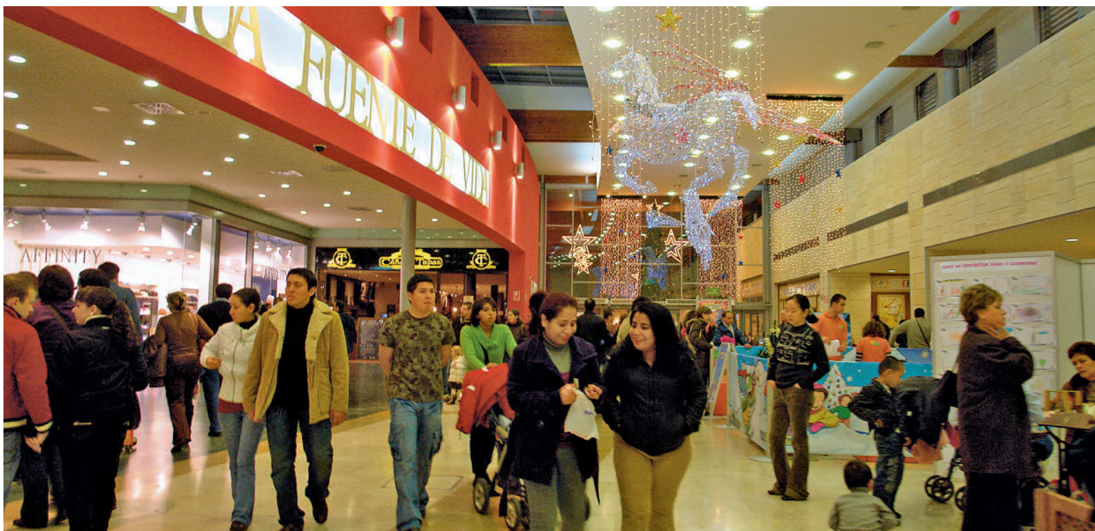
La cantidad de dinero que los españoles destinan a esta Navidad podría descender