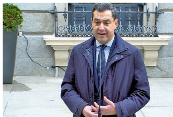
Juan Manuel Moreno Bonilla

ción política es la lista de presentes y, sobre todo, la de los ausentes. En esta segunda categoría es donde hemos encontrado la principal novedad de este año, ya que Vox se ha unido a ERC, Junts per Catalunya, PNV, PDeCaT, Bildu, Compromís y el