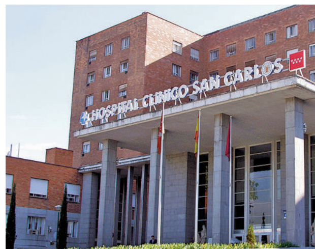
Hospital Clínico San Carlos

Consistirán en la creación de un apartado de Cirugía Mayor Ambulatoria (CMA) en el Bloque C, una nueva área de Oftalmología y la construcción de una planta de producción de frío. En total, se actuará en 10.768 me-