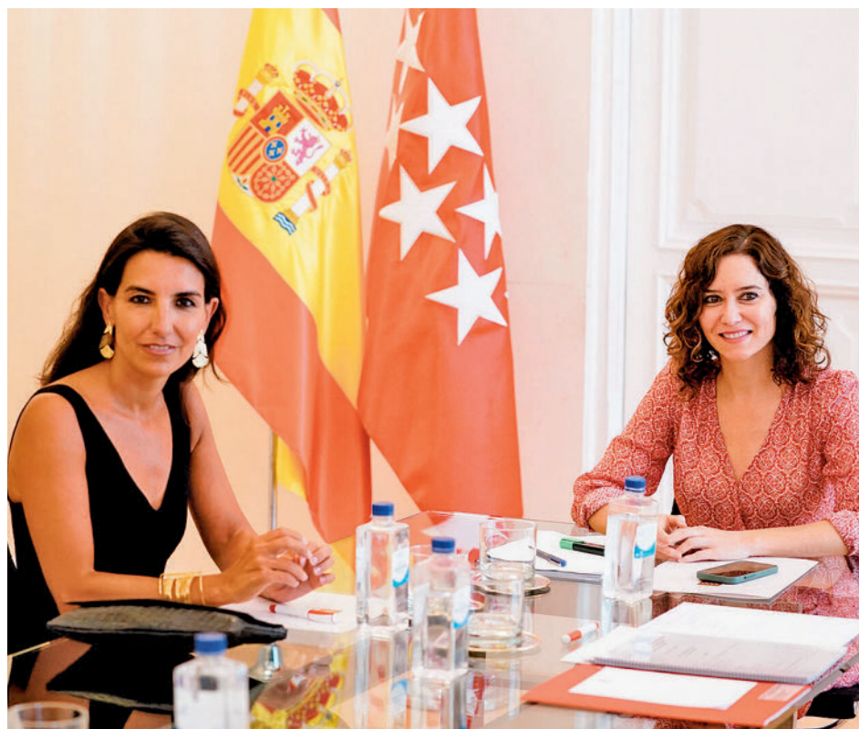
Rocío Monasterio e Isabel Díaz Ayuso, en una reunión

La presidenta de la Comunidad de Madrid, Isabel Díaz Ayuso, insistió en que Vox presentó fuera de plazo sus enmiendas y aseguró que "un tercio" de ellas tenían defectos técnicos y no se podrían haber tramitado incluso si hubieran llegado a tiempo.