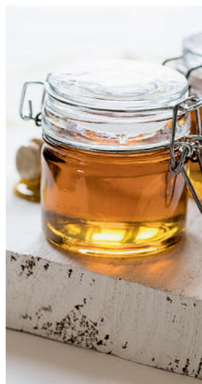
Miel de flores

do contra los catarros de invierno es la miel. Este alimento posee propiedades antiinflamatorias y antioxidantes. Asimismo, diversos estudios han demostrado que su alto poder antiviral hace que nos proteja contra estas afecciones. Además, según otro estudio de la OCU, se afirma que la miel tiene un efecto similar al de los medicamentos anti-tusivos.