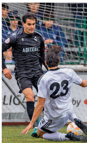
Empate en Canillas

tos respecto al segundo clasificado en el Grupo 7 de Tercera. El líder de la categoría se vio favorecido por el tropiezo del que era su inmediato per-