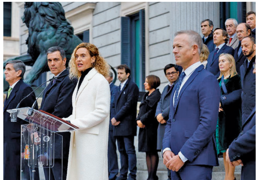
La presidenta del Congreso, Meritxell Batet, durante su discurso