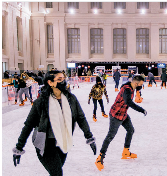
La pista instalada en la Galería de Cristal del palacio de Cibeles

'Patinando sobre letras' es el nombre elegido por Puento de Vallecas para su actividad que, además de pistas de hielo, contará con una caseta de lectura. Estará abierta al