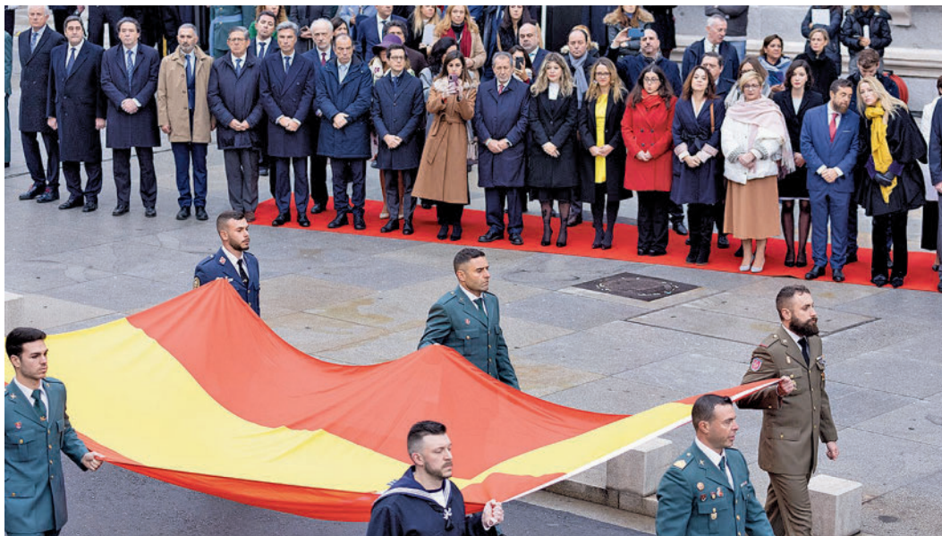
Acto de izado de la bandera de España en el Congreso de los Diputados