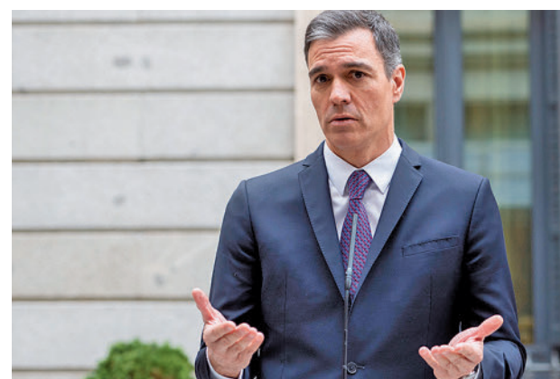
El presidente del Gobierno, Pedro Sánchez

Entre los asistentes (hubo muchos ausentes, tanto de un espectro político como del