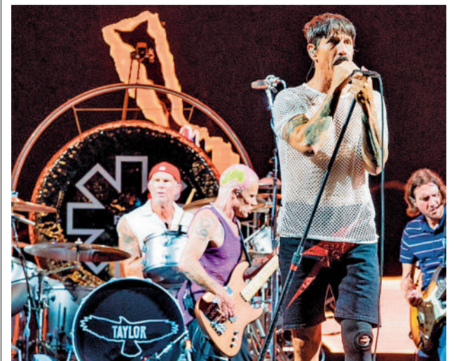
Red Hot Chili Peppers pasará por la capital

A modo de carta de presentación, la banda jerezana ha lanzado dos singles, 'El límite' y 'Qué te puedo dar', esta última una bofetada a la conciencia social en relación a la indigencia, canciones que le han valido a Flecha Valona excelentes comentarios por parte de la crítica especializada, aunque, lejos de fijarse en eso, el grupo aspira a otra meta: "Me conformo con formar parte del panorama musical español, pero sobre todo que nuestras canciones estén en la atmósfera de muchas familias".