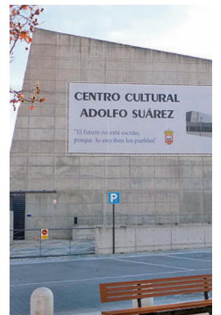
CC Adolfo Suárez

El funcionamiento es muy sencillo. Los interesados podrán adquirir las entradas gratuitas de los espectáculos de forma presencial en la taquilla del Centro Cultural Adolfo Suárez los jueves y viernes de 17 a 20 horas y los sábados y domingos, de 10 a 14 horas, presentando su DNI. Para ello, la Concejalía de Cultura reservará el 10%