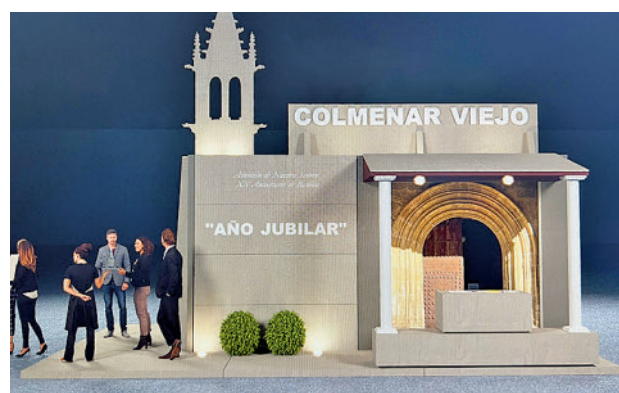
Maqueta del stand de Colmenar Viejo

un stand de Colmenar Viejo. La localidad ha escogido para esta ocasión a la Basílica de la Asunción de Nuestra Señora como imagen representativa, en base a varias efemérides: el pasado año cumplió 20 años desde que Juan Pablo II le otorgó la denominación de Basílica Menor (motivo por