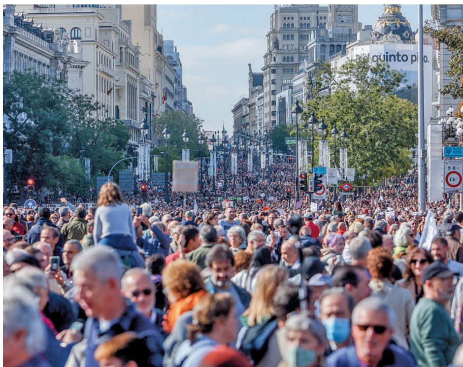
Protesta a favor de la sanidad pública