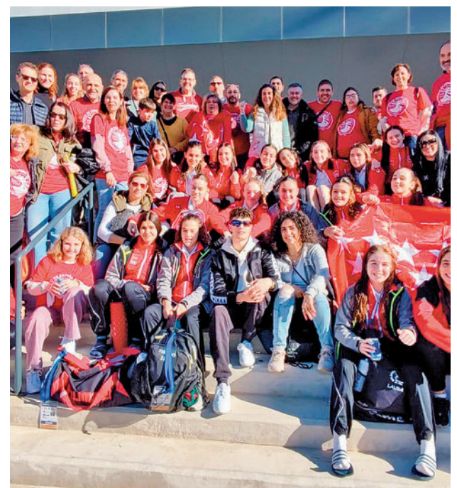
Foto de familia de los convocados

El otro metal lo aportó la selección infantil masculina, que tras caer en semifinales ante Comunidad Valenciana supo pasar página para superar en la final de consolación a Andalucía.