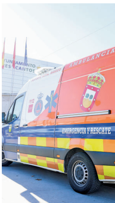
La ambulancia municipal