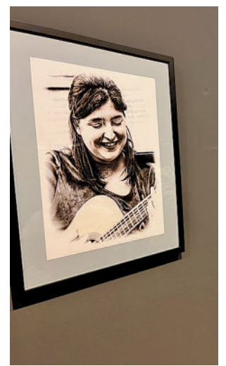
Muestra de la exposición

Toda la información de la zona Este, en nuestra página web