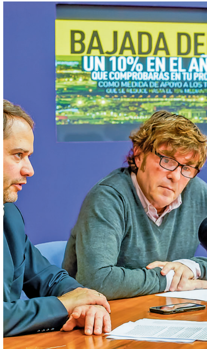
El alcalde (izq.) y el concejal de Hacienda, durante la presentación

El Gobierno de Torrejón también ha previsto ayudas para las familias más necesitadas. De esta forma, los núcleos