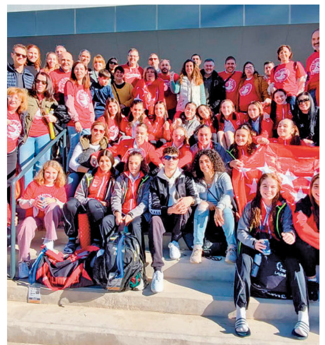
Foto de familia de los convocados

El otro metal lo aportó la selección infantil masculina, que tras caer en semifinales ante Comunidad Valenciana supo pasar página para superar en la final de consolación a Andalucía.