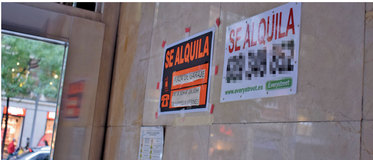
Viviendas de alquiler en Madrid capital