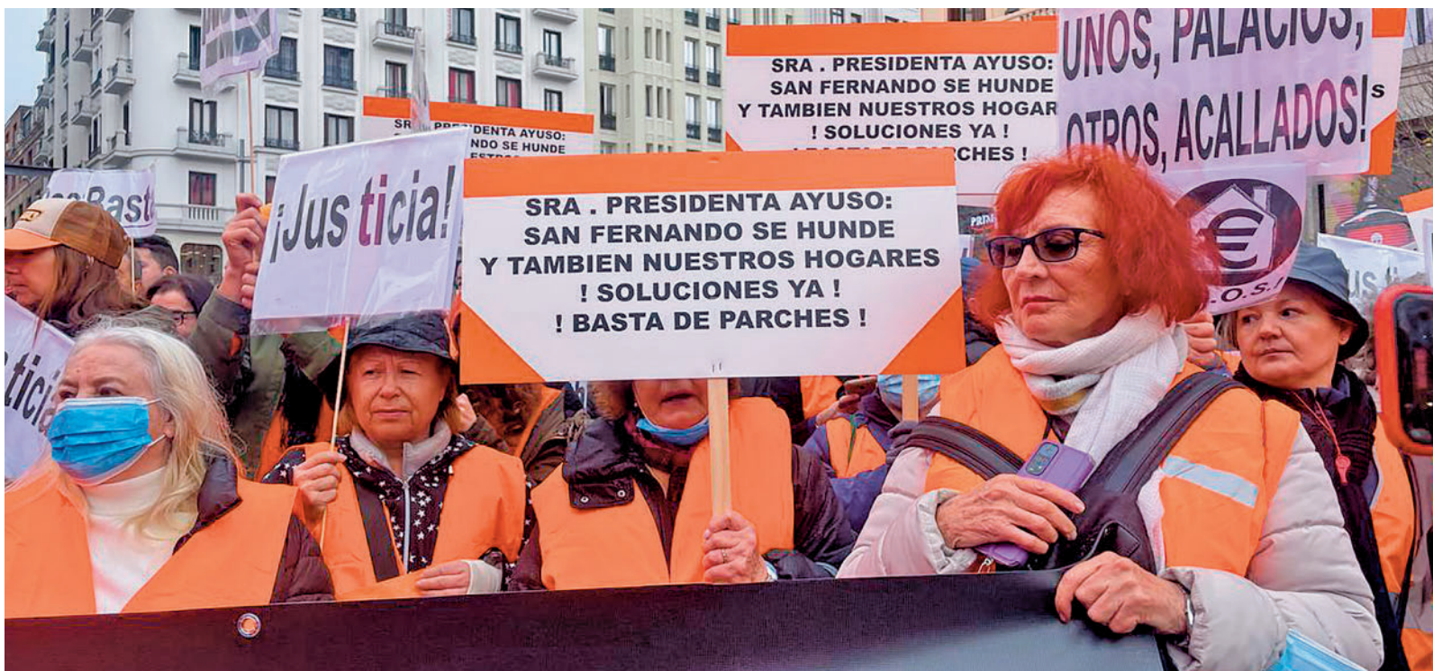
Manifestantes en la Puerta del Sol