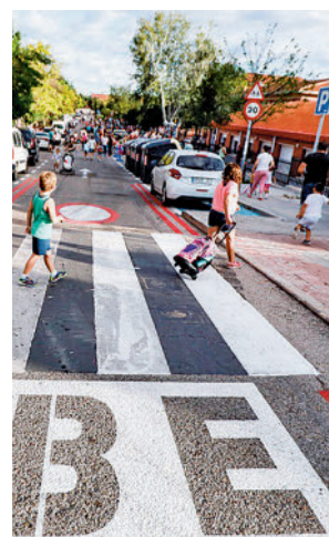
Paso de cebra en Rivas

El objetivo de estas zonas es proteger la salud de los niños, mejorar la calidad del aire en el entorno escolar y mejorar las condiciones de seguridad vial y prevenir futuros accidentes.