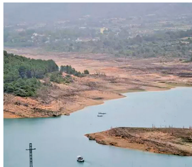
Estado de los embalses: La reserva hídrica de España se encuentra al 47,2% de su capacidad total. En comparación con la media de los últimos diez años, está siete puntos por debajo. Pese a las lluvias de diciembre, su estado sigue siendo preocupante.

Ahorro A nivel individual, el gasto de agua por persona se puede