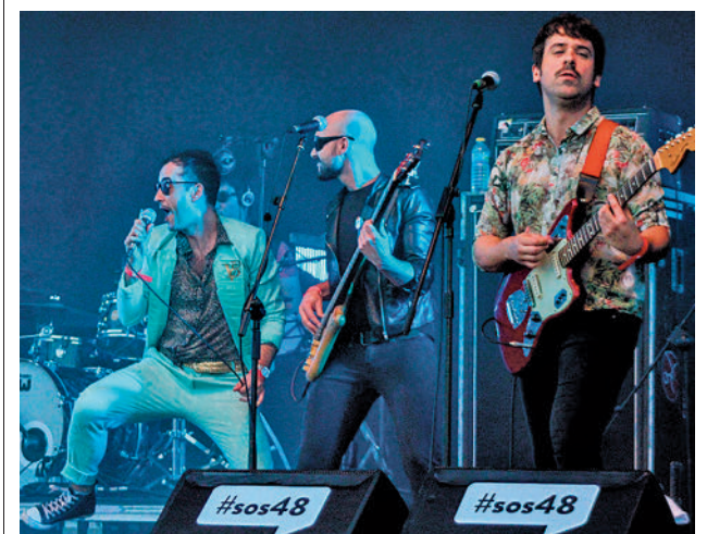
Concierto de Varry Brava

‘Fuenli, reflejo de nuestra infancia’ es el lema elegido para la campaña y hace hincapié en las diferentes realidades individuales de la infancia fuenlabreña. Recordará durante este año a aquellos niños que ya son padres y que siguen unidos al club a través de sus hijos. Para renovar o pedir por primera vez el carné pueden dirigirse a las oficinas de FuenlisClub en el Espacio Joven la Plaza, visitar la web Juventudfuenla.com o llamar al 91 498 90 87.