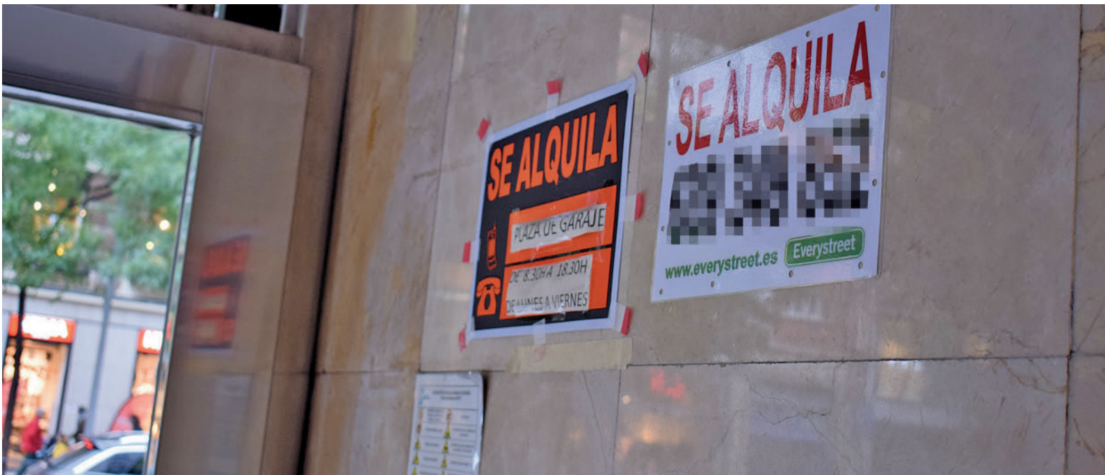
Viviendas de alquiler en Madrid capital GENTE