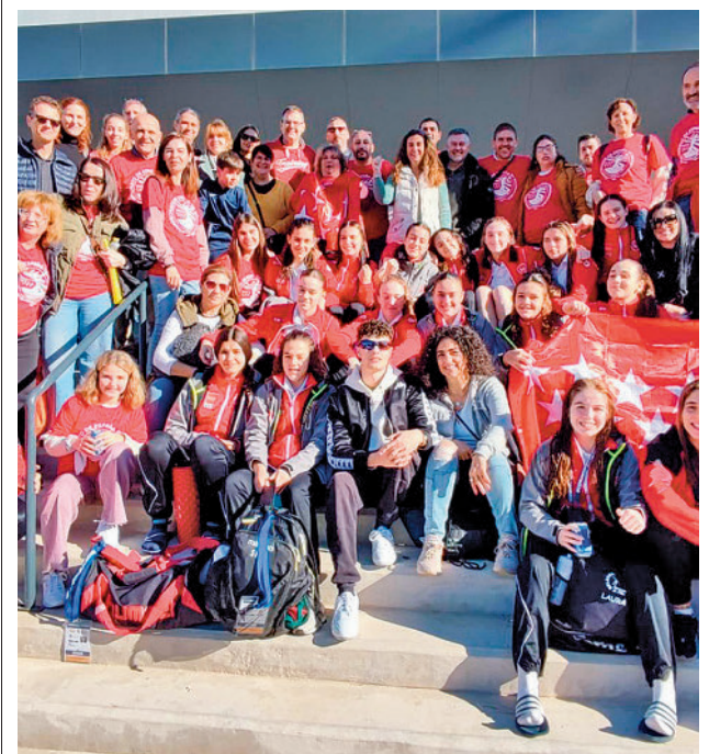
Foto de familia de los convocados

El otro metal lo aportó la selección infantil masculina, que tras caer en semifinales ante Comunidad Valenciana supo pasar página para superar en la final de consolación a Andalucía.