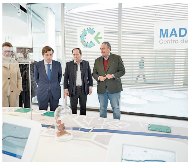
Un momento de la presentación de 'Calle 30 Natura'

El alcalde de Madrid, José Luis Martínez-Almeida, pre-