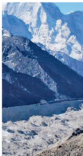
Glaciar en el Himalaya E.P.

para 2100. El trabajo, que publica Science, mostró que el mundo podría perder hasta el 41% de su masa total de glaciares este siglo, o tan solo el 26% dependiendo de los esfuerzos de mitigación del cambio climático. De