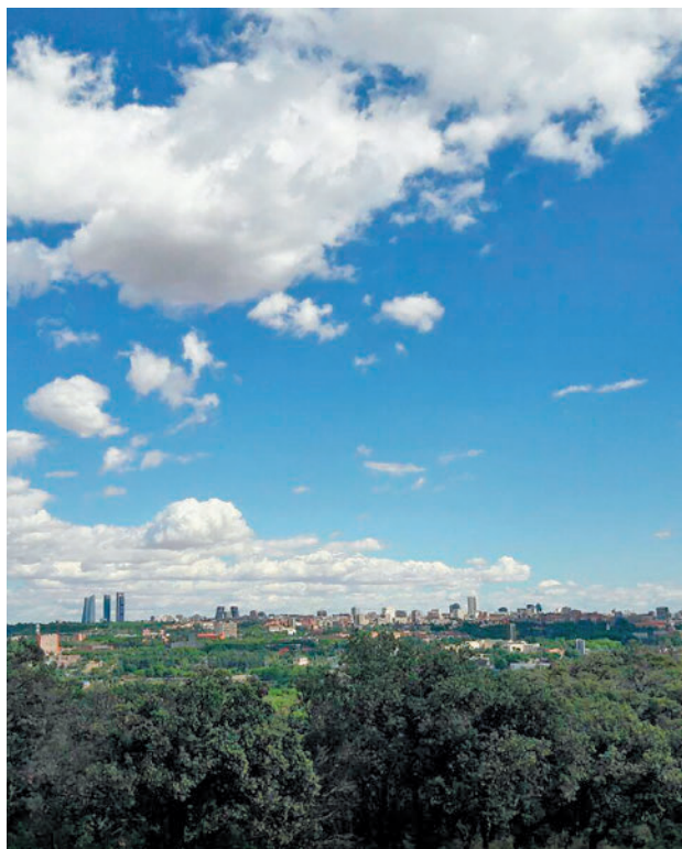
La capital vista desde el pulmón verde de la Casa de Campo

El primer edil aseguró que, de las 231 medidas contempladas, el 60% están completadas y el 30% están en curso. Almeida añadió que su aplicación ha permitido que el valor medio en las 24 estaciones de calidad del aire se haya situado en 2022 en 28,29 µg/m 3 , lo que representa un 22,7% menos que en 2018, último año que ha considerado la Unión Europea para emitir la sentencia en la que