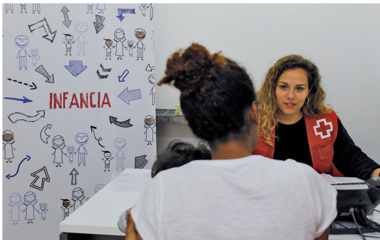
Una trabajadora de Cruz Roja atiende a una usuaria

Las familias monomarentales y monoparentales son