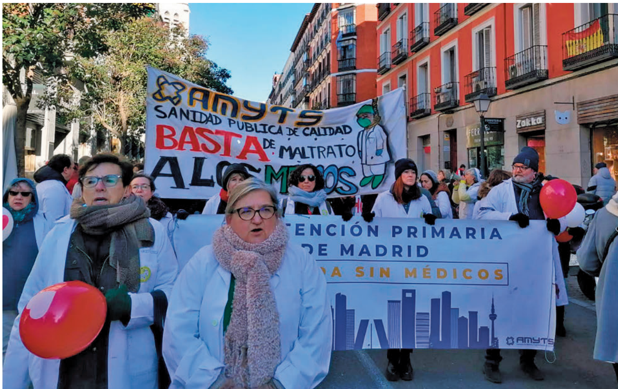
Protesta de los médicos y pediatras de Atención Primaria