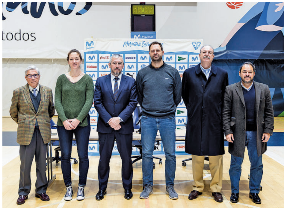
Foto de familia en la presentación de los actos por el 75 aniversario MOVISTAR ESTUDIANTES

Por su parte, el equipo femenino también jugará como local, en su caso en la tarde del sábado 28 (19:30 horas) en Magariños. Su rival será el Hozono Global Jairis, que cuenta solo con un triunfo menos y que viene de ganar a domicilio al Tenerife.