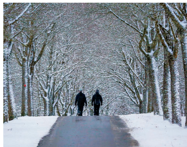
Las precipitaciones han llenado los embalses

Pese al incremento sostenido del agua embalsada en las últimas semanas, la reserva hídrica sigue un 10,23% por debajo de la media de los últi-