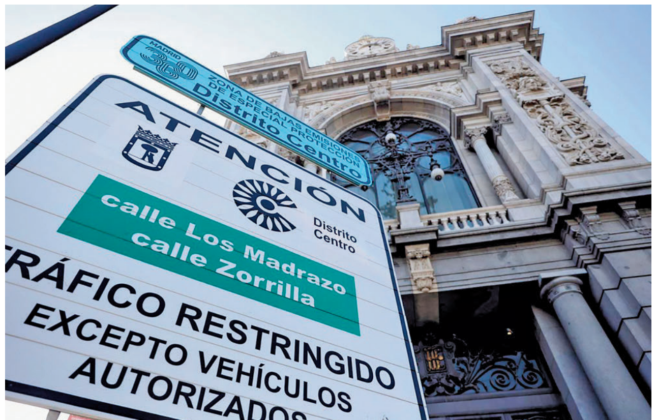
Cartel que delimita una Zona de Bajas Emisiones

Ante esta medida, siete de cada diez españoles se ha planteado usar soluciones de movilidad sostenible como el coche compartido, motos eléctricas, patinetes o bicis eléctricas para circular por su ciudad ante la implantación de las ZBE, según una encuesta realizada por Free Now, una aplicación móvil de movilidad que permite una amplia elec-