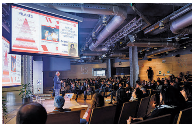
Presentación de la iniciativa

La Comunidad de Madrid ha anunciado la creación de una Red de Centros de Competencias Digitales destinada a personas que no disponen de los equipamientos adecuados para avanzar en las nuevas tecnologías.