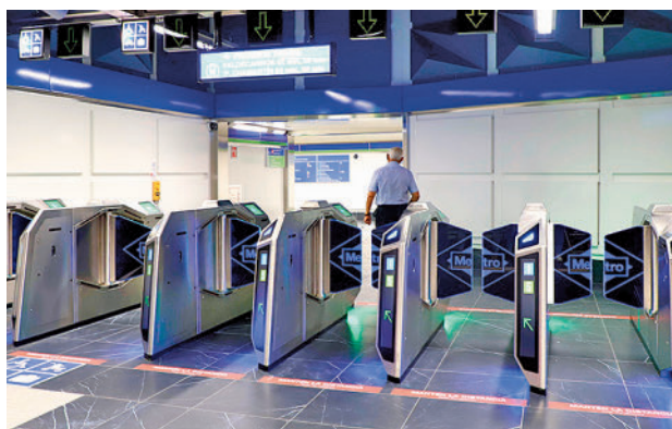
Tornos inteligentes en Metro de Madrid

en Begoña, Menéndez Pelayo, Ventas, Avenida de América, Méndez Álvaro, San Bernardo, Diego de León, Ibiza, Núñez de Balboa, Oporto, Duque de Pastrana, Alonso Martínez, Conde de Casal, Cuatro Caminos, Santiago Bernabéu, Ciudad Universitaria, Manuel Becerra, Juan de la Cierva,