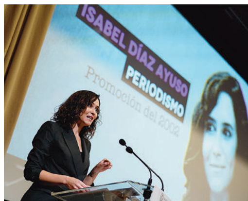
Isabel Díaz Ayuso, en la Complutense

EL PERIÓDICO GENTE NO SE RESPONSABILIZA NI SE IDENTIFICA CON LAS OPINIONES QUE SUS LECTORES Y COLABORADORES EXPONGAN EN SUS CARTAS Y ARTÍCULOS