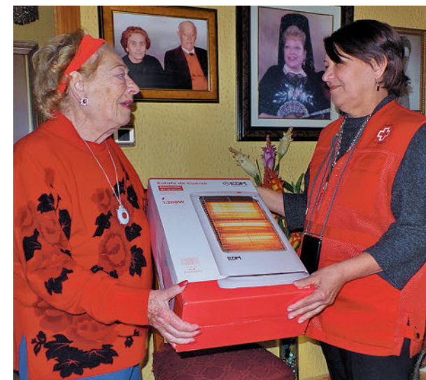
Entrega de aparatos de calefacción

De esta manera, la iniciativa solidaria busca ser una respuesta inmediata con vocación de transformación duradera, implementando acciones que consoliden los cambios en la sociedad.