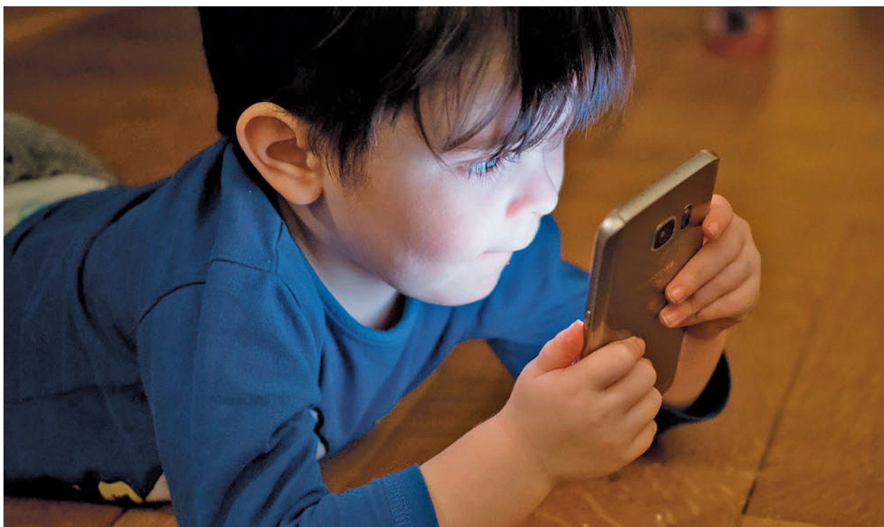
Los menores tienen un acceso cada vez más temprano a los dispositivos electrónicos

En general, la población empadronada en el país aumentó en 2021 en 90.313 personas, situándose a inicios del año pasado en 47.475.420 habitantes. Esta cifra, según señala el Instituto Nacional de Estadística, supone una recuperación del descenso que se registró en 2020, el año marcado por las muertes por la pandemia de la covid-19, y fija un nuevo máximo histórico en la serie del padrón del INE.