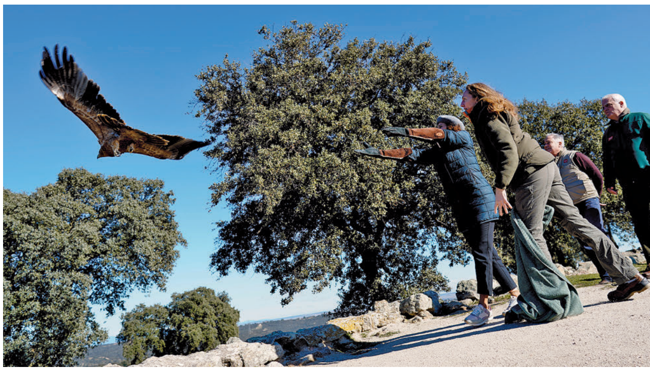
Díaz Ayuso suelta uno de los ejemplares de águila imperial

“Son las mujeres las que padecen más problemas o al menos lo comunican. Pensamos que es importante poner el foco en los hombres, que llegan a nosotros las situaciones más graves y con dificultad en el abordaje”, ha explicado, llamando también a tener en cuenta el papel de las mujeres cuidadoras y la sobrecarga que sufren. “No le damos la importancia que realmente tiene y cuando llega a consulta el problema es ya muy grave”, ha advertido.