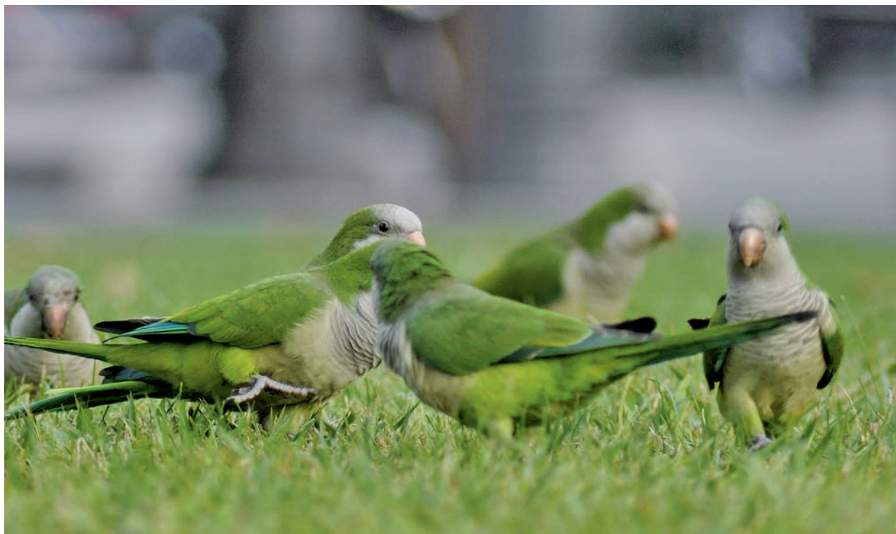
La población de cotorras, a estudio

Una vez que esté concluido este proyecto, la Dirección General de Derechos de los Animales propone llevar a cabo un estudio piloto sobre poblaciones de cotorras, como "referencia para las Corporaciones municipales de toda España a la hora de tomar las decisiones adecuadas encaminadas a ejercer un control de población aplicando métodos diferentes al sacrificio".