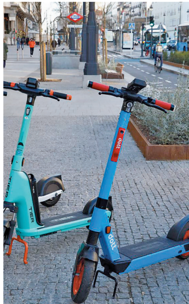
Los tres concesionarias son Lime, Dott y Tier

El edil popular destacó que los nuevos patinetes eléctricos representan una apuesta por implantar un modelo de micromovilidad compartida más ordenado, seguro e integrado en las diferentes plataformas de movilidad. "Más ordenado, porque se limita la zona de estacionamiento de los patinetes; más seguro, porque se incluyen nuevos elementos como las luces reflectantes y la imposibilidad de circular por vías peatonales; y más integrado,