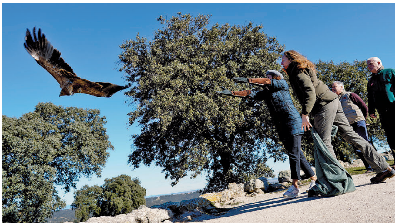
Díaz Ayuso suelta uno de los ejemplares de águila imperial

“Son las mujeres las que padecen más problemas o al menos lo comunican. Pensamos que es importante poner el foco en los hombres, que llegan a nosotros las situaciones más graves y con dificultad en el abordaje”, ha explicado, llamando también a tener en cuenta el papel de las mujeres cuidadoras y la sobrecarga que sufren. “No le damos la importancia que realmente tiene y cuando llega a consulta el problema es ya muy grave”, ha advertido.