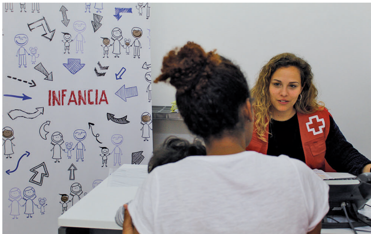
Una trabajadora de Cruz Roja atiende a una usuaria

Las familias monomarentales y monoparentales son