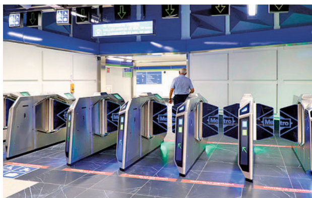
Tornos inteligentes en Metro de Madrid

en Begoña, Menéndez Pelayo, Ventas, Avenida de América, Méndez Álvaro, San Bernardo, Diego de León, Ibiza, Núñez de Balboa, Oporto, Duque de Pastrana, Alonso Martínez, Conde de Casal, Cuatro Caminos, Santiago Bernabéu, Ciudad Universitaria, Manuel Becerra, Juan de la Cierva,