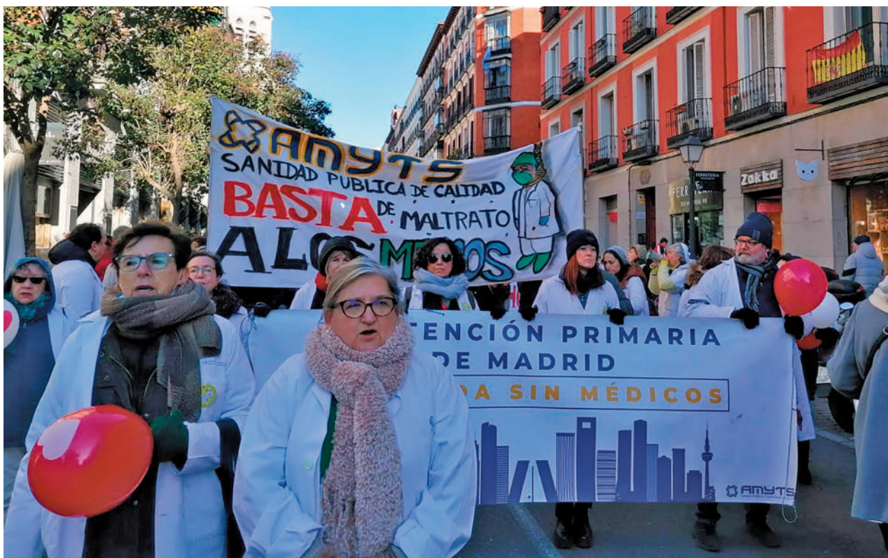
Protesta de los médicos y pediatras de Atención Primaria