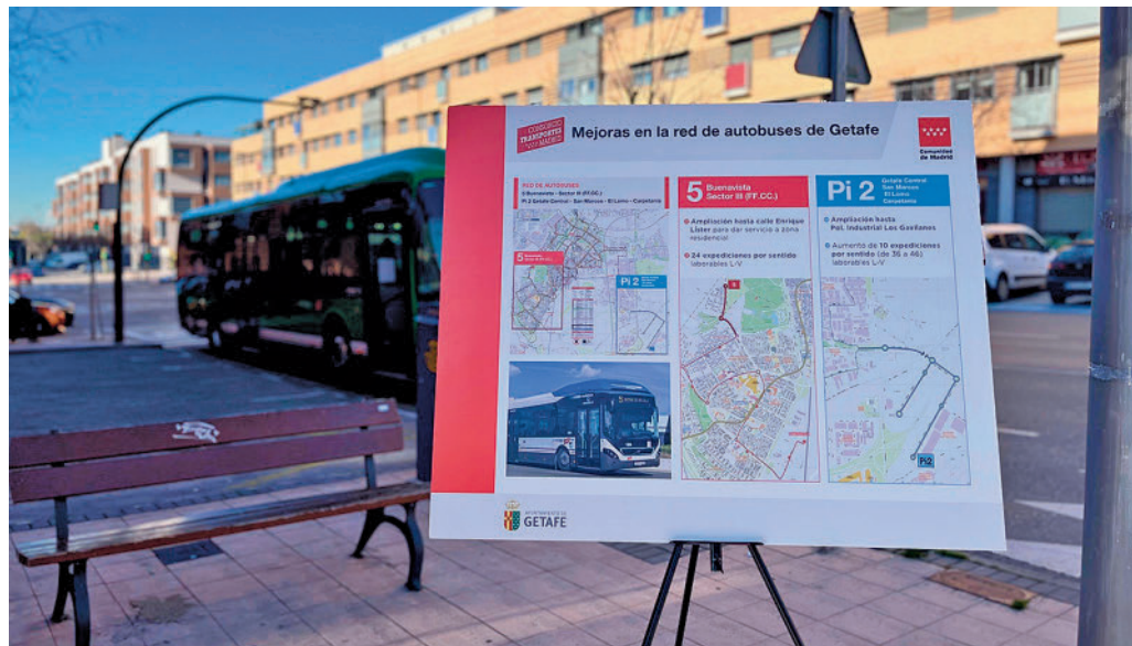
Cartel informativo sobre la ampliación de las líneas

Dos líneas de autobuses urbanos de Getafe han ampliado esta semana sus recorridos. Se trata en concreto de la línea Pi2 Getafe Central-Polígono San Marcos-Polígono El Lomo-Polígono La Carpentana, que llega hasta el Polígono Industrial Los Gavilanes con cinco nuevas paradas e incorpora un nuevo vehículo, ampliándose la oferta en diez expediciones por sentido, pasando de 36 a 46 los días laborables.