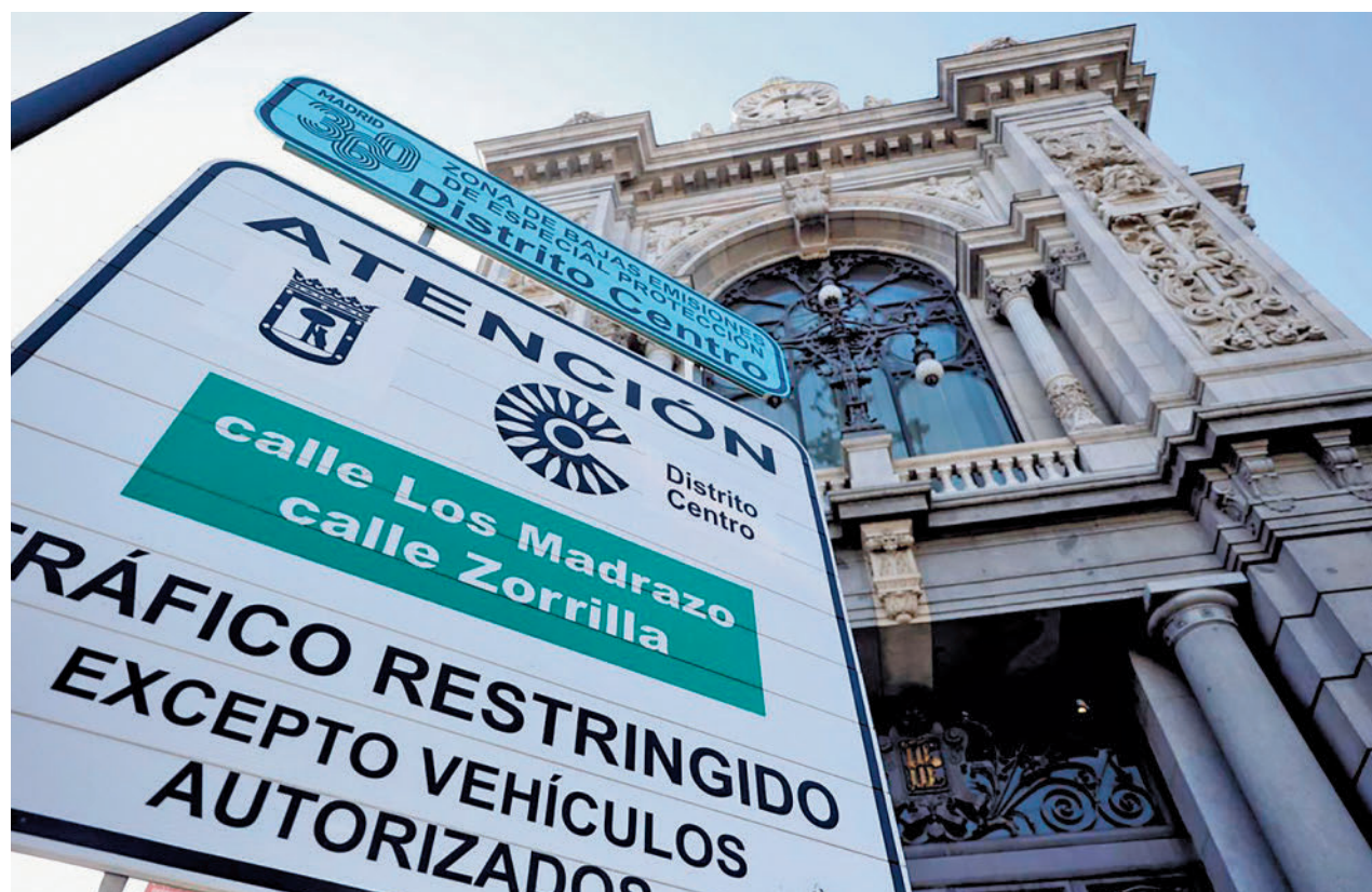
Cartel que delimita una Zona de Bajas Emisiones

Ante esta medida, siete de cada diez españoles se ha planteado usar soluciones de movilidad sostenible como el coche compartido, motos eléctricas, patinetes o bicis eléctricas para circular por su ciudad ante la implantación de las ZBE, según una encuesta realizada por Free Now, una aplicación móvil de movilidad que permite una amplia elec-