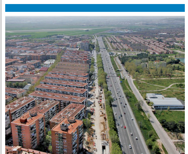
Barrio de La Alhóndiga

El Pleno municipal aprobará el próximo lunes 30 de enero una moción conjunta de PSOE, Podemos y Más Madrid Compromiso con Getafe sobre las necesidades de las infraestructuras educativas de la ciudad.