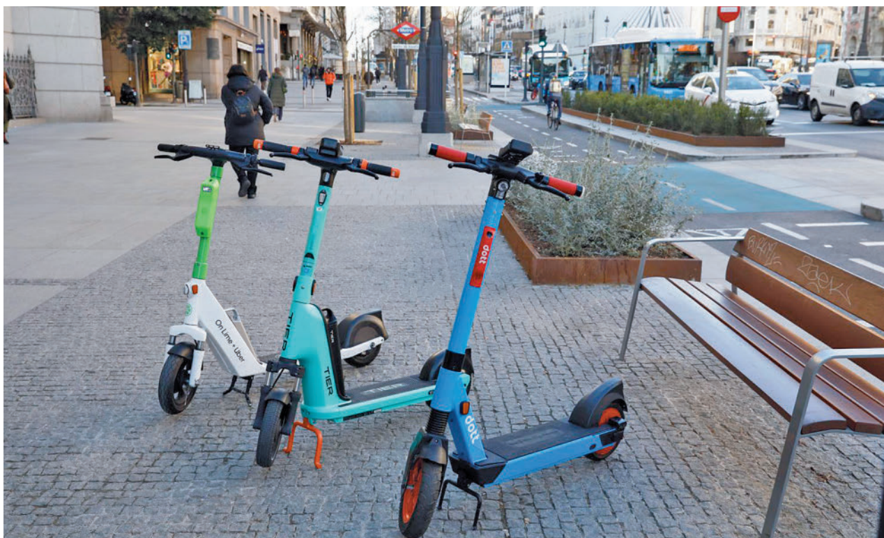
Los modelos autorizados de las empresas Lime, Dott y Tier, las tres concesionarias del servicio en la capital