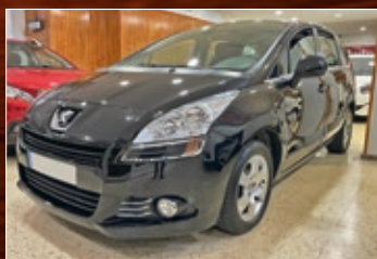
PEUGEOT 5008 HDI 112 CV AÑO 2011 • 10.600€