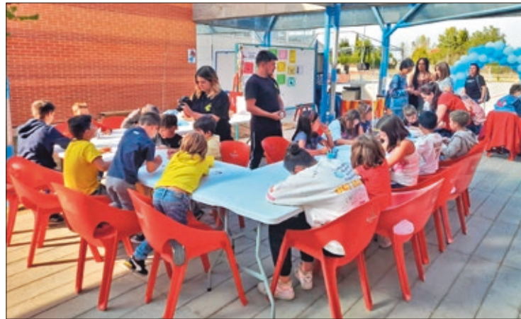
Los talleres programados para niños y jóvenes registran cada año una alta participación.

El coste total supera los 25.000 euros, aunque restando las cuotas ingresadas el gasto final del servicio es de unos 10.000 euros. Una cantidad con la que se desarrollan novedades como 'Cocina del mundo', 'Sábados con Flow' y 'Torneo de Blood Bowl', y se mantienen otras iniciativas ya consolidadas como los talleres de los 'Sábados en Villaobispo', añadiendo los es-