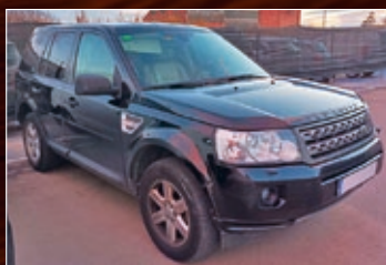
LAND ROVER FREELANDER II TD4 150 CV CUERO AÑO 2010 • 11.600 €