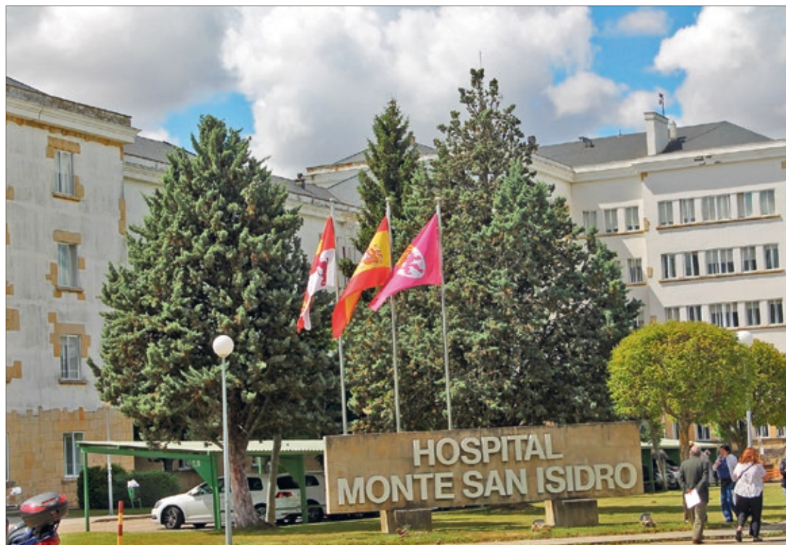
El Hospital Monte San Isidro cuenta con una unidad de cuidados paliativos que el PSOE denuncia olvidada por la Junta.

Desde Juventudes Socialistas de León han detallado que el hospital Monte San Isidro es una infraestructura hospitalaria de Sacyl, vinculada al Complejo Asistencial Universitario de León que, además de unidades de hospitalización de respiratorio, alberga una unidad de cuidados paliativos que procura la atención sanitaria a personas que se encuentran en una fase terminal de su enfermedad. Sin embargo, la organización política juvenil ha denunciado que la Junta, lejos de invertir en este centro público, lo ha relegado a un segundo plano provocando el cierre de camas, como consecuencia de la carencia de