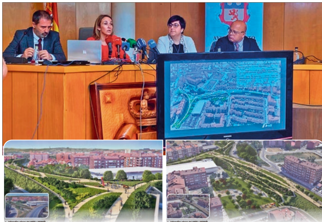
El secretario general de Infraestructuras del Mitma presentó en San Andrés la segunda fase de la integración del ferrocarril.

La solución de la integración del ferrocarril en San Andrés de Rabanedo en superficie responde a tres principios fundamentales como son "que el ferrocarril siga formando