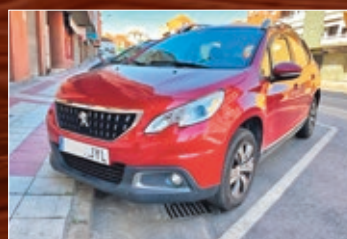
PEUGEOT 2008 ACTIVE 1.2 PURE TECH 110 CV TEMPOMAT, NAVY, ETC AÑO 2017 • 12.600 €