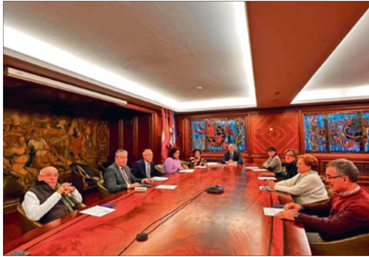
Junta de Gobierno Local del Ayuntamiento de León celebrada el viernes 20 de enero.

Las actuaciones ya están muy avanzadas en la avenida Los Cubos. Prácticamente quedan pendientes de ejecutar los remates y ya se vislumbra el futuro de una vía con tres zonas: una central para el peatón, otra de césped más cercana a la muralla y una tercera en la que se ubica el alumbrado y el mobiliario urbano. También está pendiente de instalar la iluminación orna-