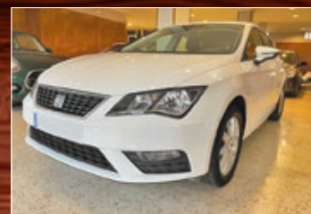
SEAT LEON TDI 115 CV AÑO 2019 • 14.990 €