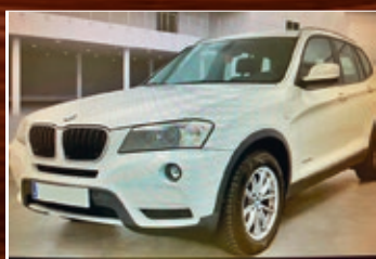
BMW X3 20D X-DRIVE 184 CV. AUTO 8 VEL. NAVY, XENON, LED, ETC... MOD. 2011 • 19.600€