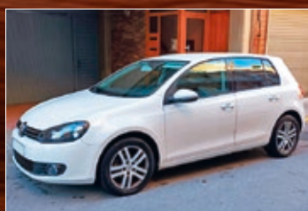
VW GOLF TDI 105 CV 95.000 KMS. AÑO 2011 • 11.200 €