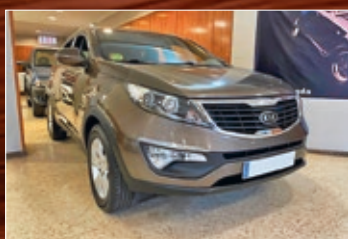
KIA SPORTAGE CRDI 184 CV, NAVY, TECHO, ETC... AÑO 2011 • 11.600€