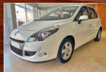
RENAULT SCENIC DCI 110 CV. TEMPOMAT, PARKTRONIC, CLIMA, NAVY TOMTOM, ETC... AÑO 2012 • 9.600 €