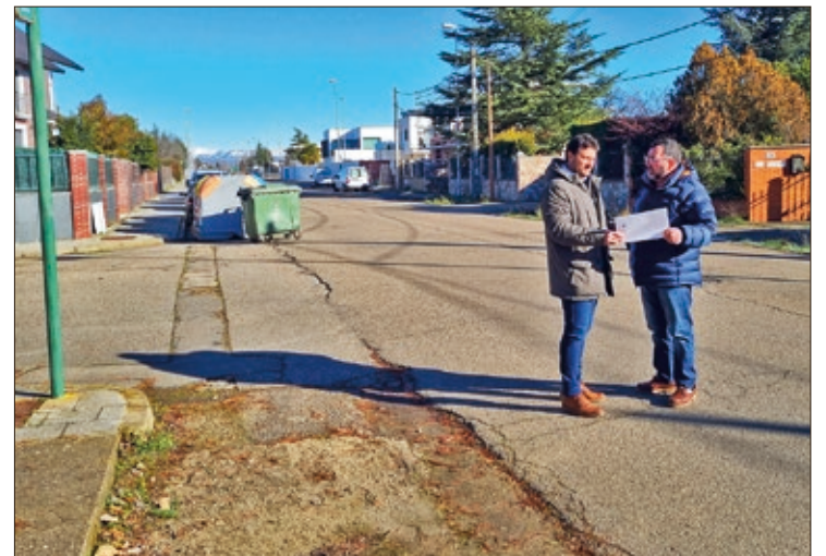
El alcalde y el concejal de obras visitaron 'El Camión', que será objeto de mejoras.