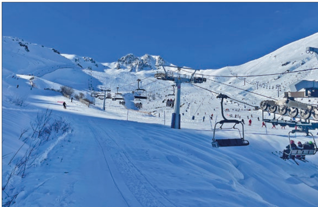
La nieve no ha caído de forma muy abundante, pero se puede mantener gracias a la fabricación de la artificial con los cañones.

La ilusión y la fidelidad de los usuarios por comenzar la temporada en las instalaciones del municipio de Puebla de Lillo se vio reflejada en la afluencia durante el primer fin de semana con un total de 4.120 esquiadores y la fría y soleada jornada del domingo como la de mayor concentración (2.610 esquiadores) que pudieron disfrutar de los servicios de la estación. La procedencia de los visitantes se ha repetido en lo que ya viene siendo habitual: Castilla y León, Asturias, Galicia y Portugal.