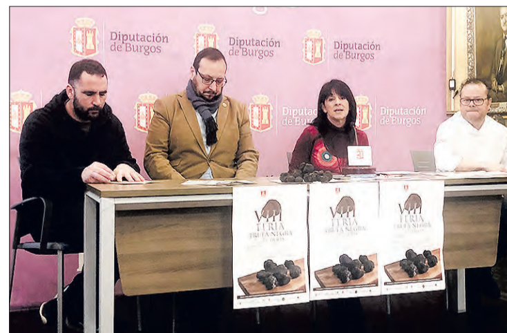
Presentación de la feria, en la Diputación Provincial, el miércoles 25.