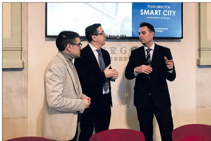
Presentación del Plan Director, el lunes 23.

De esta manera, el alcalde señaló que esta estrategia tiene que confluír en un “sistema integral” que proporcione seguridad y accesibilidad de la gestión de todos los servicios municipales.