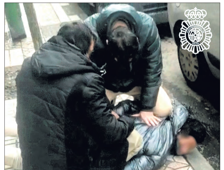
Imagen de la detención del presunto agresor.

Por la mañana se recibió en la Comisaría Provincial una llamada del HUBU, informando de que se había personado una mujer que manifestaba haber sido víctima de agresión sexual. Una patrulla se desplazó hasta el centro hospitalario, dando inicio al protocolo establecido. La víctima les explicó que había conocido a un joven en un local de copas con el que había entablado conversación y, más tarde, mientras se dirigían a otro establecimiento el varón insistió de forma reiterada en mantener relaciones sexuales, rechazando ella sus proposiciones.