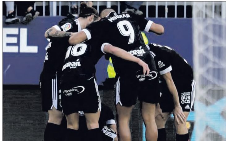
El equipo burgalés cosechó un valioso empate la pasada jornada.

El conjunto de Orriols, tras el empate en Butarque, prolonga su