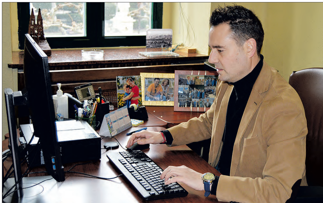
El alcalde, en su despacho de la casa consistorial.

Voy a huir del debate de solo infraestructuras, porque parece que si no haces grandes obras como que no has gestionado, y yo he querido insistir mucho en que somos el gobierno de la gente que buscamos resultados para la