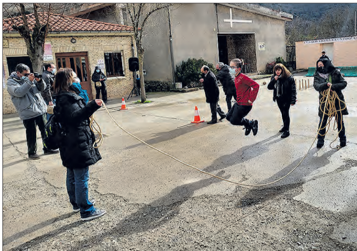
Imagen de una de las actividades celebradas el año pasado.

Si bien reconoció que se están tomando medidas, como la mejora de las comunicaciones y la progresiva extensión de la banda ancha, considera que son paliativas. Lo que se debe hacer, insistió, es “no cobrar tanto al que quiera abrir su negocio en el en-