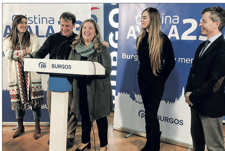
Presentación de la precampaña del PP de Burgos, el miércoles 25.

Asimismo, puso de relieve que la precampaña se va a basar en el