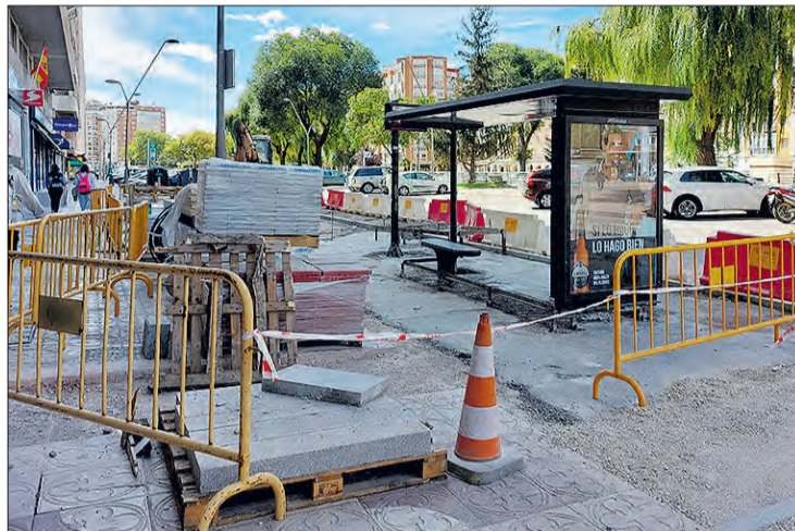
Obras en una parada de transporte público en la Avenida Reyes Católicos.

Por otro lado, Moreno dio a conocer durante la rueda de prensa ante los medios de comunicación los resultados de la encuesta de satisfacción de autobuses urbanos realizada por