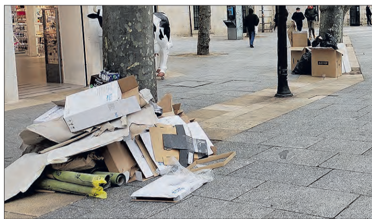
Hasta ahora, el Ayuntamiento solo gestionaba la recogida de papel y cartón, y a partir del día 30, se recogerán también 'puerta a puerta' envases de vidrio, materia orgánica y plásticos tipo film.

nuevo servicio comprende el Centro Histórico y las zonas comerciales de la ciudad, como pueden ser el barrio del G-3, Gamonal y la zona sur y se han establecido dos rutas de camión por cada fracción.