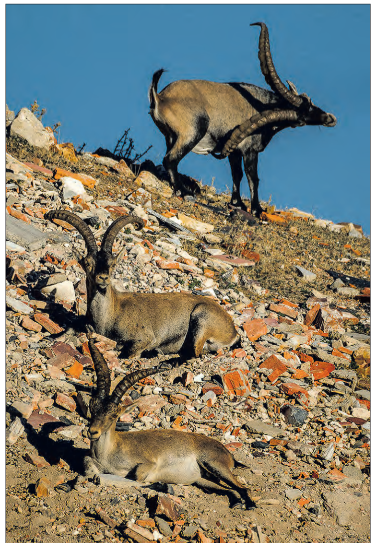
Fotografía premiada, 'La escombrera', de Carlos Bueno.

Esta sexta edición ha contado con la colaboración de ModaRe, restaurantes como Masala o Maricastaña, la Fundación Oxígeno, NutreBurgos, Universitas, Fotoflash, Merlín Fotografía, San Miguel y un largo listado de patrocinadores, entre los que se encuentra Gente en Burgos.