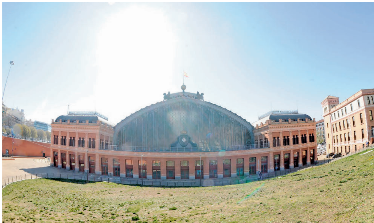
La estación de tren Madrid Puerta de Atocha Almudena Grandes

En el exterior, se acondicionarán las dos plazas laterales, la del Embarcadero y el patio de Méndez Álvaro, para adaptarlas a la configuración de la cubierta histórica y se habilitarán nuevos espacios. Tras las obras, la marquesina se convertirá en acceso prioritario a la estación y punto de referencia de Atocha en el marco del Paisaje de la Luz, declarado Patrimonio Mundial de la Humanidad por la UNESCO.