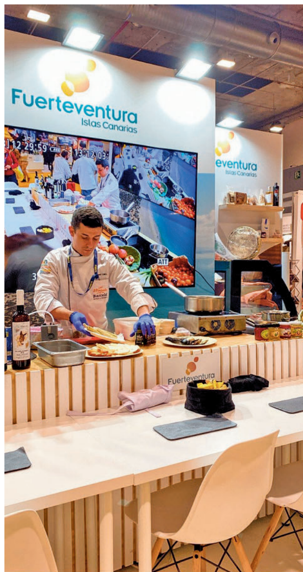
'Showcooking' en el stand de Fuerteventura MADRID FUSIÓN

Ambos cocineros tienen claro que deben seguir la hoja de ruta que les marca los productos de su comarca, Tolosa. Y si hay un plato estrella en Ama Ta-