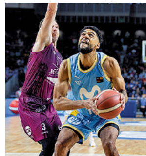
Partido especial para el 'Estu'

El Complutense Cisneros se aferra a la sexta plaza tras vencer a Les Abelles. Este domingo visita al Real Ciencias Enerside, mientras que el Pozuelo viajará hasta el campo del Barça Rugby.