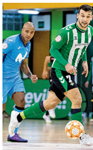
Triunfo en la pista del Betis

con ánimos renovados. Para empezar, este viernes (20:30 horas) recibirá al Xota FS, en partido correspondiente a la jornada 19 de Primera Divi-