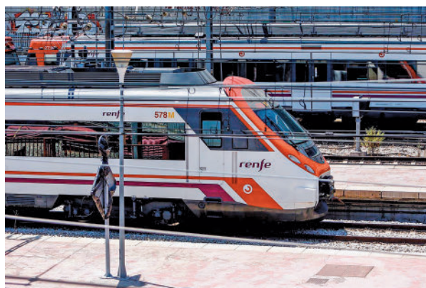
Estación de Chamartín

Los trenes procedentes de Alcobendas-San Sebastián de los Reyes y Colmenar Viejo finalizarán servicio en Chamartín-Clara Campoamor donde los viajeros podrán continuar su reco-