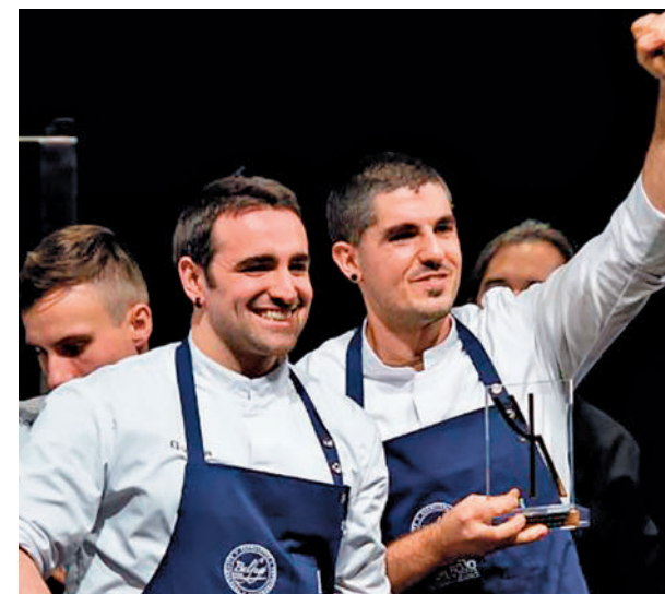
Los premiados recogiendo el galardón MADRID FUSIÓN