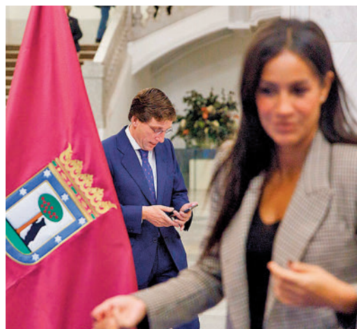
Martínez-Almeida y Begoña Villacís

EL PERIÓDICO GENTE NO SE RESPONSABILIZA NI SE IDENTIFICA CON LAS OPINIONES QUE SUS LECTORES Y COLABORADORES EXPONGAN EN SUS CARTAS Y ARTÍCULOS