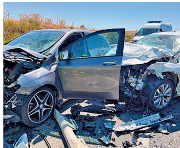
Accidente en la Comunidad de Madrid