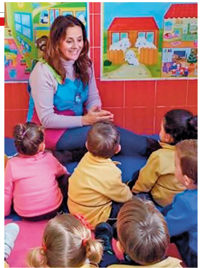
Aulas de Educación Infantil

Para adecuar los espacios a la llegada de los alumnos más pequeños la Comunidad de Madrid va a destinar casi 5