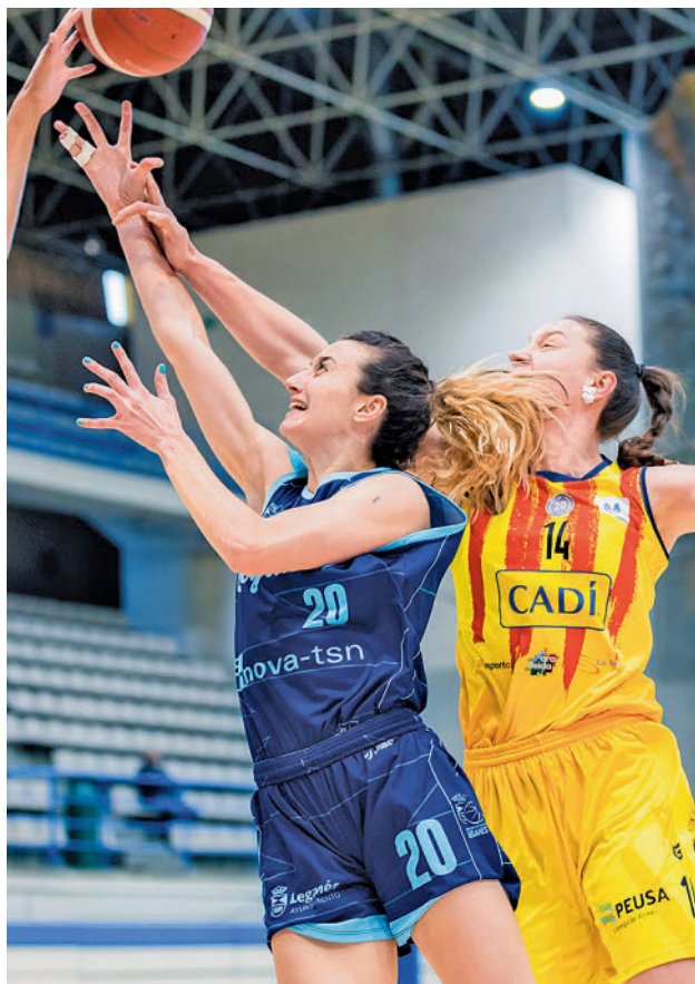
El Cadi La Seu asaltó el pabellón Europa FEB

EL MOVISTAR ESTUDIANTES VUELVE A ESTAR ENTRE LOS OCHO MEJORES