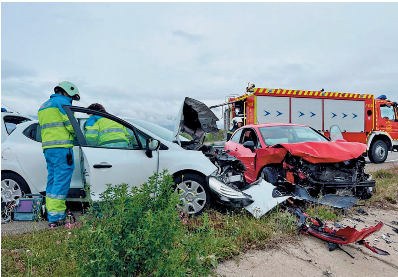
Accidente de tráfico en la Comunidad de Madrid