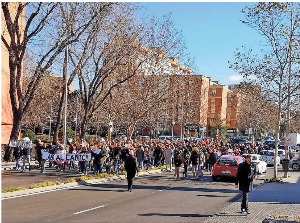
Un momento de la protesta ciudadana del pasado sábado 29 de enero