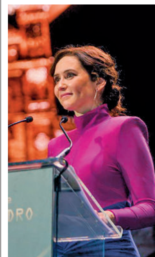
Díaz Ayuso, en el acto

El número de usuarios de audiolibros se ha duplicado en los dos últimos años, pasando de un 2,3% a un 4,2% (6,1% entre los jóvenes de entre 14 y 34 años).