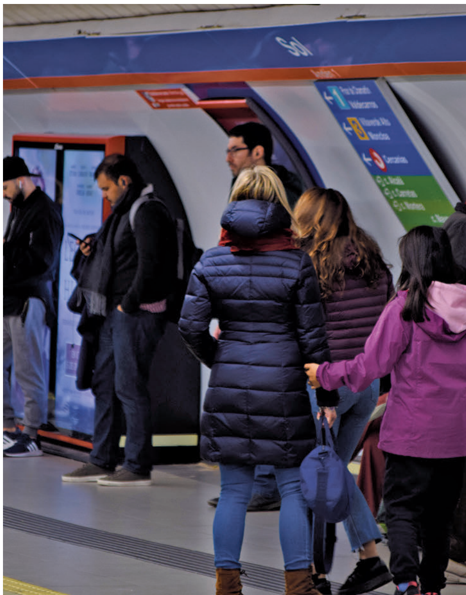
Transporte público en la Comunidad de Madrid

Renfe ha emitido 319.910 abonos gratuitos de Cercanías y Media Distancia en la Comunidad de Madrid para los desplazamientos entre el 1 de enero y el 30 de abril de 2023. La inmensa mayoría, 294.427, corresponde a abonos para viajar en Cercanías, mientras que el resto son de Media Distancia convencional. Para agilizar la adquisición de los abonos y evitar esperas innecesarias, la adquisición de los abonos es posible a través de la app de Cercanías Renfe.