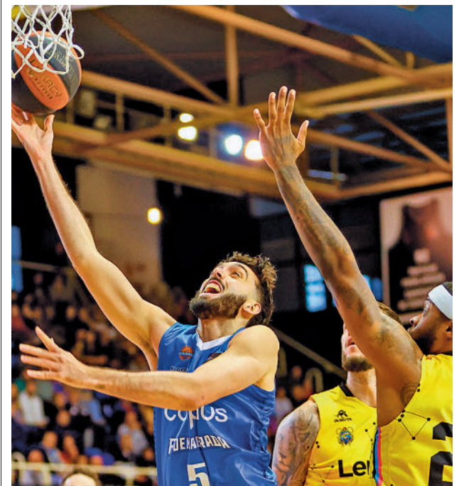
El Carplus sigue siendo colista

Por su parte, el Real Madrid también se medirá con un rival directo, el Lenovo Tenerife. El conjunto insular llega este domingo (18:30 horas) al WiZink Center con solo una derrota más que los blancos, que además vienen de una semana ajetreada en Europa.