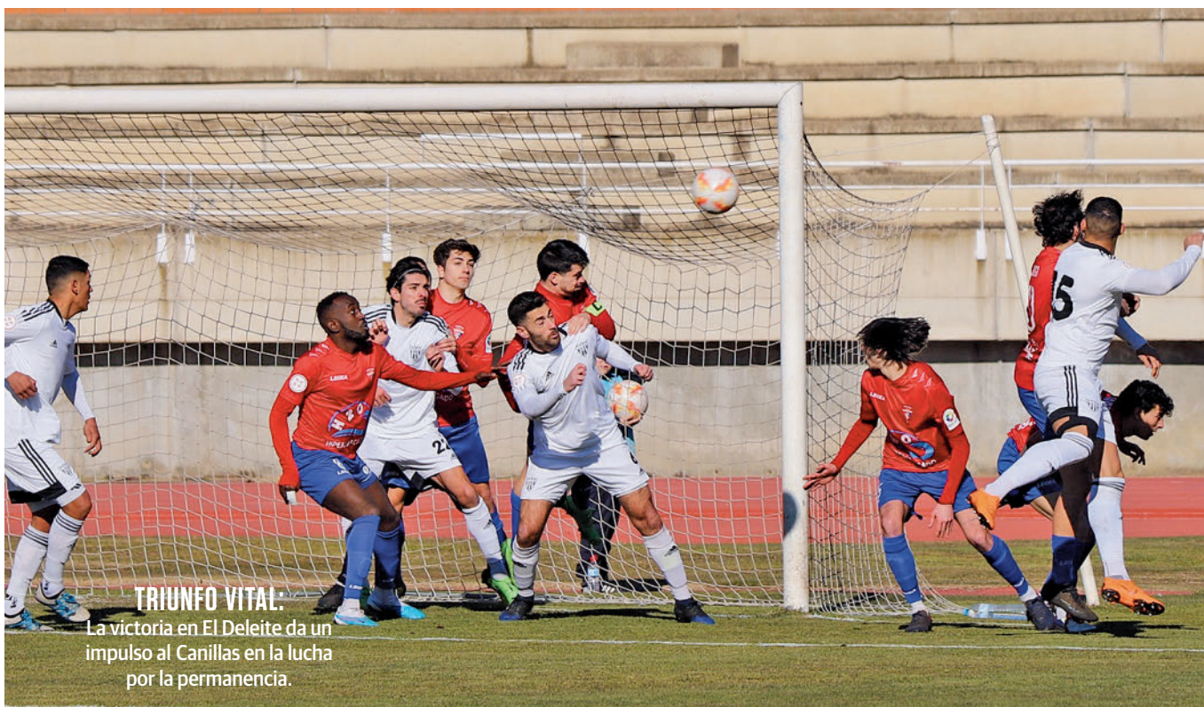
TRIUNFO VITAL: La victoria en El Deleite da un impulso al Canillas en la lucha por la permanencia.