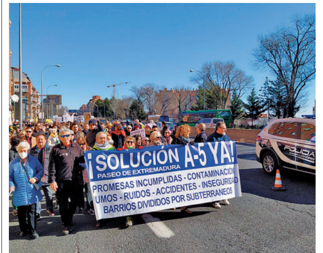
La cabecera de la manifestación vecinal AV CAMPAMENTO

Los vecinos explicaron que más de 130.000 vehículos circulan a diario junto a sus viviendas. “El uso indebido del Paseo de Extremadura, una vía urbana, como vía rápida es un atentado continuo contra las personas residentes en el distrito ya que genera innumerables problemáticas que dificultan vivir con dignidad”, enfatizaron.