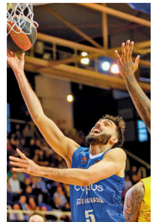
El Carplus es colista

A pesar de ello, tanto Real Betis como BAXI Manresa también continúan anclados en el balance de 3-15, por lo que los puestos de salvación están cerca. Un poco más arriba en la tabla está su próximo rival, el Coviran Granada, que es cuarto por la cola