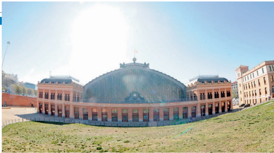
La estación de tren Madrid Puerta de Atocha Almudena Grandes

visibilidad de los efectivos y diferenciar a su vez al cuerpo de otros colectivos que actúan en la vía pública, fundamentalmente el de Policía Municipal. Además del color, el atuendo introduce otras mejoras para los agentes. Una de las más importantes, es que los anoraks se ajustan por primera vez a las necesidades de las 75 mujeres integradas en el cuerpo.