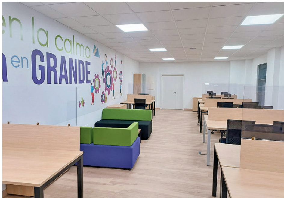
Espacio de 'coworking'

El espacio está dotado con mobiliario, conexión a Internet, sala de reuniones y una cómoda estancia acondicio-