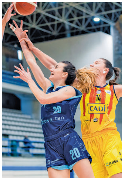
El Cadi La Seu asaltó el Europa FEB