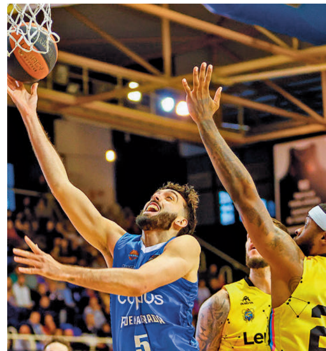
El Carplus sigue siendo colista

Por su parte, el Real Madrid también se medirá con un rival directo, el Lenovo Tenerife. El conjunto insular llega este domingo (18:30 horas) al WiZink Center con solo una derrota más que los blancos, que además vienen de una semana ajetreada en Europa.