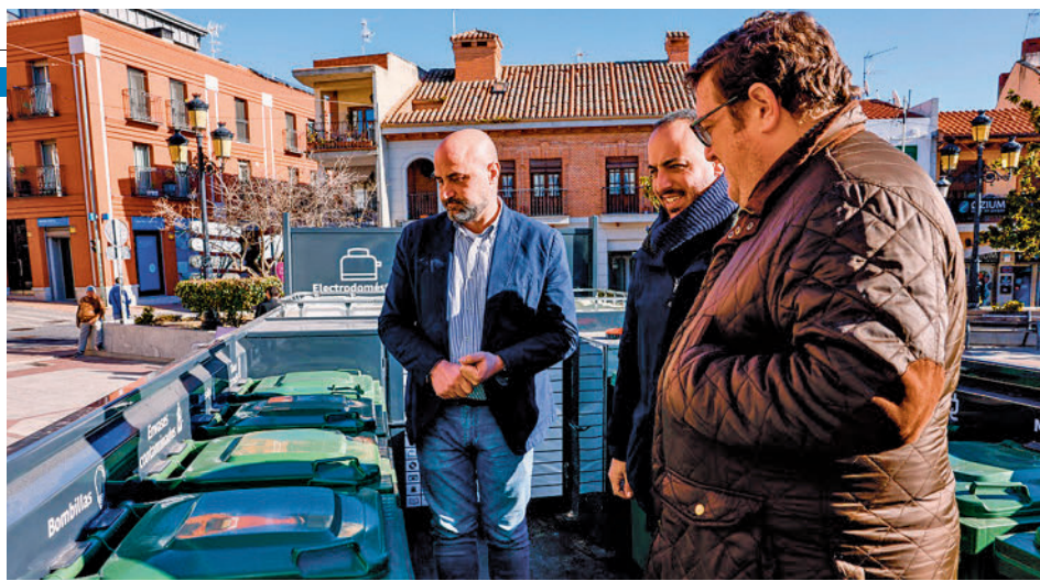
Las autoridades, durante la presentación de los puntos limpios móviles

Dos nuevos dispositivos móviles recorrerán la localidad para favorecer la recogida y reciclaje de productos domésticos, gracias a sus 14 fracciones