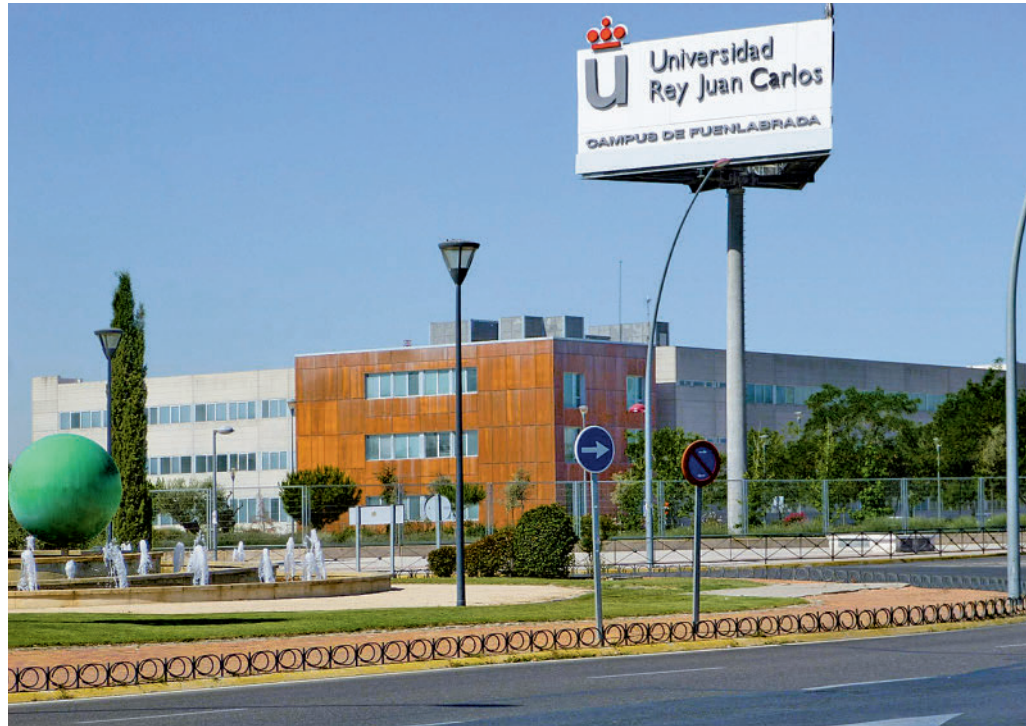
Universidad Rey Juan Carlos en Fuenlabrada

Para acceder a las 'Universiayudas', los alumnos deben