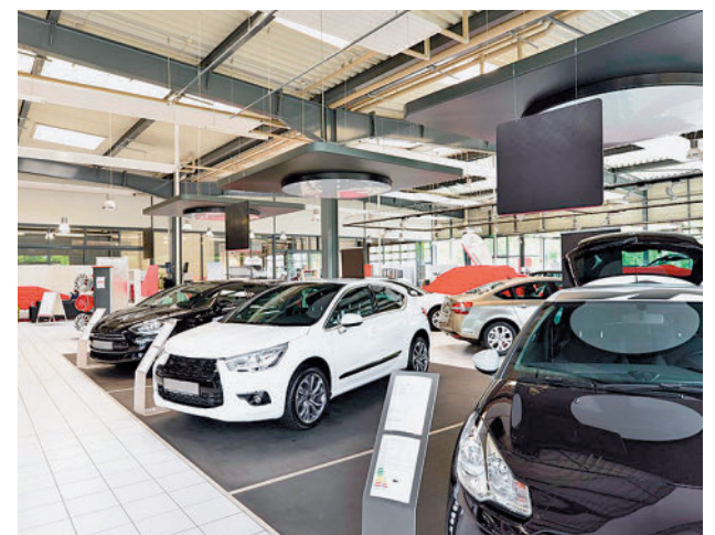
Enero fue un buen mes para el sector

A pesar del significativo crecimiento de las entregas de automóviles en España en el primer mes del año 2023, los datos contabilizados todavía se encuentran un 26% por debajo de las cifras anteriores a la pandemia de covid, ya que en enero de 2020 se matricularon casi 86.450 unidades.