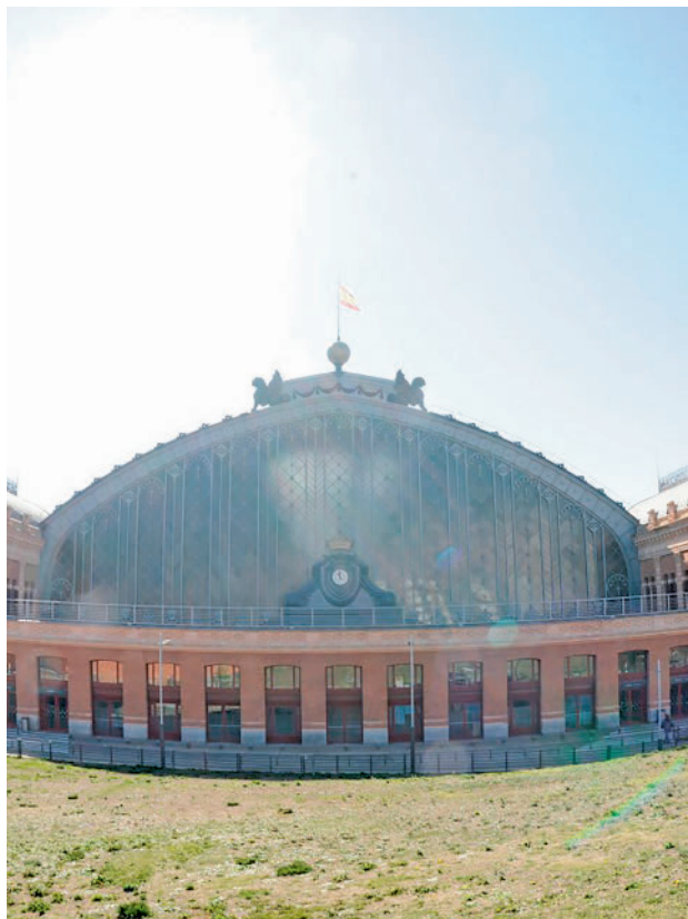
La estación Madrid Puerta de Atocha Almudena Grandes

Además, Adif reformará los accesos desde la glorieta de Carlos V • La actuación tendrá una duración de tres años y costará 56,5 millones de euros