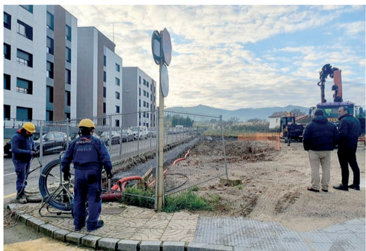
López Estrada visitó las obras el lunes.

Según se recoge en el pliego de condiciones, el edificio se deberá desarrollar en planta baja más tres