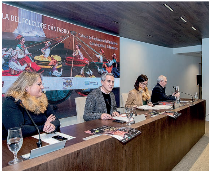
Un momento de la presentación de la XXII Gala del Folclore Cántabro.

Así lo anunciaron el miércoles el vicepresidente y consejero de Cultura, Pablo Zuloaga; la directora general de Acción Cultural, Ge-