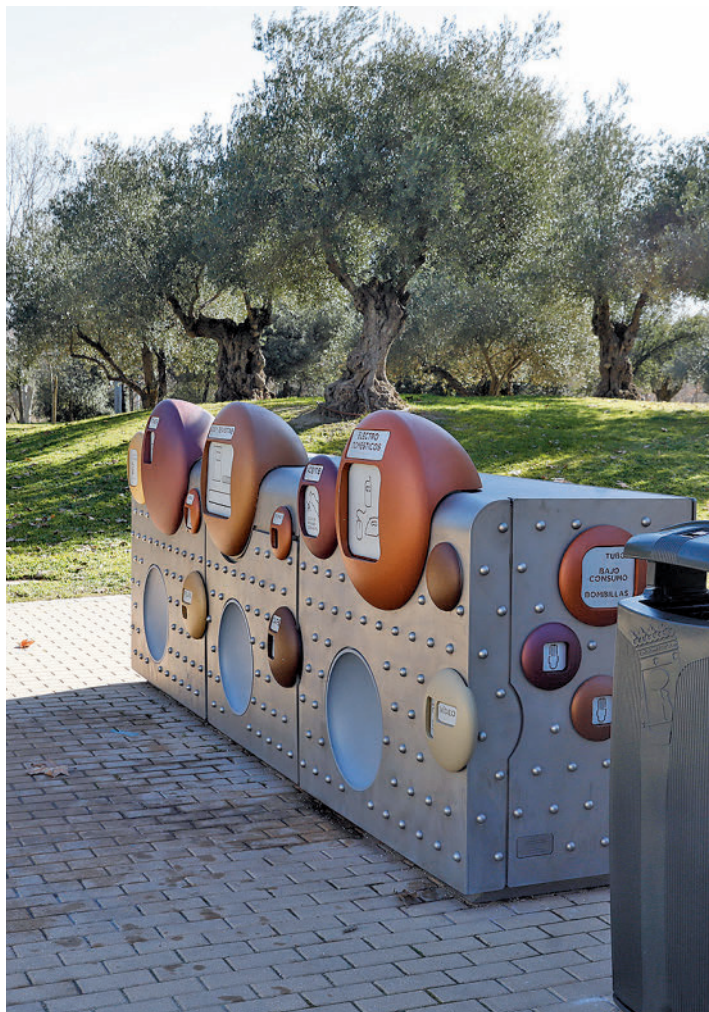
Los contenedores de proximidad y las papeleras inteligentes

LA PAPELERA INTELIGENTE SE IMPLANTÓ EN 800 CIUDADES DE 23 PAÍSES