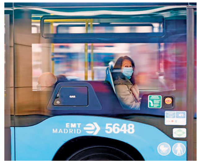
Las mascarillas ya no son obligatorias en el transporte