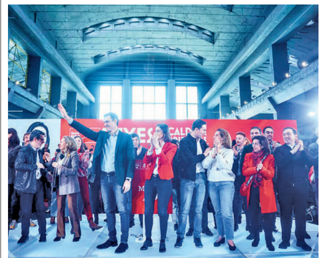
Foto de familia a la finalización del acto electoral

Durante el pasado año, a nivel internacional, el modelo de este tipo de puntos se exportó a Sharjah (Emiratos Árabes Unidos). En España, fue Cáceres la ciudad que reprodujo esta infraestructura.