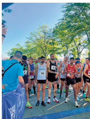
La salida de 2022

lugares emblemáticos del distrito como la Colonia de la Prensa, la plaza de Carabanchel, la finca de Santa Rita o la ermita de San Isidro. A la prueba tradicional de 21 Kilómetros-Ruta 21 K, con salida y meta en el Puente de Toledo, se sumarán otras de distancias menores, la 7 k x 7