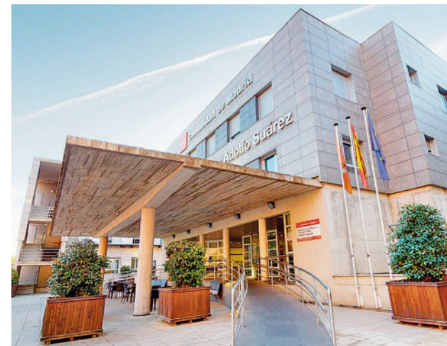
Una de las residencias de la Comunidad

Cada recorrido consta de 20 a 30 tomas fotográficas en 360°, interiores y exteriores. Las capturas realizan un barrido circular de los ambientes, libres de obstáculos y personas, para poder comprobar el estado real de las instalaciones y de los servicios ofrecidos en todos los centros. Se muestra desde el aspecto exterior del edificio hasta sitios menos accesibles como las cocinas.