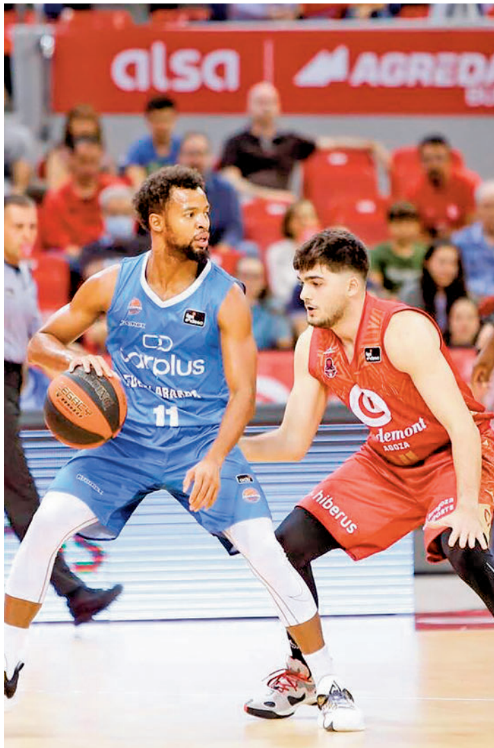
El Carplus Fuenlabrada continúa como colista