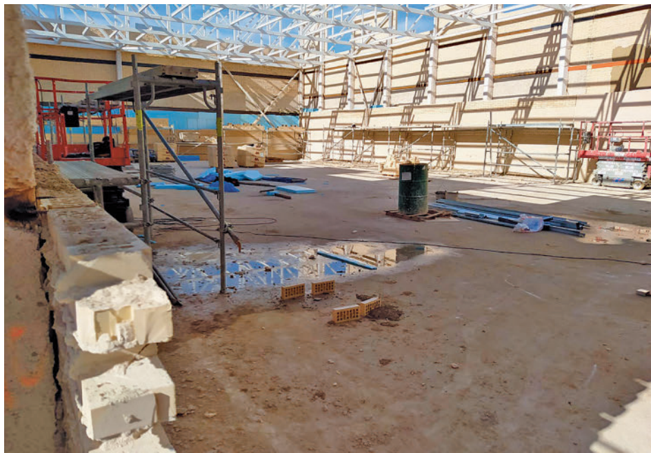
Obras en el instituto Elisa Soriano Fischer

El padre también indicó que ahora mismo se está construyendo la segunda fase del instituto, que tenía que estar funcionando "desde hace