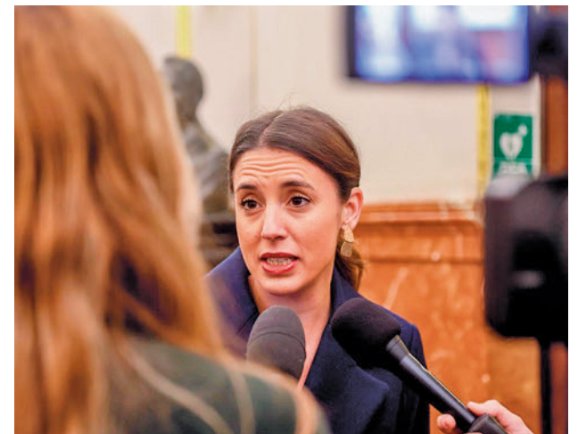
La ministra de Igualdad, Irene Montero

El texto socialista tendrá que pasar ahora por el trámite parlamentario, en el que podrá ser modificado. No obstante, lo más relevante es si Unidas Podemos acepta estos cambios en su propia ley o si se ensancha la brecha en el Gobierno.