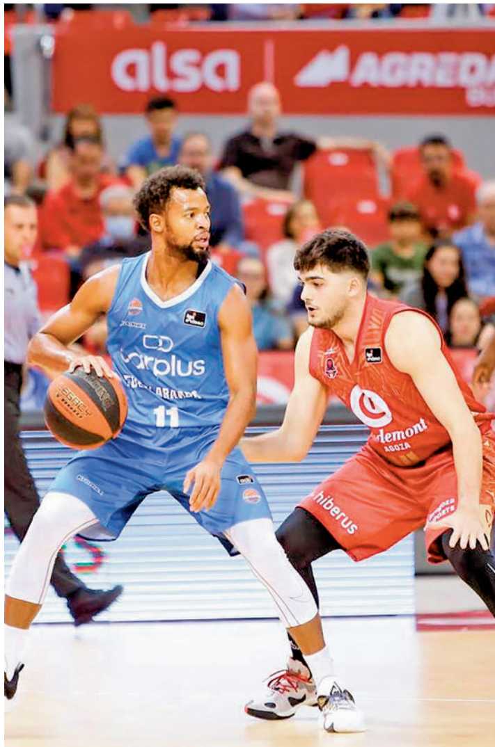
El Carplus Fuenlabrada continúa como colista