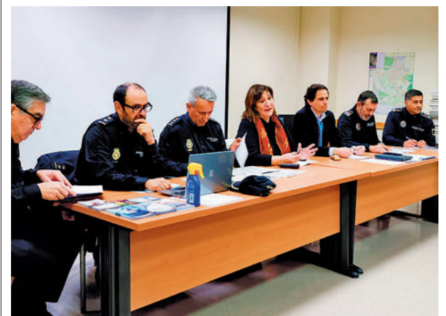
La alcaldesa, junto a miembros de los cuerpos de seguridad