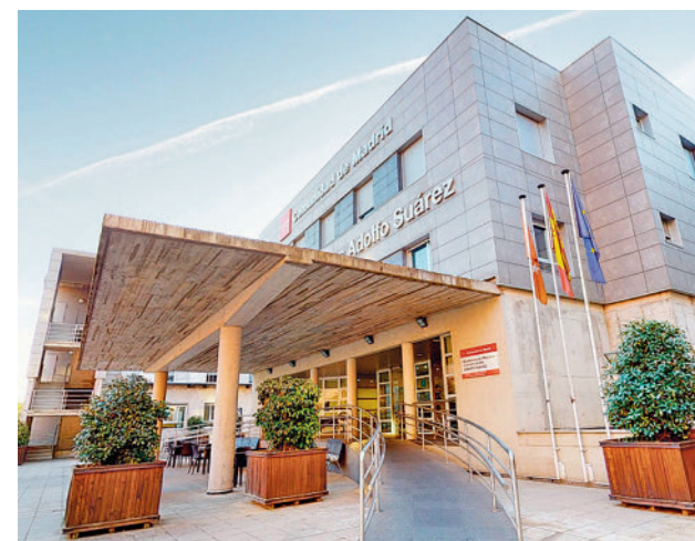
Una de las residencias de la Comunidad

Cada recorrido consta de 20 a 30 tomas fotográficas en 360°, interiores y exteriores. Las capturas realizan un barrido circular de los ambientes, libres de obstáculos y personas, para poder comprobar el estado real de las instalaciones y de los servicios ofrecidos en todos los centros. Se muestra desde el aspecto exterior del edificio hasta sitios menos accesibles como las cocinas.