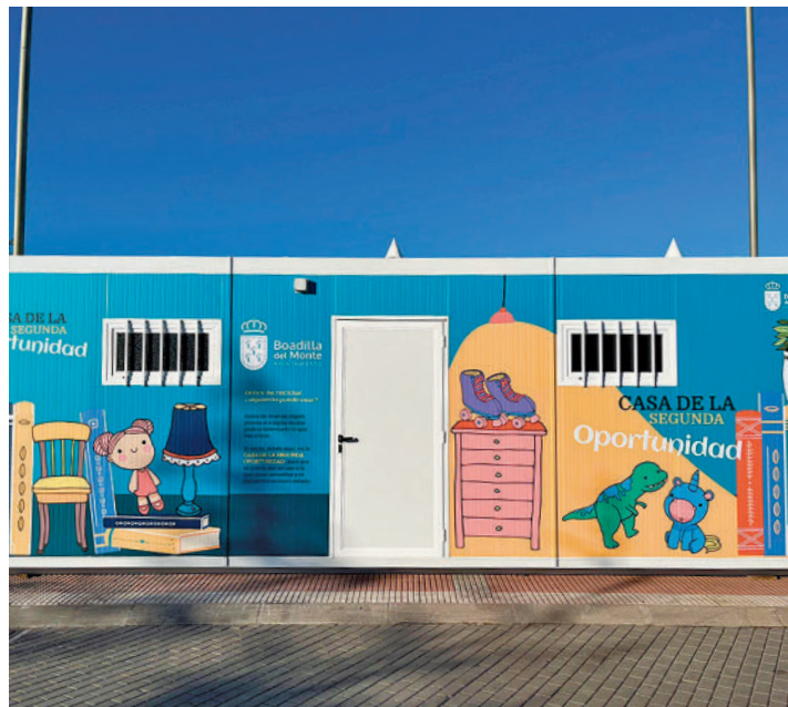
Las nuevas dependencias municipales

Fuentes municipales explican que esta iniciativa responde a la filosofía de la eco-