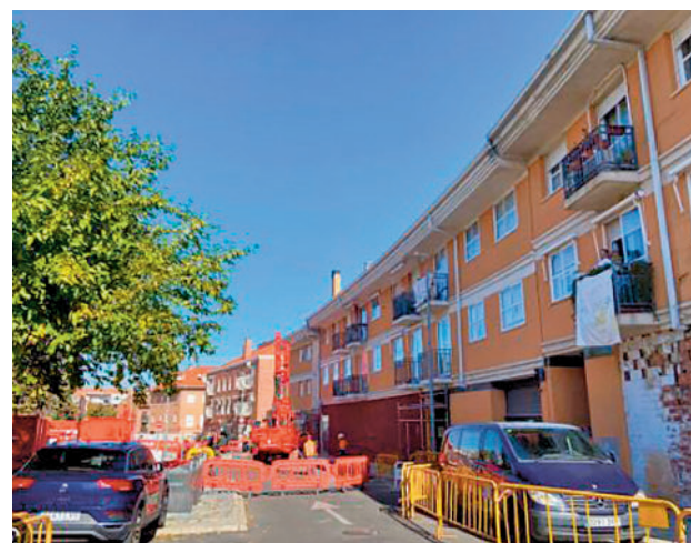
Obras en la calle Rafael Alberti E.P.

tabilización, dirección facultativa y coordinador de seguridad y salud, trabajos de apeo y apuntalamiento, catas, sondeos, ensayos, colocación de extensómetros, vigilancia del inmueble e inspección estructural del edificio situado en la calle Rafael Alberti 7 de la localidad. Se incluyen en esta partida los gastos derivados del realojamiento como manutención,