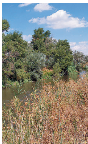
Río Jarama AYTO. RIVAS

la mosca negra en los tramos de los ríos Jarama y Manzanares que discurren por el término municipal de Rivas Vaciamadrid. El contrato incluye además la información a la ciudadanía y al personal municipal de los tratamientos a