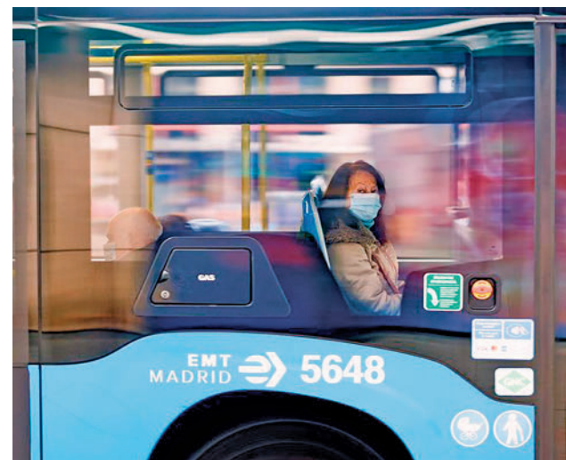
Las mascarillas ya no son obligatorias en el transporte