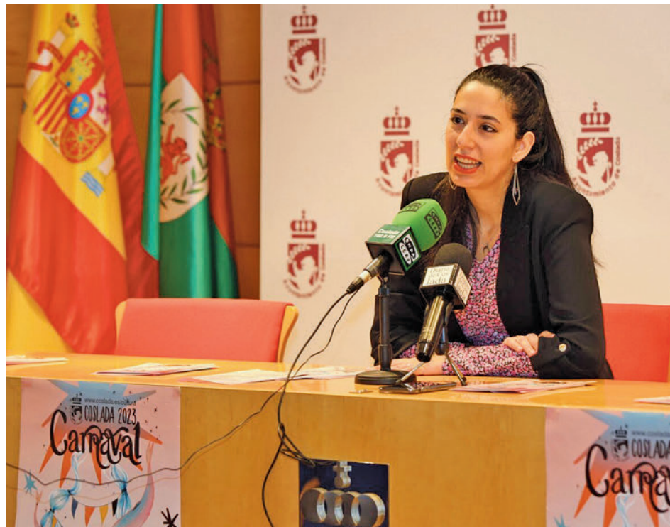
La concejala de Cultura, durante la presentación del programa

Precisamente, en relación con el desfile, la concejala de Cultura detalló que "sin duda alguna será uno de los más numerosos en participación, puesto que ya han confirmado su presencia más de 1.000 personas y un total de 41 comparsas, además de dos