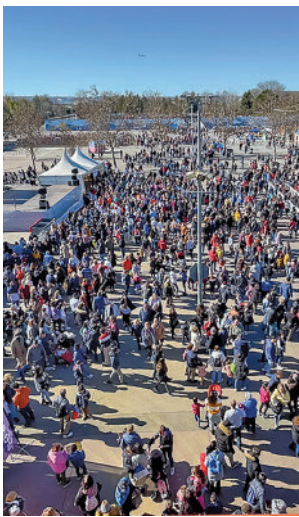
Imagen de la celebración