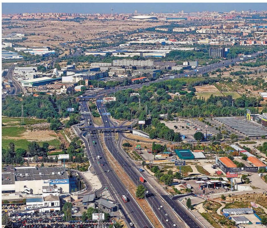
Autovía A-2 a su paso por Torrejón de Ardoz

El Ministerio de Transportes asegura que cada vehículo se ahorrará una media de 7,5 minutos en cada trayecto, que pueden aumentar hasta los 25 minutos si se hace el recorrido completo. El proyecto tiene un presupuesto estimado de 12,5 millones de euros, aportados a partes iguales por las diferentes administraciones implicadas, y establece cuatro puntos de acceso al carril en sentido Madrid, concretamente en Alcalá de Henares, Torrejón de Ardoz, San Fernando de Henares y Canillejas. Una vez