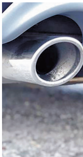
Tubo de escape E.P.

su vehículo es demasiado viejo (33%) o que quieren uno que sea más sostenible (30%), según la encuesta 'Consumer Spotlight' de Liberty Seguros. Además, una quinta parte de los encuestados (21%) también conside-