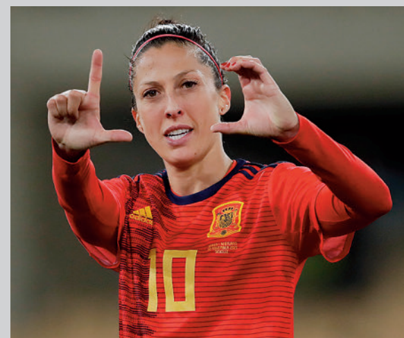
La delantera madrileña vuelve a la 'Roja'

Una circunstancia inesperada, el terremoto que ha asolado a Turquía y a Siria, ha provocado que el Real Madrid tenga más tiempo para preparar este encuentro, toda vez que su visita a la pista del Anadolu Efes se ha tenido que posponer. Por tanto, los blancos llegarán un poco más descansados al último partido de Liga previo a la Copa del Rey, un torneo donde debutarán el jueves (18:30 horas) ante el Valencia Basket. En caso de ganar, su rival en semifinales saldrá del ganador del Barça Unicaja, por lo que no habrá 'Clásico' en la gran final.