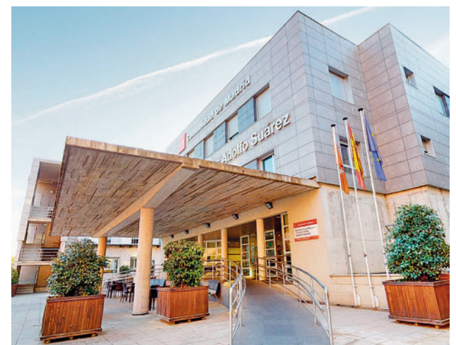
Una de las residencias de la Comunidad

Cada recorrido consta de 20 a 30 tomas fotográficas en 360°, interiores y exteriores. Las capturas realizan un barrido circular de los ambientes, libres de obstáculos y personas, para poder comprobar el estado real de las instalaciones y de los servicios ofrecidos en todos los centros. Se muestra desde el aspecto exterior del edificio hasta sitios menos accesibles como las cocinas.