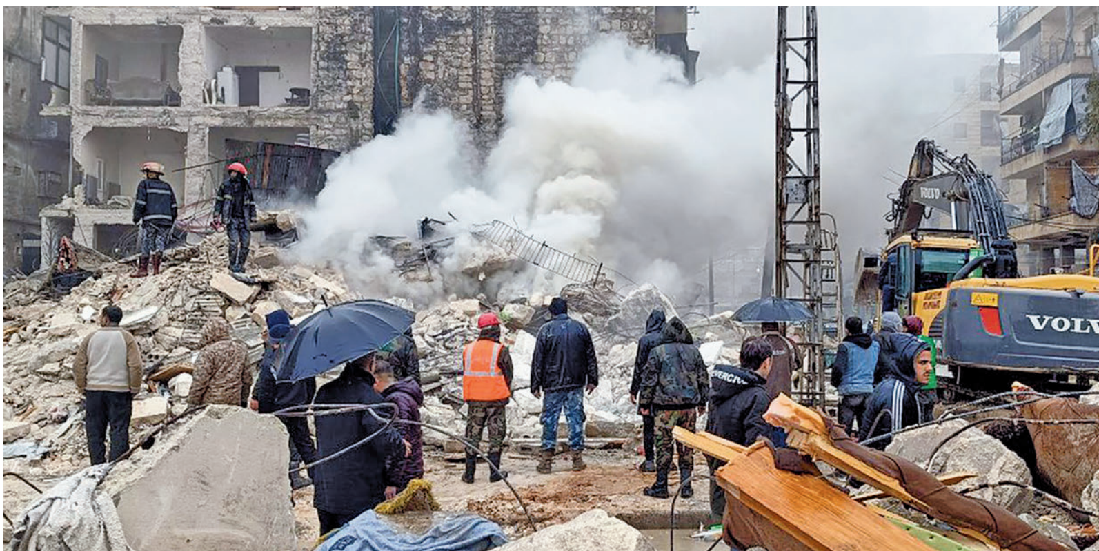
Edificios destruidos tras el terremoto de Turquía