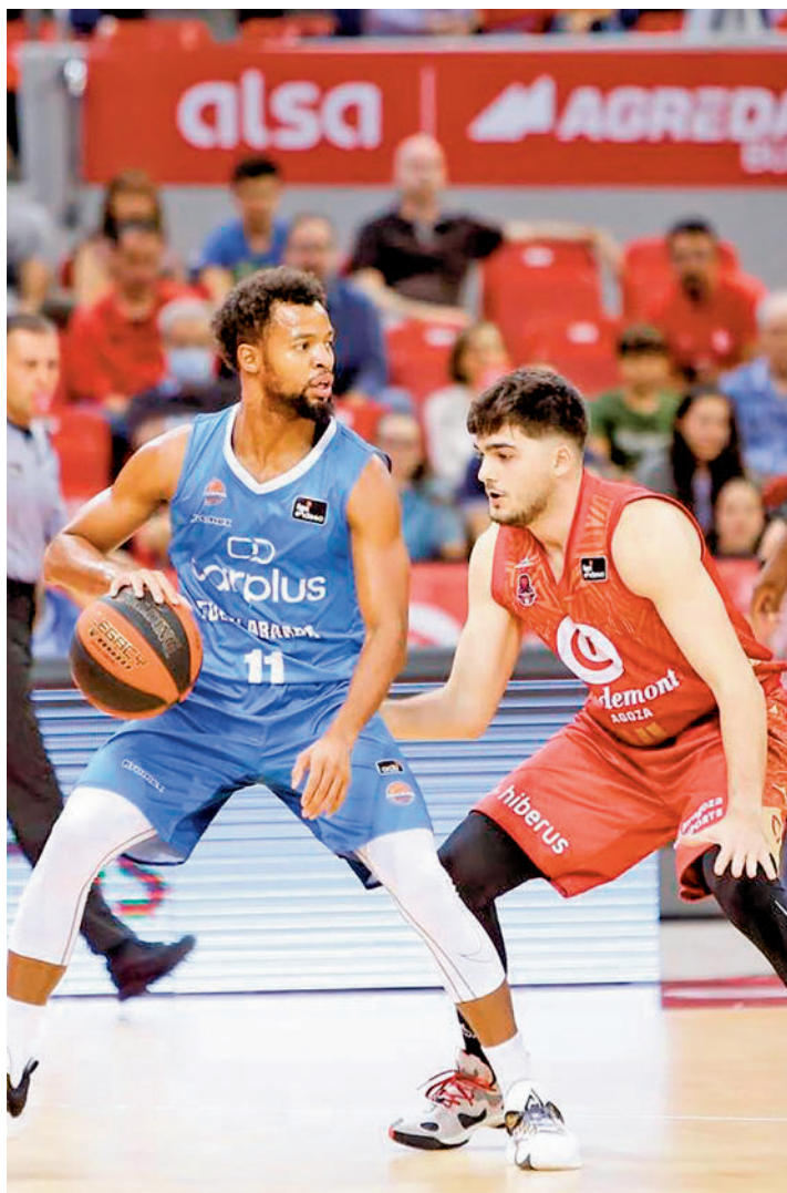
El Carplus Fuenlabrada continúa como colista