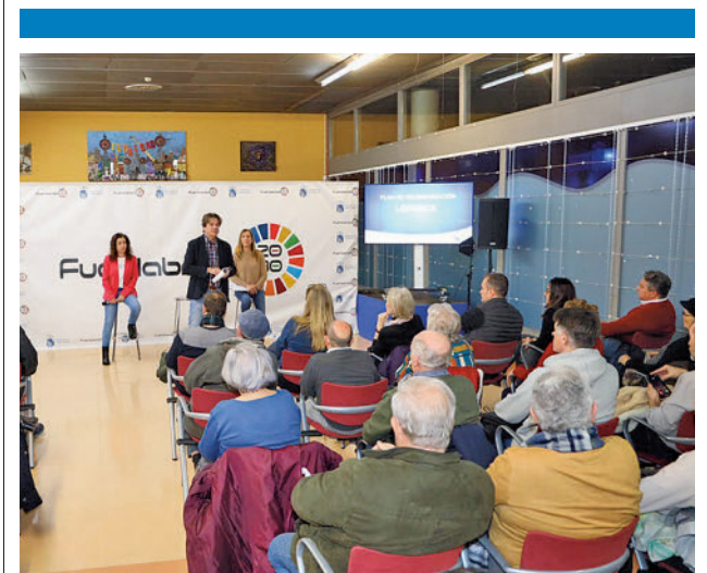
Presentación del plan a los vecinos

El hombre la emprendió a puñetazos contra un viajero y, a continuación, persiguió a una pareja, que intentó mediar en la pelea para evitar la agresión. La pareja, que resultó golpeada, denunció los hechos. Tras ser alertados, la Policía Nacional procedió a identificar al joven, sin proceder a su detención al tratarse de un delito leve de lesiones. La Policía puso los hechos en conocimiento de los juzgados.