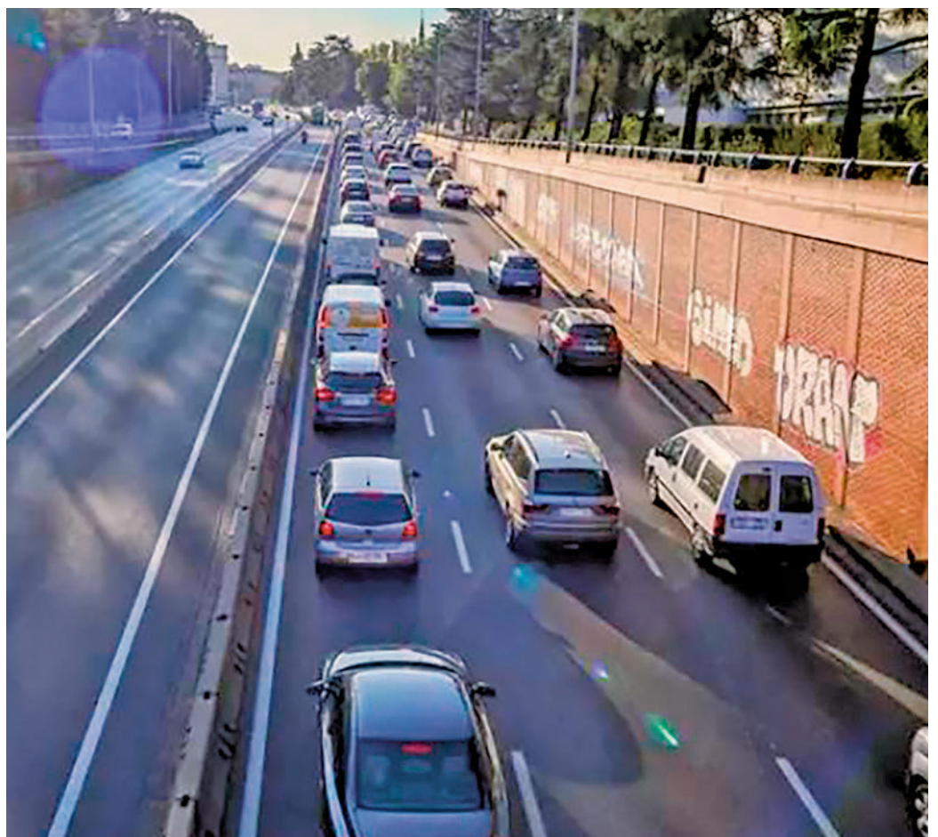
Atasco en una calle de Madrid

El manifiesto identifica cuatro grandes ámbitos de intervención: urbanismo, espacio público, intermodalidad y comunicación e incentivos. En primer lugar, abogan por generar cercanía, evitando así tener que depender del coche para los desplazamientos. De esta manera, se generaría un "urbanismo compacto", recuperando la "escala de barrio". Las entidades firmantes también apuestan por la recuperación de los espacios públicos, destinados hasta ahora al automóvil. Así, pasarían a ser lugares de encuentro, estancia, juego, paseo, socialización y práctica deportiva, restaurando la jerarquía viaria en las