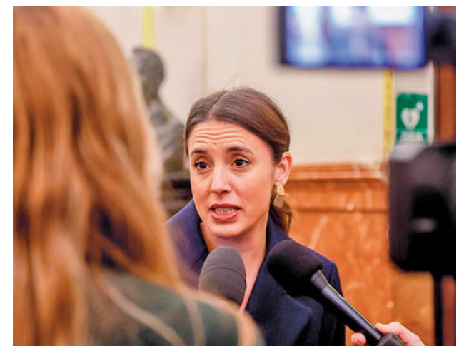
La ministra de Igualdad, Irene Montero

El texto socialista tendrá que pasar ahora por el trámite parlamentario, en el que podrá ser modificado. No obstante, lo más relevante es si Unidas Podemos acepta estos cambios en su propia ley o si se ensancha la brecha en el Gobierno.