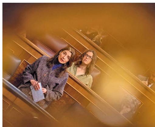
Pilar Llop, ministra de Justicia

EL PERIÓDICO GENTE NO SE RESPONSABILIZA NI SE IDENTIFICA CON LAS OPINIONES QUE SUS LECTORES Y COLABORADORES EXPONGAN EN SUS CARTAS Y ARTÍCULOS