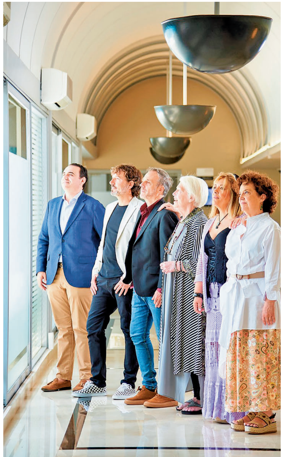
Foto de la formación actual que lidera Izaskun Uranga