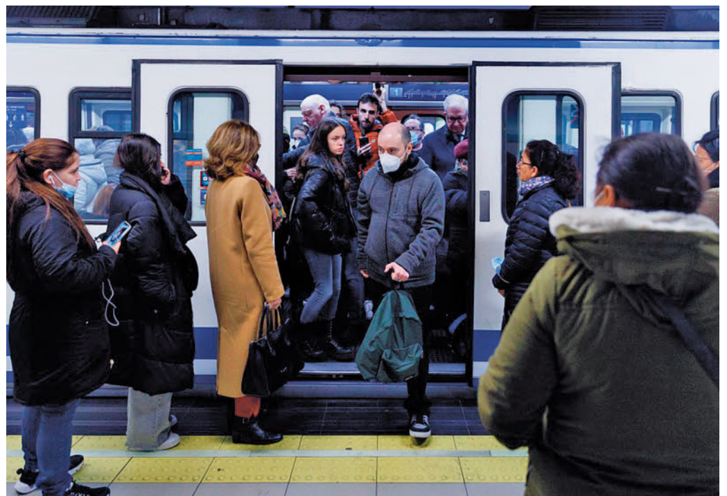
Mascarillas en los transportes públicos

La ministra puntualizó que el uso de las mascarillas va a seguir siendo recomendable en espacios cerrados para las personas más vulnerables, para aquellas con una infección respiratoria aguda o en los entornos familiares o sociales cuando haya personas con factores de riesgo. Tras su sa-