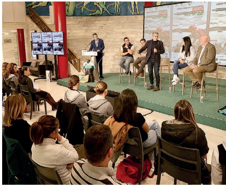
Presentación del Gran Premio Cantabria Deporte VII Trofeo Ciclismo Femenino Villa de Noja.

La prueba se celebrará en un único día de competición, pero en tres carreras separadas y con entrega de premios a seis categorías diferentes: élite y sub 23, junior, cadetes, máster30, máster40 y máster50. Además, habrá premios especiales de la montaña, metas volantes y sprint especial. La prueba tiene su inicio y final en Noja, recorriendo diferentes municipios de la zona oriental de Cantabria las villas de Castillo, Isla, Arnuero y Meruelo. El circuito es de 30 kilómetros, y en función de cada categoría se da-