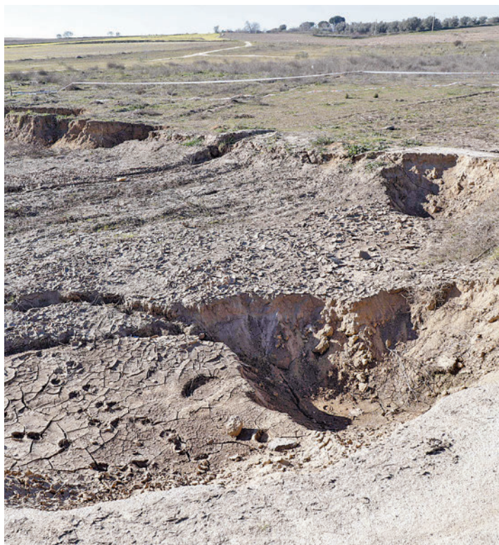
Algunas de las grietas que han aparecido