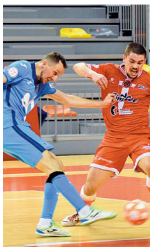
El Inter cayó en Cartagena

sión pasa por asegurar su billete para los 'play-offs' y hacerlo, además, en la mejor situación posible, aunque difícilmente contará con el factor