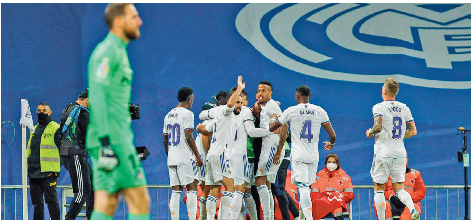
El año pasado el Real Madrid se impuso 2-0 con tantos de Benzema y Asensio