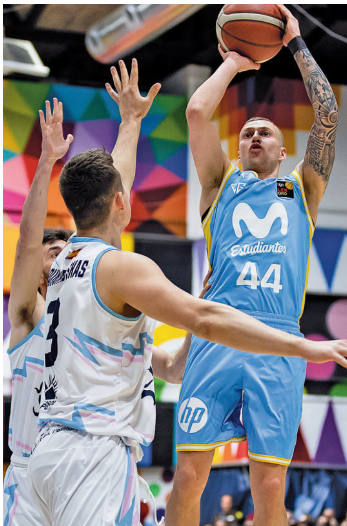
En la última jornada, el 'Estu' se impuso al Melilla MOVISTAR ESTUDIANTES

Lo cierto es que, aunque la primera plaza (la única que da billete directo para la ACB) está lejos, los números del 'Estu' son muy parejos a los que la pasada temporada le