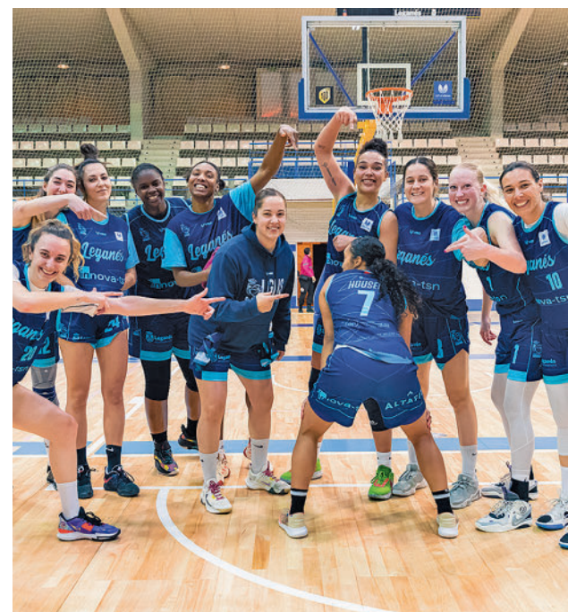
El Innova-tsn Leganés celebró su séptimo triunfo FEB

Precisamente estos dos equipos serán rivales del Estudiantes en la recta final de la fase regular. Concretamente visitará al MoraBanc Andorra el 1 de abril, mientras que la visita a la cancha del Zunder Palencia está programada para el 5 de mayo.