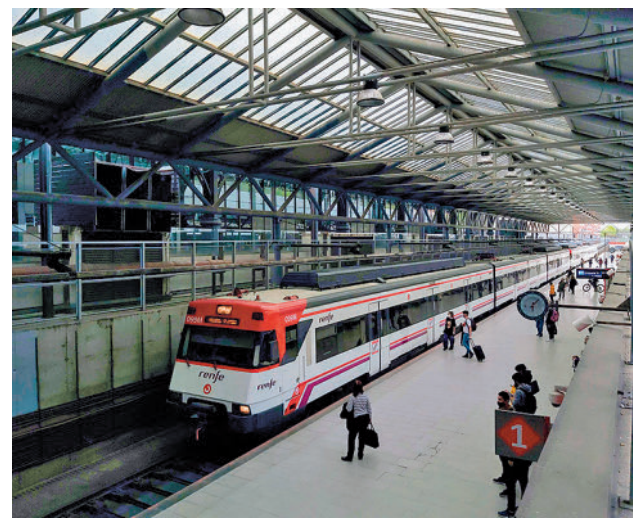
Estación de Cercanías de Príncipe Pío