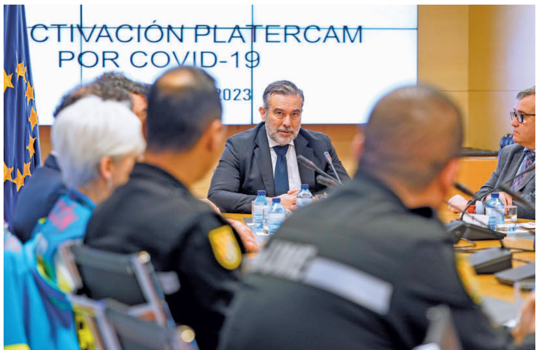
Reunión en la que se desactivó el Platercam

A partir de la segunda ola, en octubre de 2020, se coordinó