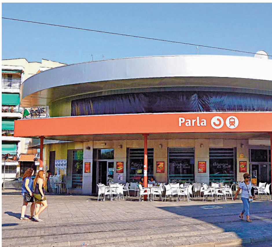
Estación de Cercanías de Parla