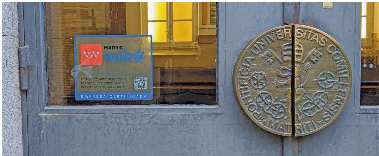
Fachada de la Universidad Pontificia Comillas ICAI- ICADE con el sello de Madrid Excelente