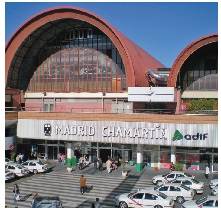
Estación de tren de Chamartín