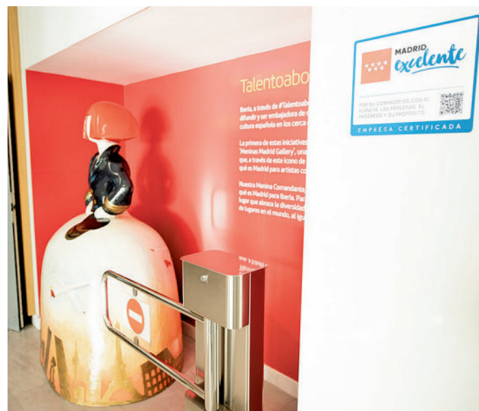
Iberia, otra de las empresas certificadas con este sello