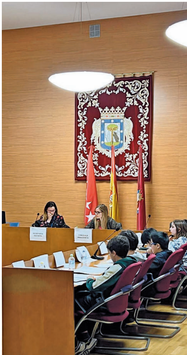
Un momento de la sesión infantil

En esta sesión extraordinaria participaron alumnos del Colegio Santa Catalina de Sena, de la Asociación Jaire y de los colegios públicos Isaac Albéniz y Patriarca Obispo