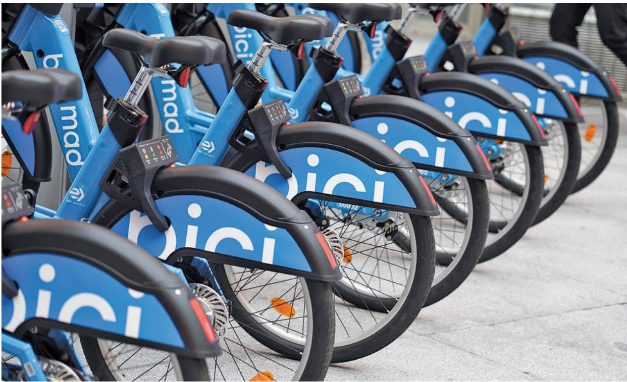
Algunos de los nuevos vehículos del servicio de alquiler de bicicletas