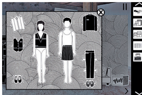
Una captura del videojuego 'VONA/SHE'

despertador, qué vas haciendo como ama de casa”. En palabras de la artista española, “dependiendo de las acciones que hagas, modificas el recorrido del juego. No tienes por qué hacer lo establecido, te puedes rebelar contra el patriarca-