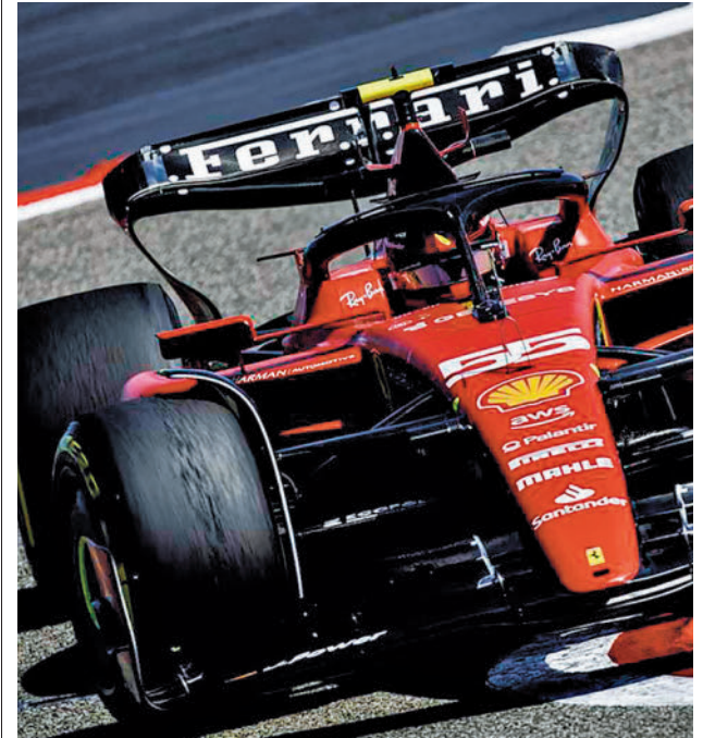
Carlos Sainz, durante la pretemporada

Para conocer si la historia se repite habrá que esperar a este domingo (16 horas).