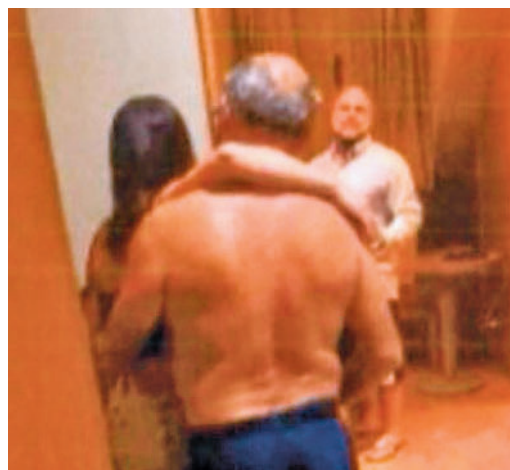
Una de las imágenes captadas del 'caso Mediator'

EL PERIÓDICO GENTE NO SE RESPONSABILIZA NI SE IDENTIFICA CON LAS OPINIONES QUE SUS LECTORES Y COLABORADORES EXPONGAN EN SUS CARTAS Y ARTÍCULOS