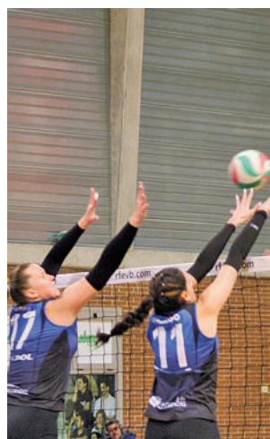
Cita clave para Depol Feel

Alcobendas está cerca de sellar la permanencia, un objetivo que aseguraría en el caso de imponerse este sábado a las 19:30 horas en su visita a