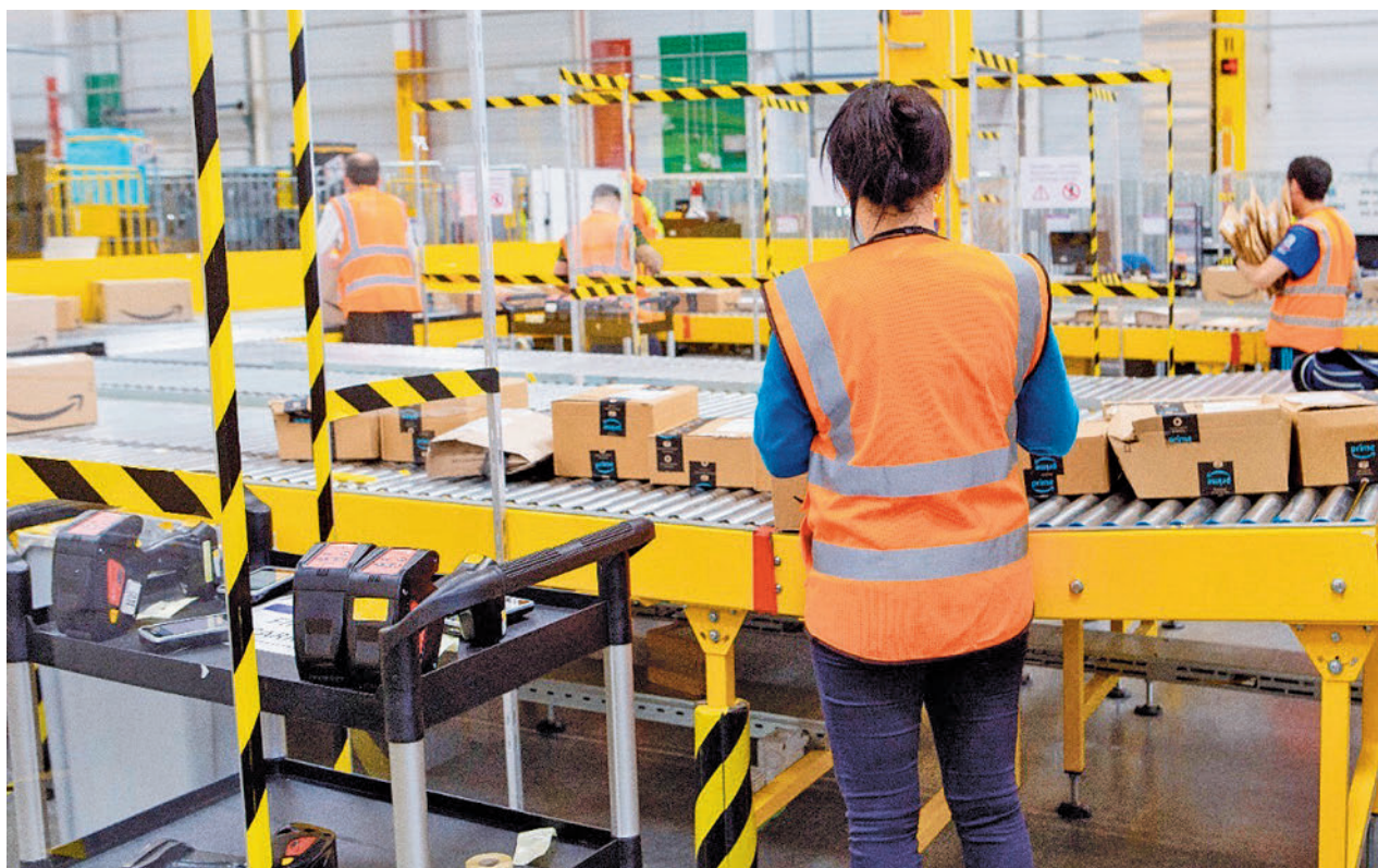
El sector de logística, uno de los que ofrece más puestos vacantes

En el caso de la logística y el transporte se necesitan, sobre todo, operarios con manejo de maquinaria, conduc-