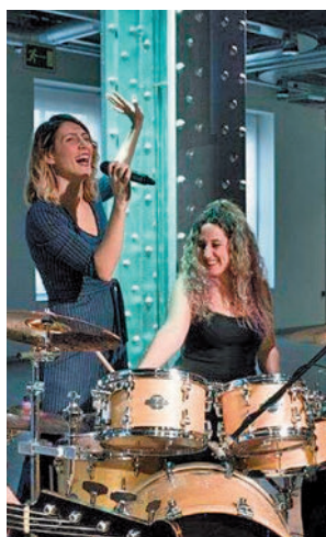
Unos de los conciertos

levantes. A través de 'Educa-Pop', los estudiantes de Educación Primaria y Secundaria de Barajas pueden poner en el valor el papel de las mujeres en la historia, a ritmo de la música y de El Club de las Chicas Intrépidas.