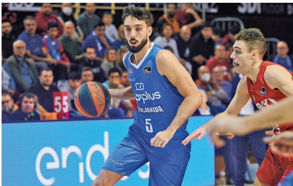
Imagen del partido de ida que se saldó con triunfo fuenlabreño (101-97)