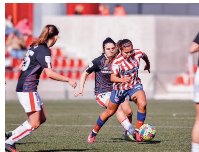
El Atlético de Madrid visita a la Real Sociedad

te, el otro equipo que está en puestos de descenso, el Alhama, también se verá las caras con un equipo de la capital. El Real Madrid de Alberto Toril juega a domicilio este sábado (18:15 horas) con la ilusión de meter algo de presión al líder, el Barcelona, que sigue contando todos sus partidos por victorias antes de recibir al Villarreal.