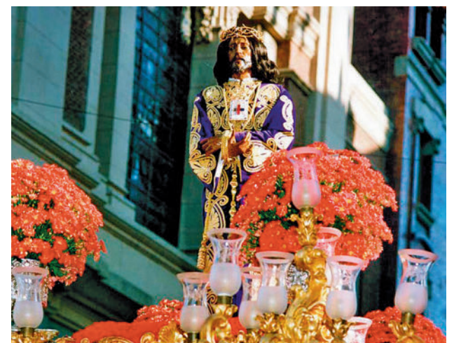
La procesión del Cristo de Medinaceli

Además, se distribuirá un mapa ilustrado con los recorridos de las procesiones desde cada una de las iglesias.