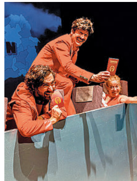
Yllana en 'Passport'

» Sábado 4, 20 horas. Auditorio Municipal. 4-6 euros.