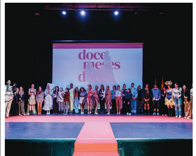
Foto de familia de todos los participantes

gentedigital.es Toda la actualidad de los distritos de Madrid, en nuestra web