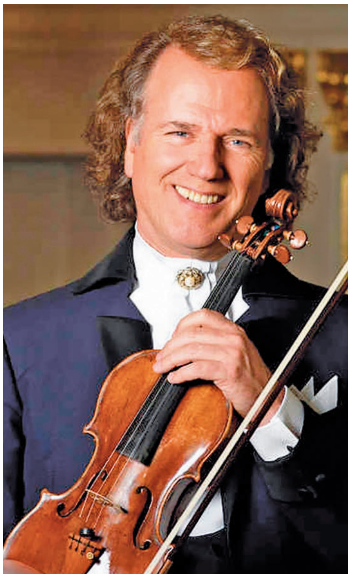
André Rieu, en una foto de archivo

Esa comunión se reflejará en un recital para el que vaticina "una una noche maravillosa llena de música maravillosa". "Entretendremos al pú-