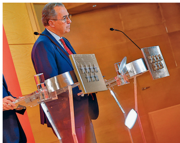
Rueda de prensa posterior al Consejo de Gobierno

Aquellas inversiones que supongan la generación de más