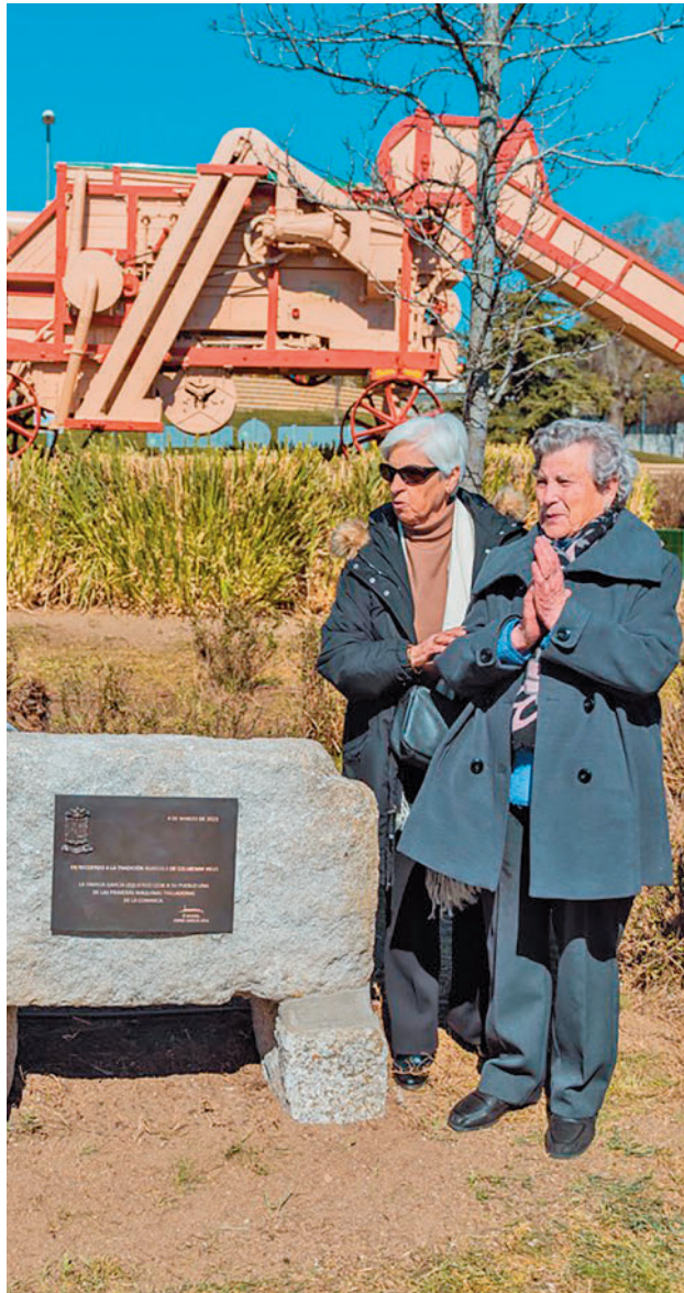
Un monolito incluye una placa en homenaje a la familia

Pues bien, esta máquina ya forma parte del paisaje de Colmenar Viejo. El pasado sábado 4 de marzo se celebró un acto en la glorieta del Paseo de la Estación, donde ya está instalada esta trilladora, donada por la familia