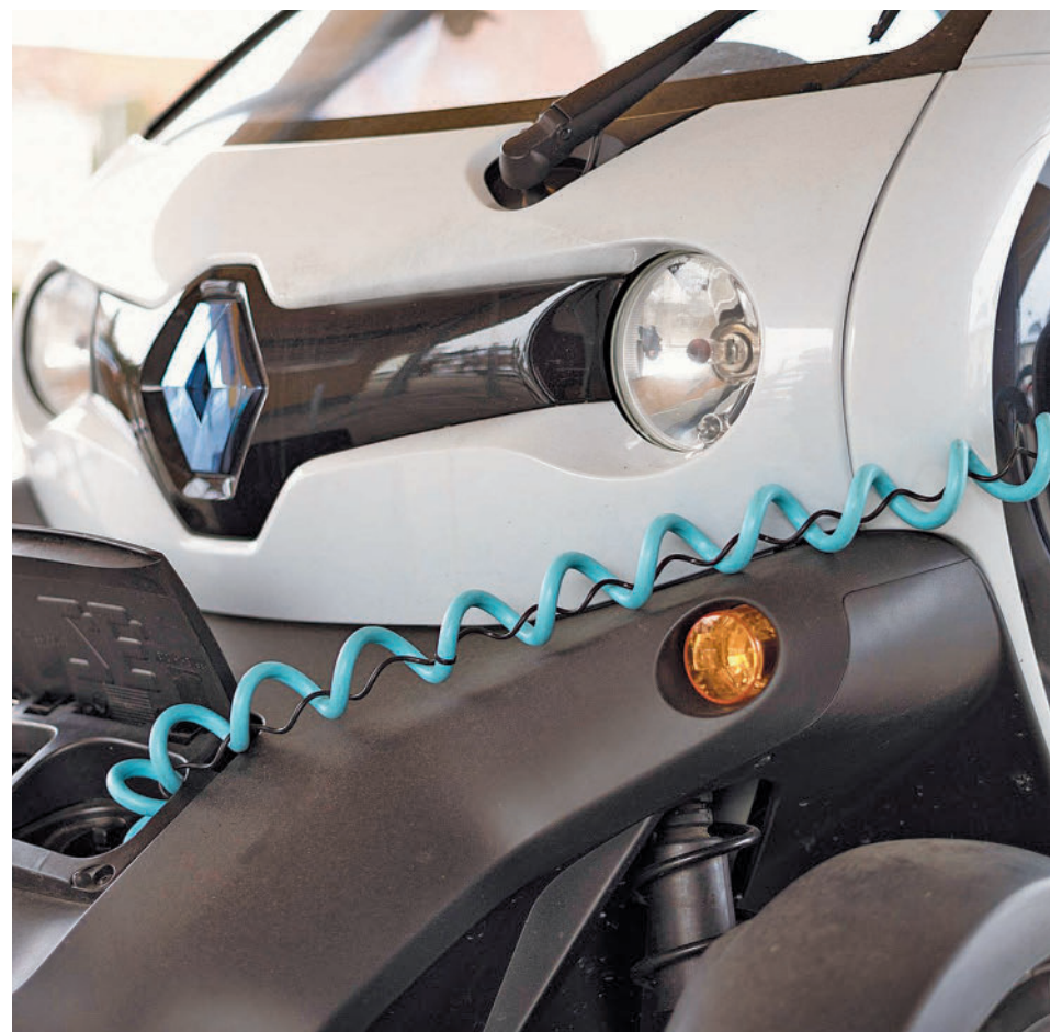
Todas las comunidades aumentaron en 2022 las matriculaciones de eléctricos

Por comunidades autónomas el reparto sigue siendo desigual, siendo Madrid la región que más vehículos eléctricos matriculó (35.977), acaparando casi la mitad del total (45,4%). Esta cifra supone un incremento de casi un 12% con respecto al año 2021, año en el que se vendieron 32.149 vehículos. Aunque, como informan desde Emovili, empresa de movilidad eléctrica y energía solar fotovoltaica, han crecido todas las matriculaciones de híbridos y eléctricos en todos los territorios. Tras Madrid, Cataluña ha sido la segunda que más ventas ha registrado, con 12.017, 2.187 más que en 2021. La tercera en la clasificación es la Comunidad Valenciana, que con 1.218 más, en 2022 matriculó 6.230 vehículos de esta tecnología. También destaca Aragón, que incrementó las matriculaciones en un