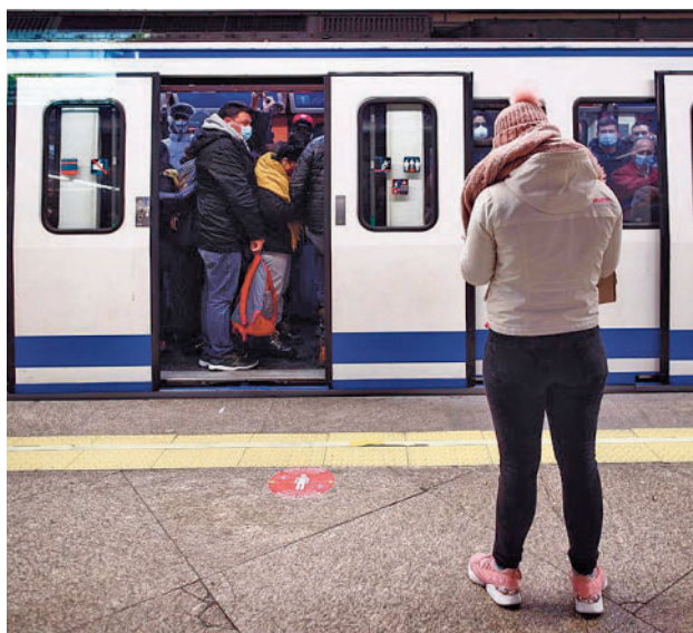
Metro de Madrid