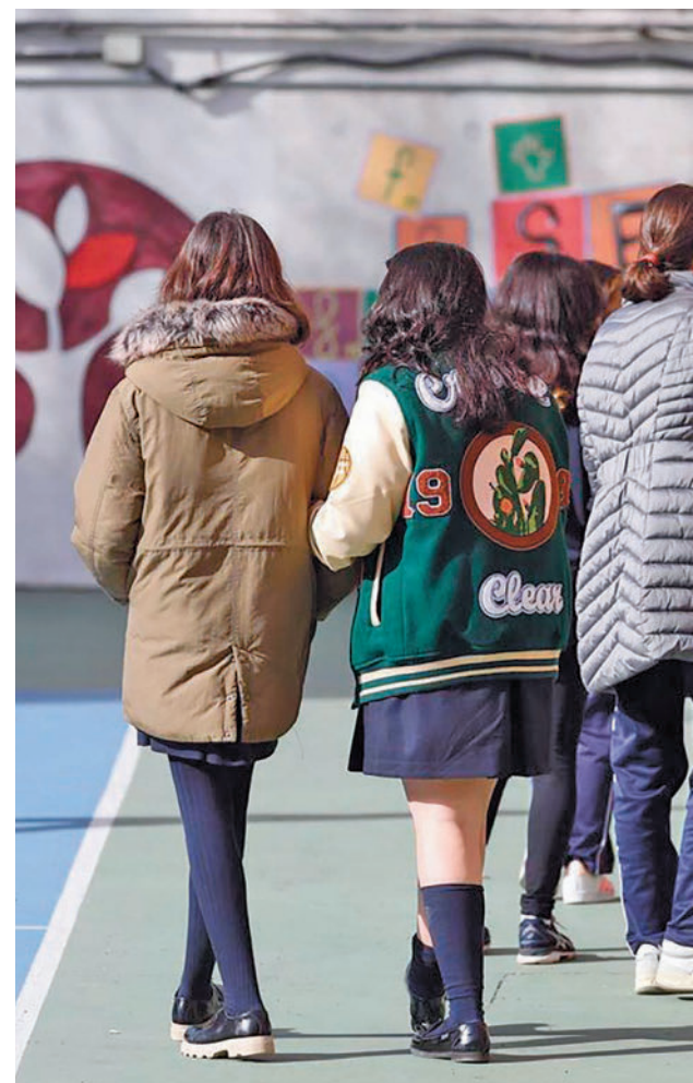
Colegio público de la Comunidad de Madrid

colares. El objetivo es "que ningún alumno deje de visitar museos, ir al teatro, participar en excursiones o aprender un instrumento por falta de recursos económicos". Ambas medidas costarán 12 millones de euros