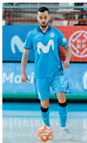
Nueva cita en casa

mera División de fútbol sala con la celebración de la jornada 22 de la fase regular. En ella, el Inter Movistar jugará como local. Su rival será el