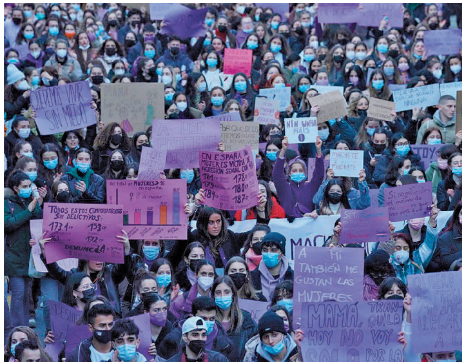
Dos marchas multitudinarias: La unidad había sido la nota predominante en la celebración del Día de la Mujer desde los años 70. Sin embargo, cuestiones como la Ley Trans o la lucha contra la prostitución han abierto una brecha en los últimos años que todavía no se ha podido cerrar.

Feminista de Madrid a convocar una marcha alternativa, que salió media hora antes y a solo unos metros de distancia, en la glorieta de Carlos V. Tras una pancarta bajo el lema 'Feministas en lucha por los derechos de las mujeres', las manifestantes comenzaron a marchar entre cánticos como 'El feminismo es abolicionista', 'Ser mujer no es un sentimiento', 'Irene machista, hazte feminista', 'La infancia ni se toca ni se hormona' o 'Las mujeres no tienen pene' y portando carteles en los que se pueden leer mensajes como: 'Putero al caldero' o 'Montero dimisión'.