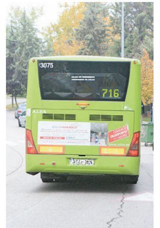
Autobús de la Línea 716

Con el cambio, todas las expediciones de la línea 716 entrarán en Soto de Viñuelas, cuando hasta la fecha solo lo hacían de forma alterna. Además, lo hacían con una frecuencia de 40 minutos en horas valle y, con la modificación de las expediciones ahora lo harán cada 20 minutos. Por otro lado, también se ha ampliado el itinerario de la