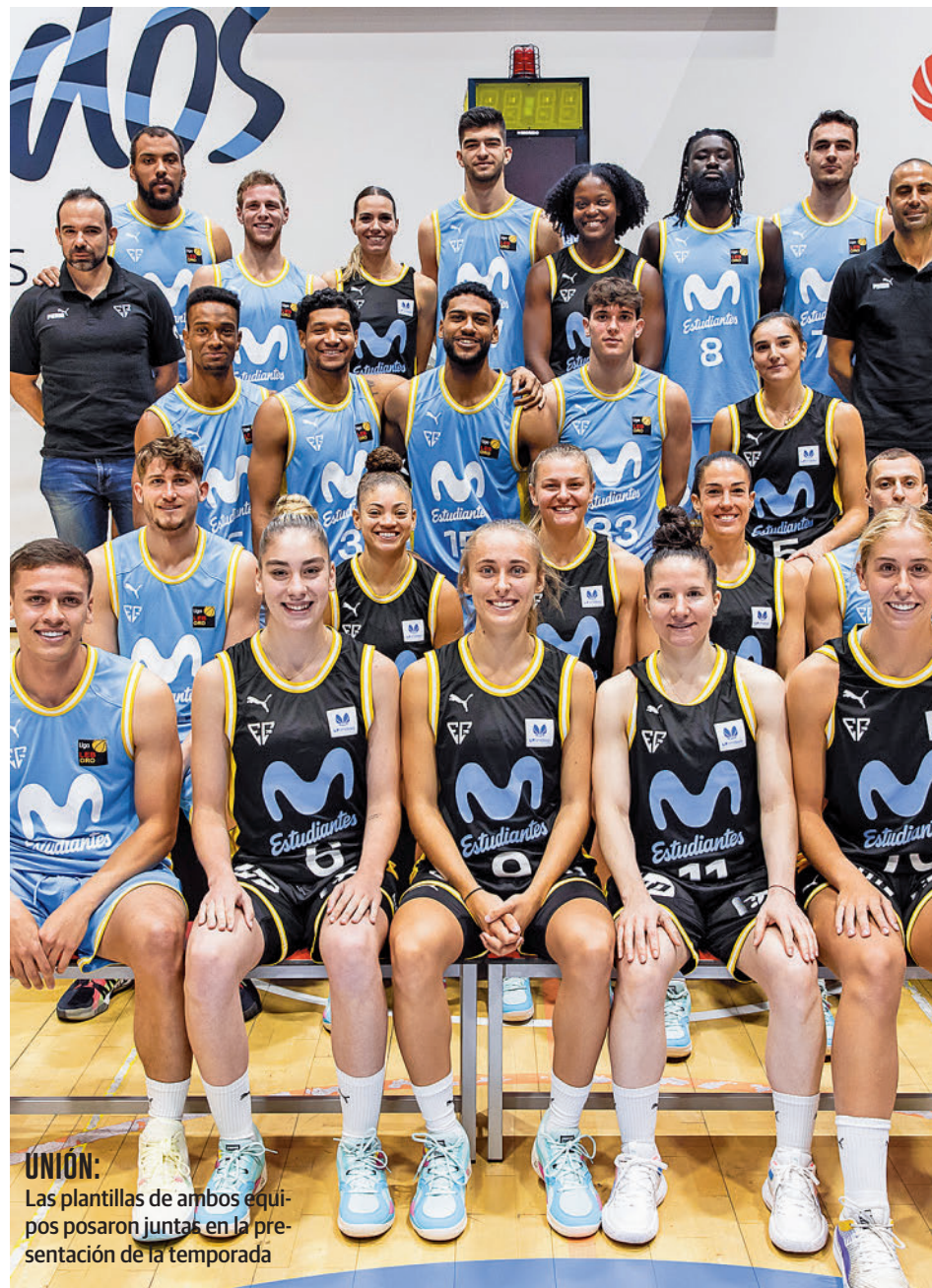
UNIÓN: Las plantillas de ambos equipos posaron juntas en la presentación de la temporada