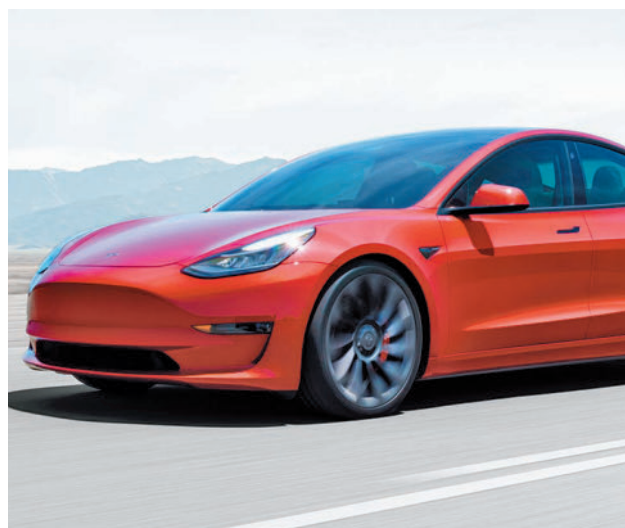
Tesla Model Y: Este modelo de eléctrico fue el más vendido en España en el año 2022 con 2.676 unidades. Le siguen el Fiat 500 con 1.867; el Tesla Model Y, con 1.866; el Kia Niro con 1.517; y cierra la clasificación el modelo ë-C4 de Citroën con 1.442 unidades.

En el segmento de híbridos enchufables, es Mercedes quien se hace con un mayor porcentaje de las nuevas matriculaciones realizadas con un 14% en 2022, año en el que se contabilizaron un total de 47.797 ventas.