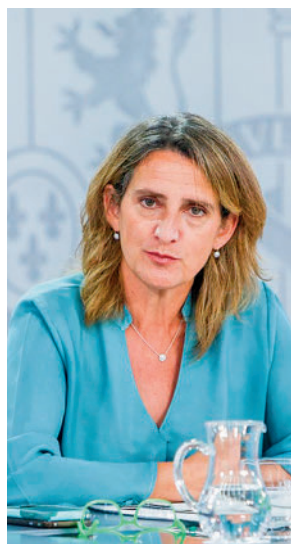
La ministra Teresa Ribera

cuya convocatoria han lanzado de manera conjunta los Ministerios para la Transición Ecológica y Reto Demográfico y el de Transportes, Movilidad y Agenda Urbana. La presentación de candidaturas comenzó el pa-