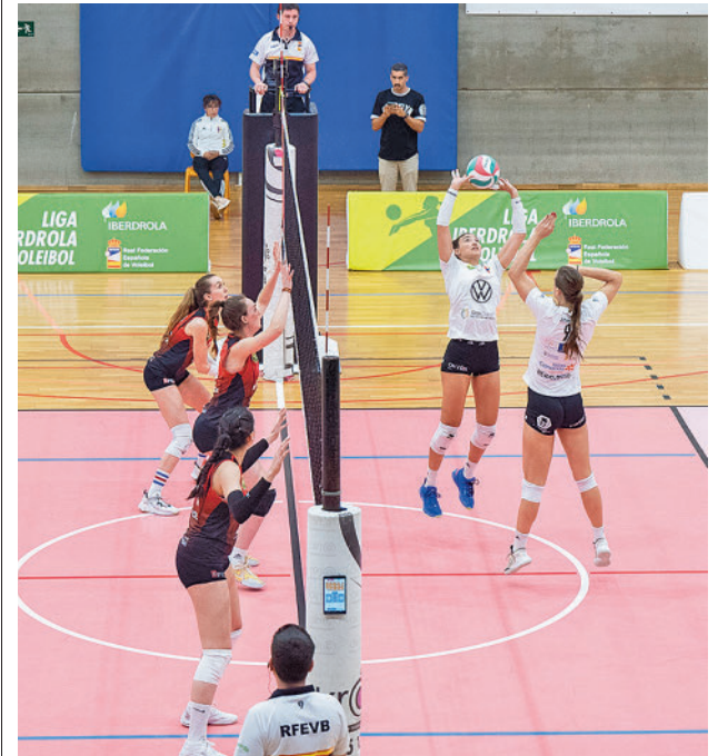
Triunfo clave del Alcobendas en Canarias