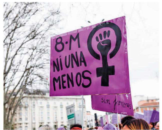
Manifestación del 8M en Madrid