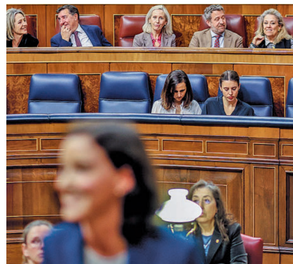
La ministra de Igualdad, Irene Montero

La propuesta del PSOE mantiene la redacción de los dos primeros puntos redactados por Igualdad, que señalan que "sólo se entenderá que hay consentimiento cuando se haya manifestado libremente mediante actos que, en atención a las circunstancias del caso, expresen de manera clara la voluntad de la persona" y que "se consideran en todo caso agresión sexual