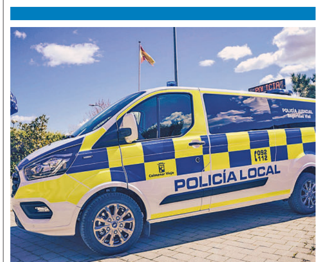
Vehículo de la Policía Local de Colmenar

Este es solo un ejemplo de la actividad desarrollada en estos diez años de vida, con campañas como La Ruta de la Cuchara, Moda Belleza y Salud, Gastronomía Internacional, Las Ópticas Asociadas o La Vuelta al Cole, sin olvidar citas anuales como Los Premios Empresariales o La Maratón Financiera y Las Jornadas por el Empleo.