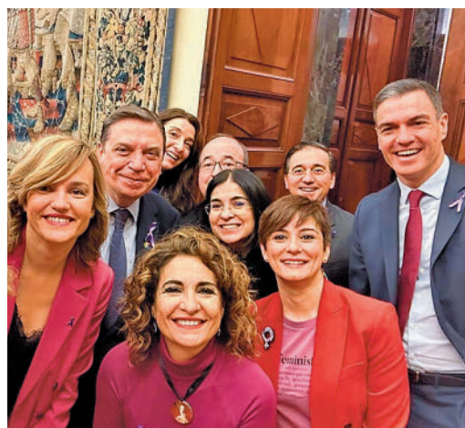
'Selfi' del Gobierno por el 8-M, sin Podemos

EL PERIÓDICO GENTE NO SE RESPONSABILIZA NI SE IDENTIFICA CON LAS OPINIONES QUE SUS LECTORES Y COLABORADORES EXPONGAN EN SUS CARTAS Y ARTÍCULOS