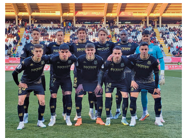
Once inicial del Alcorcón en el Reino de León

Respecto a los otros equipos madrileños, el Fuenlabrada visita al Linares, y Rayo Majadahonda y Sanse recibirán a Cultural y Celta B.