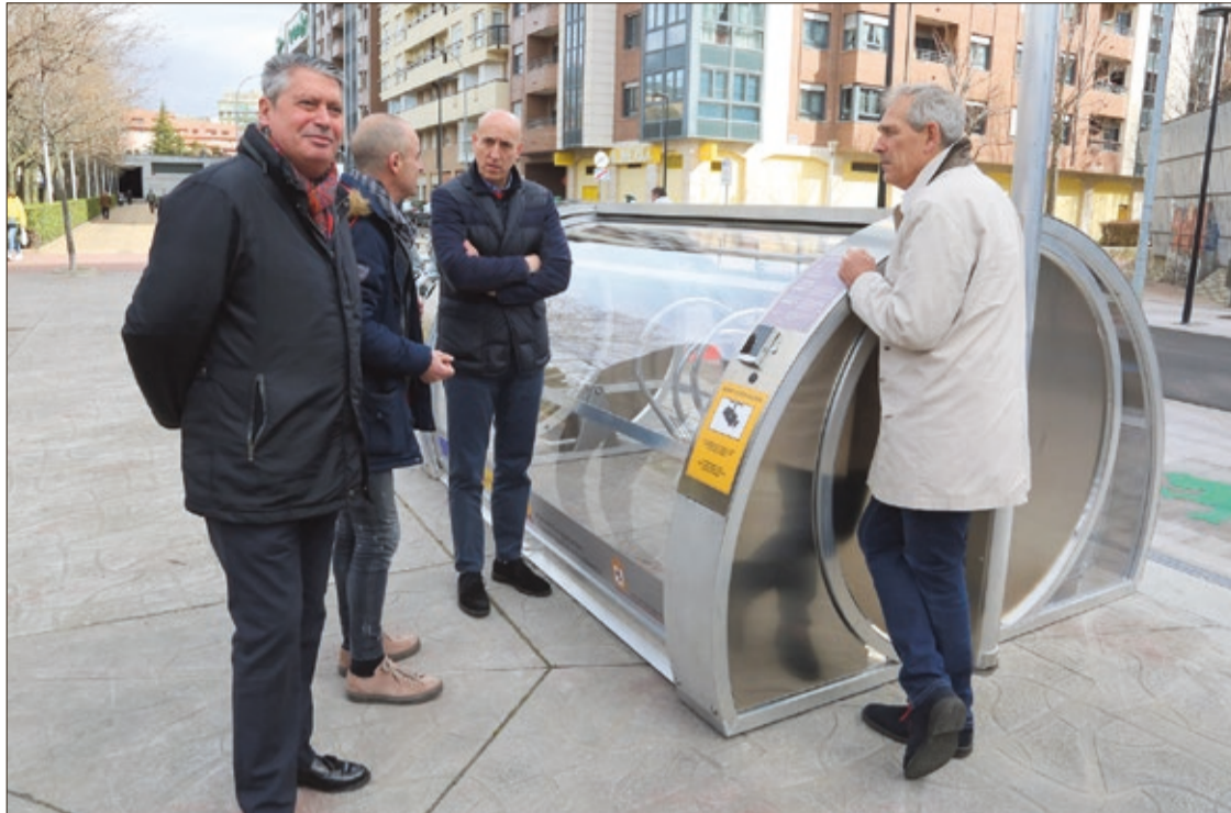
El alcalde de León visitó uno de los nuevos estacionamientos seguros para bicicletas, el ubicado en la calle Santos Olivera.