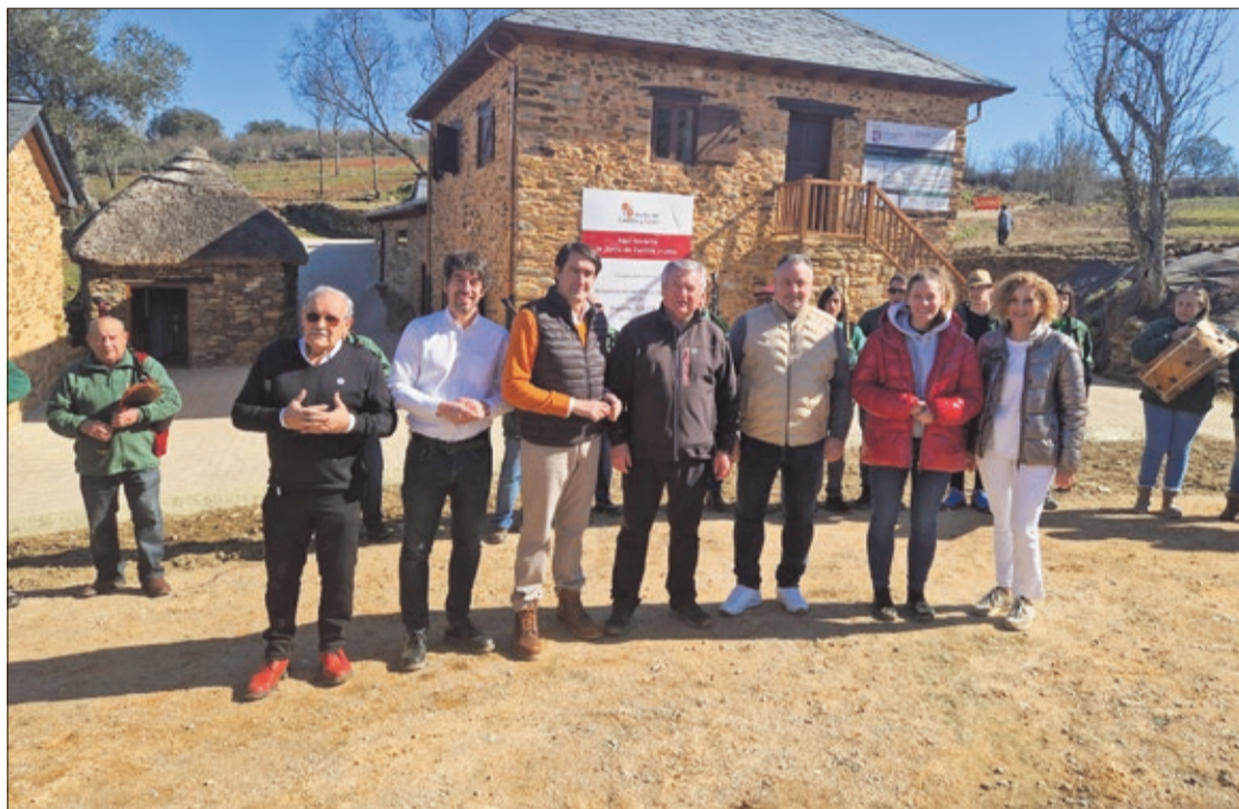
En la visita al pueblo participaron representantes de la Diputación, de la Junta, del Ayuntamiento y empresarios como Prada 'A Tope'.

En concreto, el proyecto corresponde a la tercera fase de un plan de amplio alcance con el que este municipio del Bierzo Bajo está rescatando del olvido una aldea enclavada en un espacio de gran valor natural, cuyos últimos vecinos salieron de sus casas en el año 1971. Peón de Arriba se ha convertido en una auténtica ecoaldea sostenible gracias a todas las labores de restauración de los espacios adquiridos por el Ayuntamiento -realizadas con respeto a las técnicas y materiales tradicionales-, a la creación de un completo albergue turístico en