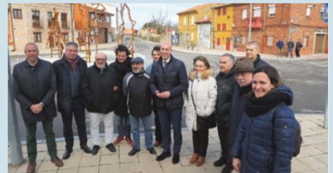
Presentación de la escultura La Laguna en la plaza de España de Armunia.