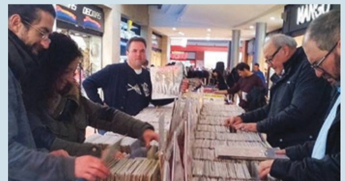
La feria se ha convertido en un lugar imprescindible para los coleccionistas.