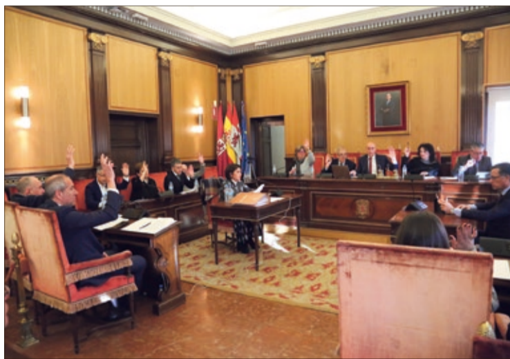
El Ayuntamiento de León celebró el 3 de marzo dos plenos, el ordinario y otro extraordinario.