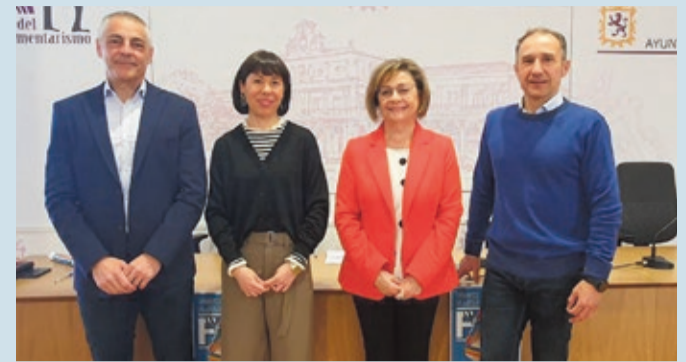
Presentación de la Feria de Editores Emergentes en el Ayuntamiento de León.