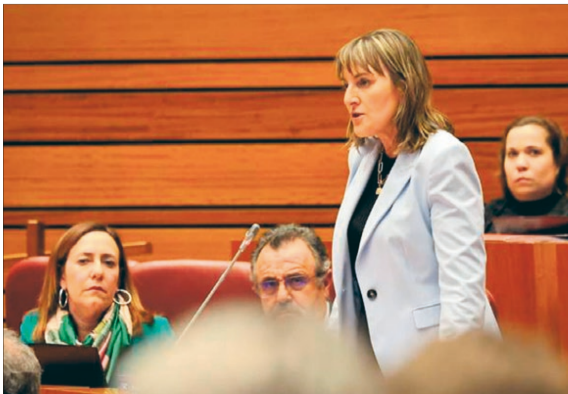
Intervención de la procuradora socialista Yolanda Sacristán durante el pleno de las Cortes de Castilla y León.

Sacristán se refirió a centros educativos especiales, escuelas infantiles, centros de Educación Infantil y Primaria, y de Institutos de Educación Secundaria, con menores que en muchos casos no pueden ser atendidos con la diligencia que requieren debido a la falta de profesionales y la no cobertura de las bajas por enfermedad y vacantes.