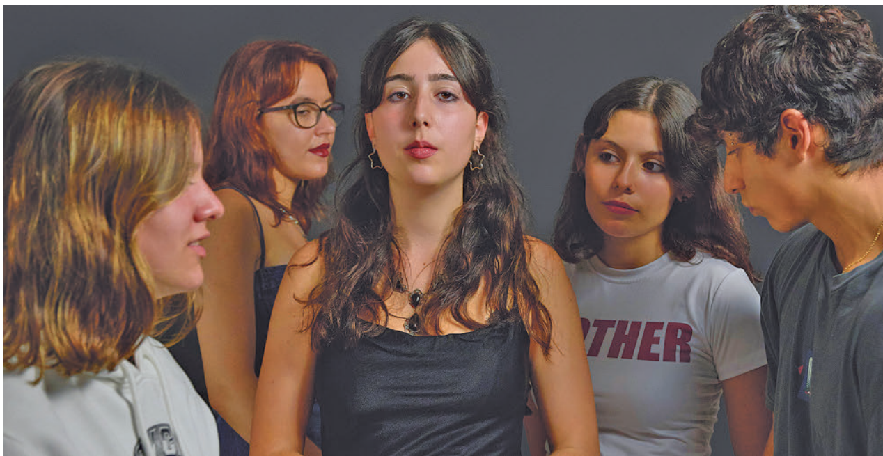
La banda tiene su origen en Pontevedra

» T. Adolfo Marsillach. Sábado 25, 20 horas. Precio: 18 euros.