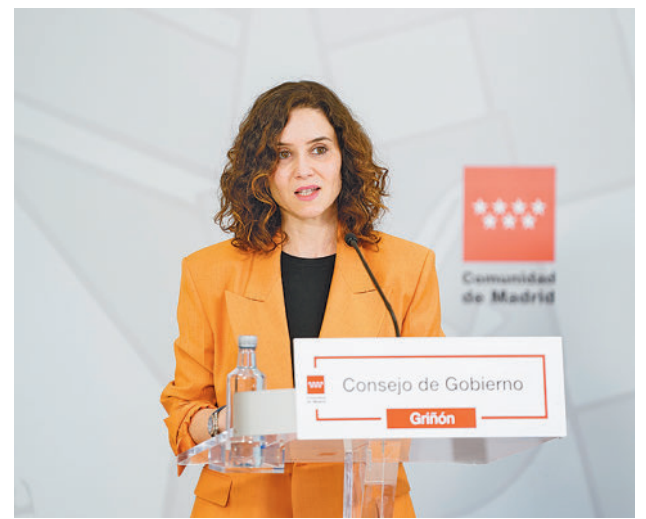
El anuncio se hizo tras el Consejo de Gobierno