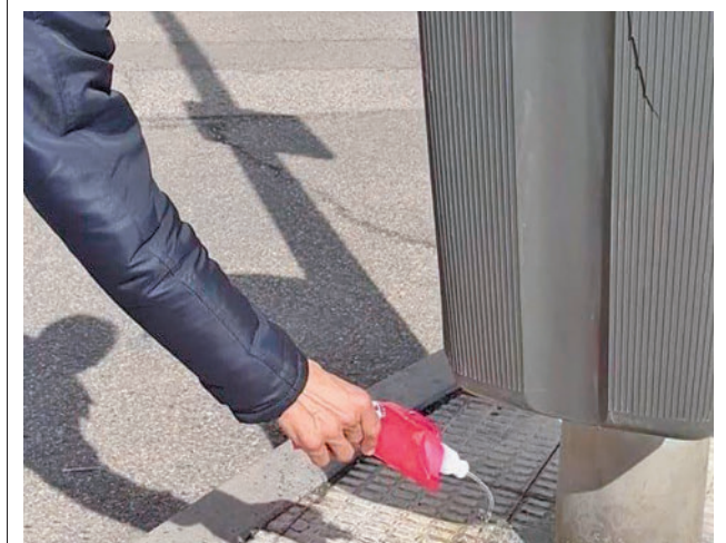
Una de las botellas que se regalan

El Gobierno local quiere con la adhesión a esta iniciativa demostrar su “implicación con el medio ambiente” y “con la lucha contra el cambio climático”. Durante la última edición participaron más de 500 ciudades en esta acción de “visibilización y concienciación” sobre lo que cada uno puede aportar a la “sostenibilidad del entorno y a la salud”.