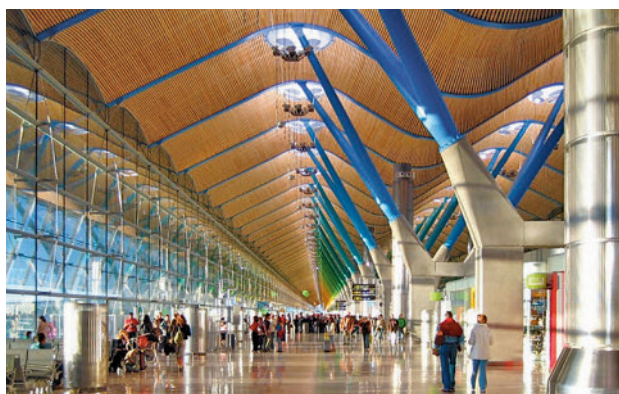
Aeropuerto Adolfo Suárez Madrid-Barajas

La lista de los diez mejores aeropuertos del mundo, en este listado que premia la satisfacción de los usuarios en las instalaciones aeroportuarias mundiales, la encabezan el aeropuerto de Singapur, seguido del de Doha (Catar), Tokio Haneda (Japón), Seul Incheon (Corea del Sur), Pa-