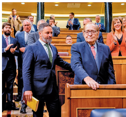
Abascal junto a Tamames

EL PERIÓDICO GENTE NO SE RESPONSABILIZA NI SE IDENTIFICA CON LAS OPINIONES QUE SUS LECTORES Y COLABORADORES EXPONGAN EN SUS CARTAS Y ARTÍCULOS