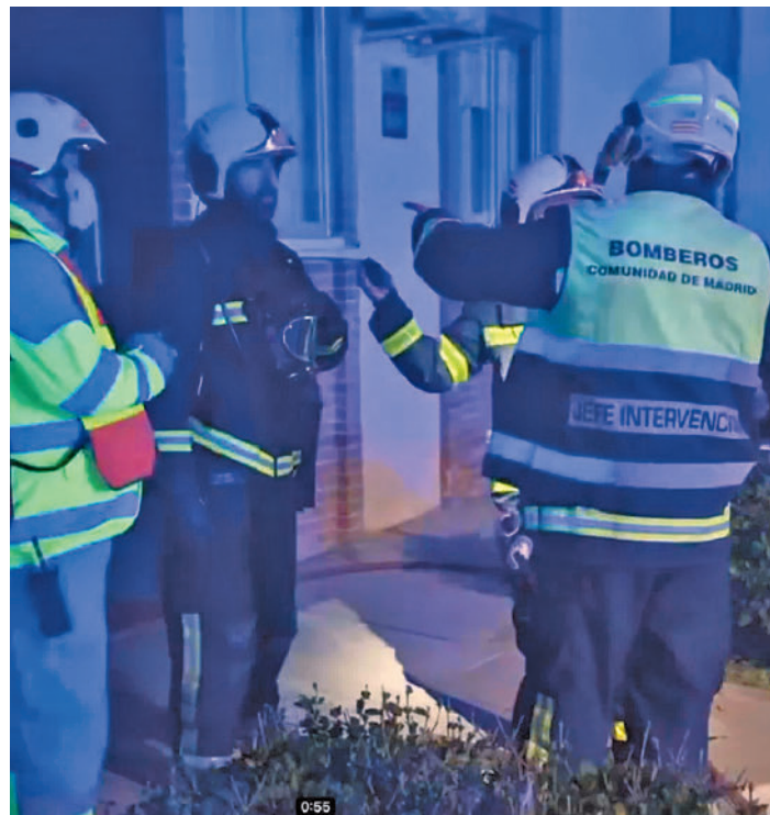
Actuación de los Bomberos en Pinto

El incendio se produjo en torno a las 20 horas del jueves 16 en el edificio número 3 de la calle Colombia, que consta de cinco plantas. Los bomberos se encontraron la vivienda ubicada en la planta baja prácticamente ardiendo en su totalidad. En el interior pudieron rescatar a un varón de 62 años que se en-