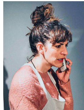
'La panadera', en Colmenar

» Auditorio Municipal. Sábado 25, 20 horas. Precio: 12-15 euros.