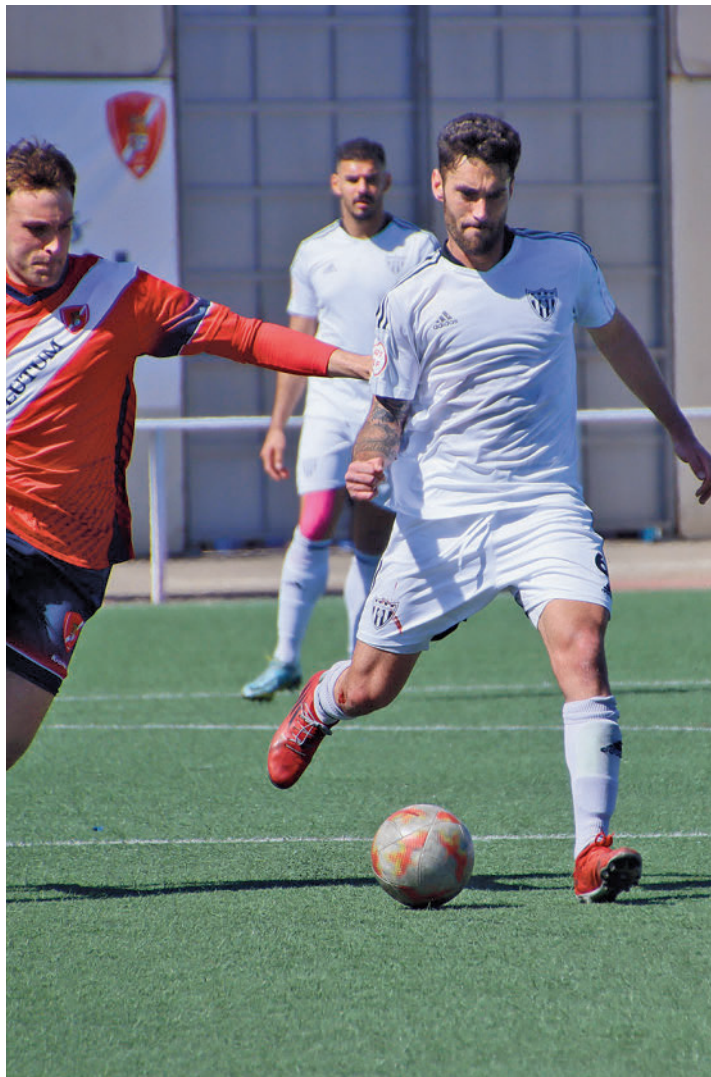
Triunfo vital del Canillas en Torrejón MARÍA BLANCO / CD CANILLAS

Para comprobar si este traspies ha afectado a la confianza del Ursaria solo habrá que esperar hasta este domingo 26 (12 horas), cuando el todavía líder de la competición visite el Valle de las Cañas. Allí le espera un Pozuelo