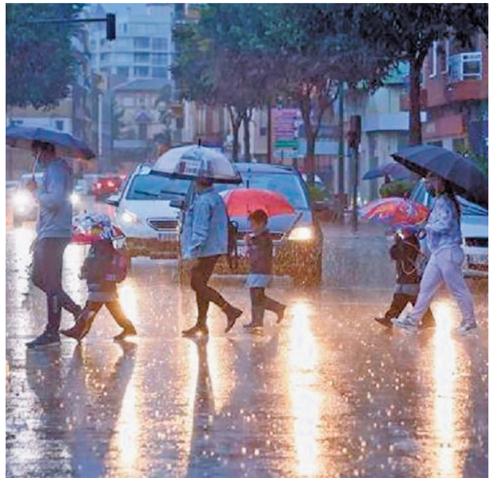
Las precipitaciones no han tenido el protagonismo esperado este invierno

los ríos Miño, Duero, Guadiana y Guadalquivir). Mientras, en la mediterránea las precipitaciones serán más escasas. Si esto es así, se agravaría la situación en zonas con pocas reservas hídricas, como la del río Segura (36,05%). La cuenca del Ebro, aunque se encuentra a una capacidad del 58,73%, podría verse también afectada por esta situa-