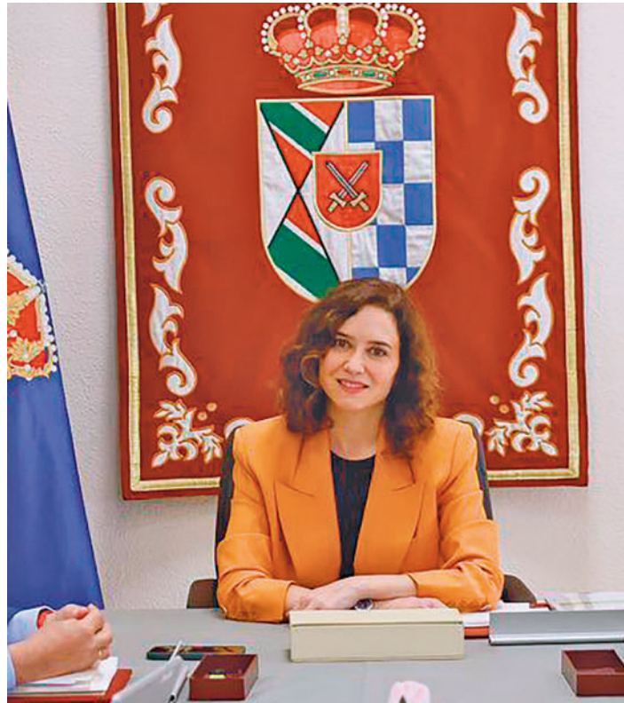
Díaz Ayuso lo anunció tras el Consejo de Gobierno celebrado en Griñón

Las destinadas a niños de 0-3 años tendrán un presupuesto de 50,6 millones y podrán alcanzar a alrededor de 34.000 familias. Oscilan entre los 1.463 y los 2.343 euros anuales en función de la renta y favorecerán fundamentalmente cuando trabajen ambos cónyuges. Esta iniciativa va dirigida a niños que hayan nacido o esté previsto su nacimiento antes del 1 de