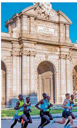
Edición de 2018

en el deporte madrileño desde hace tiempo. La razón, la celebración de una nueva edición del Medio Maratón de Madrid, una prueba que se