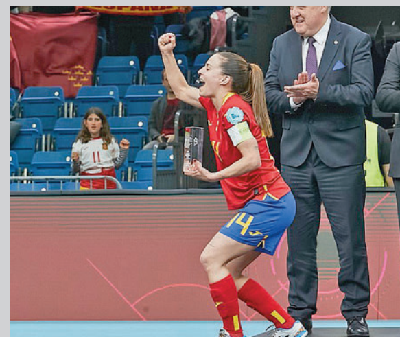
La jugadora madrileña, con el trofeo de MVP RFEF

Precisamente el equipo serrano es uno de los que está implicado en la lucha por evitar el descenso a Preferente. Con el Aranjuez casi desahuciado y el Fuenlabrada Promesas algo descolgado, las miradas se centran en el Canillas, tercero por la cola, que el pasado domingo daba la campanada en Torrejón al imponerse por 0-1, metiendo en problemas a su rival y reduciendo su desventaja respecto a los puestos de salvación a dos puntos. Esta jornada (domingo, 11:30 horas) el Canillas vuelve a su feudo para recibir al Paracuellos Antamira, sin perder de vista el duelo directo entre el Collado Villalba y el Torrejón y la visita del Galapagar al campo del Aranjuez.