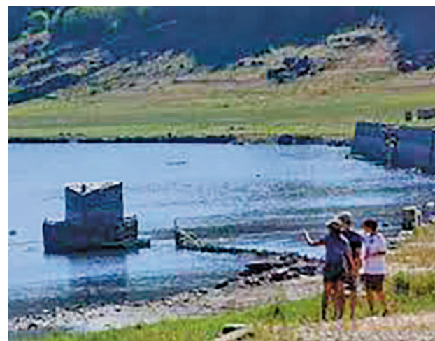
Larga duración: España ha entrado de manera oficial en una sequía de larga duración tras tres años de déficit de lluvias. Las cuencas de acumulación más afectadas son las del Guadalquivir, Sur y pirineo oriental. Si esto continúa, se darán cortes en el suministro.

DE LAS DIEZ ÚLTIMAS PRIMAVERAS, SÓLO TRES FUERON FRÍAS