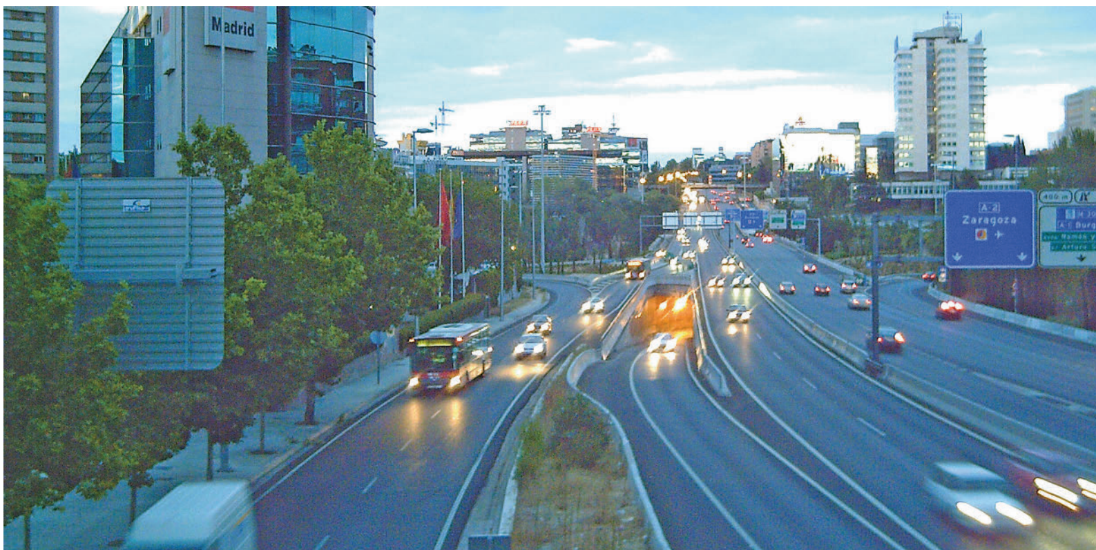
Tramo de la autovía A-2 en su entrada a la capital