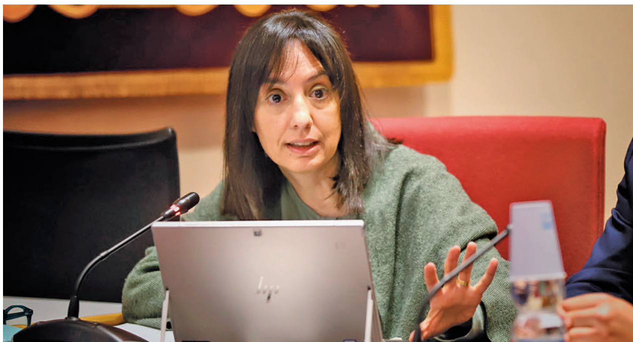
Mercedes González, durante uno de sus últimos actos como delegada del Gobierno

Para poder donar, solo es necesario tener entre 18 y 65 años, pesar más de 50 kilos y estar bien de salud. Cada día se necesitan en la región 900 donaciones de sangre. Este bien tan preciado no se puede fabricar y sus componentes tienen un período de viabilidad muy corto en el caso de las plaquetas.