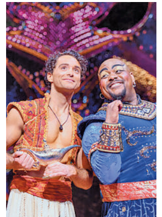
Imagen de la representación

Magia, espectáculo y diversión, en una producción que cuenta con una gran escenografía, un espectacular vestuario y un equipo integrado por más de 180 profesionales en cada representación que convierten a 'Aladdin' en uno de los mejores musicales. De los mismos productores de otros musicales como 'La