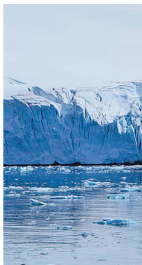
Hielo antártico

brero, con 1,79 millones de kilómetros cuadrados. Eso es 130.000 kilómetros cuadrados por debajo del mínimo histórico anterior alcanzado el 25 de febrero de 2022, una diferencia que equivale a un área del tamaño del es-