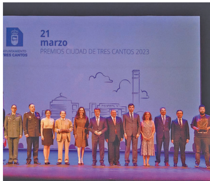
Foto de familia de los galardonados

La gala de los Premios Ciudad de Tres Cantos vivió su décima edición ● El alcalde de la localidad agradeció "su contribución por llevar la excelencia más allá de nuestras fronteras"