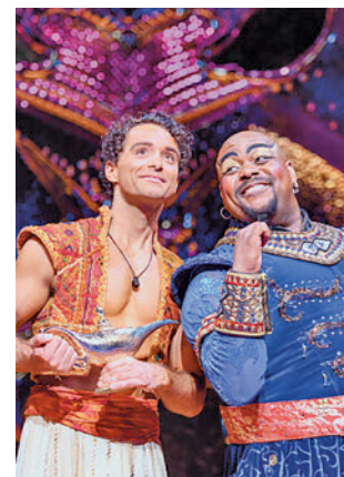
Imagen de la representación

Magia, espectáculo y diversión, en una producción que cuenta con una gran escenografía, un espectacular vestuario y un equipo integrado por más de 180 profesionales en cada representación que convierten a 'Aladdin' en uno de los mejores musicales. De los mismos productores de otros musicales como 'La