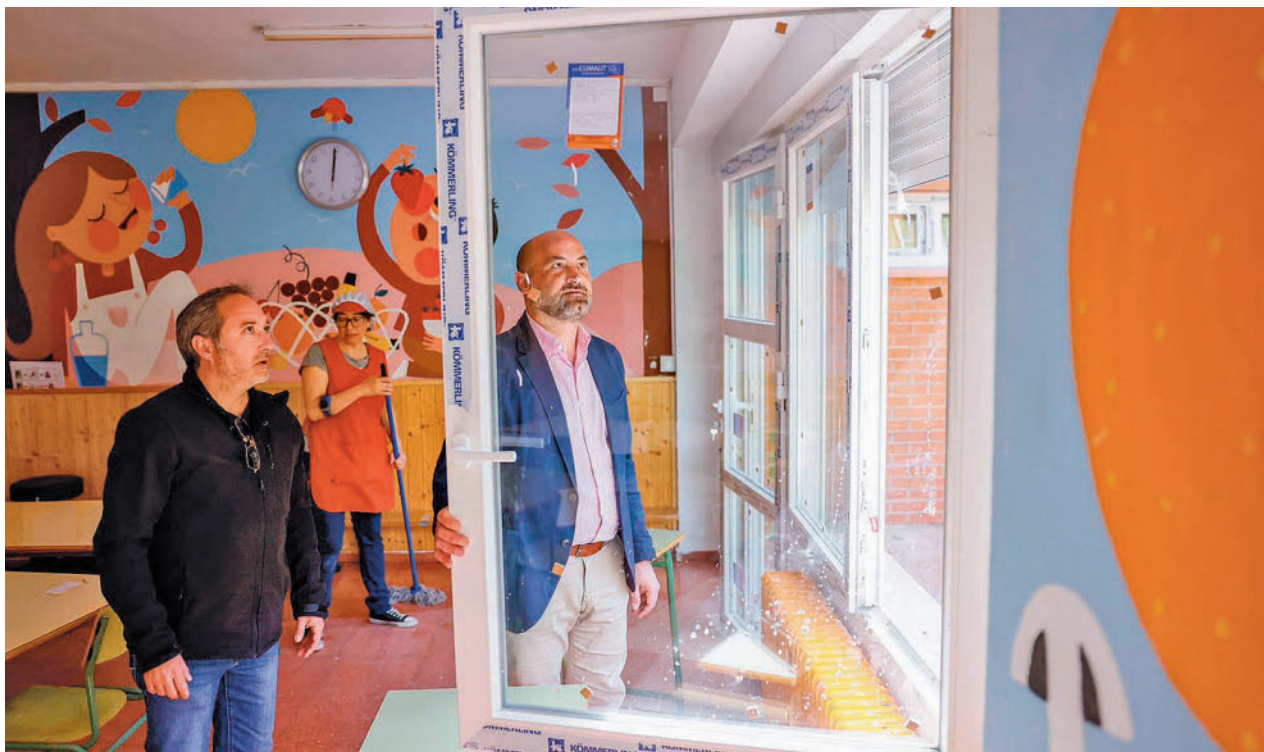
Visita institucional al CEE Miguel Hernández

La Línea 2 contempla exactamente los mismos trabajos, pero en este caso que hayan sido realizados por comunidades de vecinos y no por particulares.