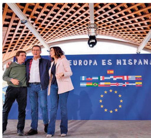
Almeida, Feijóo y Ayuso, en un acto reciente

EL PERIÓDICO GENTE NO SE RESPONSABILIZA NI SE IDENTIFICA CON LAS OPINIONES QUE SUS LECTORES Y COLABORADORES EXPONGAN EN SUS CARTAS Y ARTÍCULOS