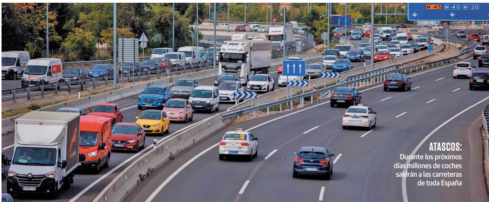
ATASCOS: Durante los próximos días millones de coches saldrán a las carreteras de toda España