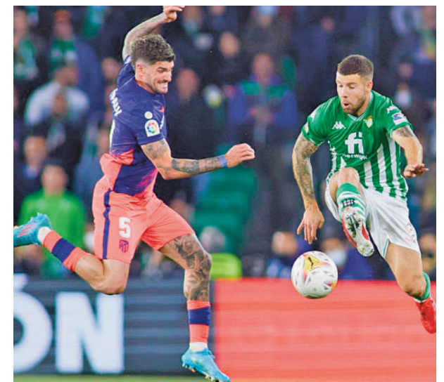
El Atlético de Madrid-Betis es el partido de la jornada

Osasuna tratará de llegar a su segunda final, después de la que perdió en la temporada 2004-2005 ante el Betis. Los hombres de Jagoba Arrasate intentarán sacarse la espinita que les dejó el gol de Dani en el Calderón.