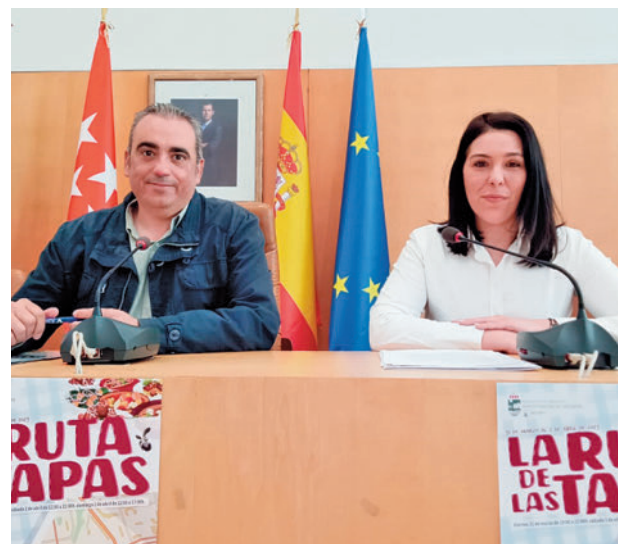
El alcalde y la concejala de Comercio, durante la presentación

El galardón de 'Mejor Tapa' está dotado con 300 euros y diploma conmemorativo. Serán los clientes quienes ejerzan de jurado popular votando a través de la app por sus propuestas favoritas. Además, tendrán opción de par-