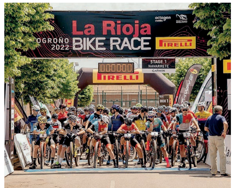
La salida de la edición de 2022 de La Rioja Bike Race.

Por último, en el tercer parcial habrá desplazamiento hasta Albelda de Iregua como nuevo punto de salida y meta en este 2023, para afrontar el recorrido más técnico, que contará con 54 kilómetros y 1.740 metros de desnivel acumulado. La localidad natal de Carlos Coloma, bronce olímpico en bicicleta de montaña en Río 2016, coronará a los ganadores.