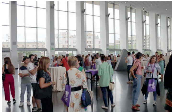
El encuentro celebrado en Riojaforum.

La presidenta regional, Concha Andreu, pidió que “nadie manche el trabajo honesto y transparente de este Ejecutivo”: “Nosotros nos dedicamos a gobernar, a poner medidas en marcha, a incrementar el doble de plazas de Enfermería o a tener a tiempo las partidas para los municipios en el primer trimestre del año”.