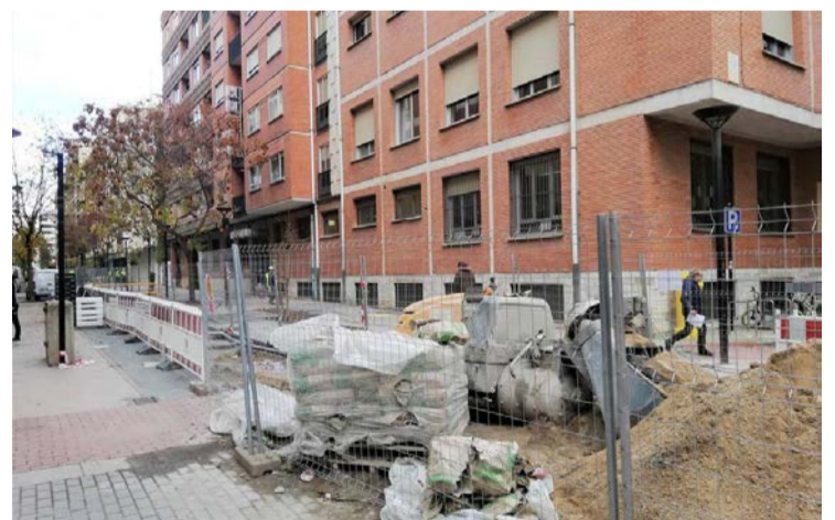
Las obras de las Cien Tiendas, paradas.

Como respuesta, el PSOE cargó contra el principal partido de la oposición: "El PP únicamente se dedica a poner palos en las ruedas del avance de Logroño, viven en el inmovilismo".