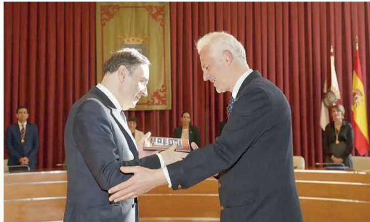
Pedro J. Ramírez y Pablo Hermoso de Mendoza.

“Su profunda cultura, su espíritu liberal y su trazo vital íntimamente vinculado a la configuración y consolidación de la democracia en España le permiten atesorar un bagaje audaz y valiente, fruto de un trabajo periodístico perseverante, que el Ayuntamiento de Logroño aprecia y reconoce”, expuso el primer edil.