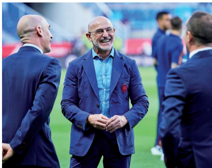
Luis Rubiales, presidente de la RFEF, junto a Luis de la Fuente.