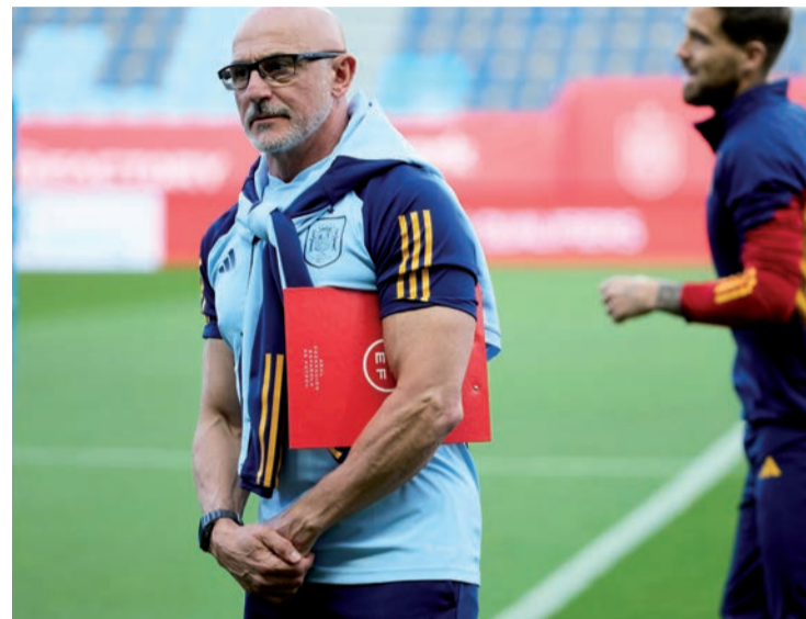
Luis de la Fuente, en la sesión preparatoria antes del España-Noruega.