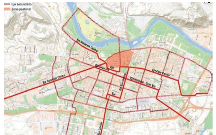
El plano municipal con los ejes para la circulación de bicicletas.