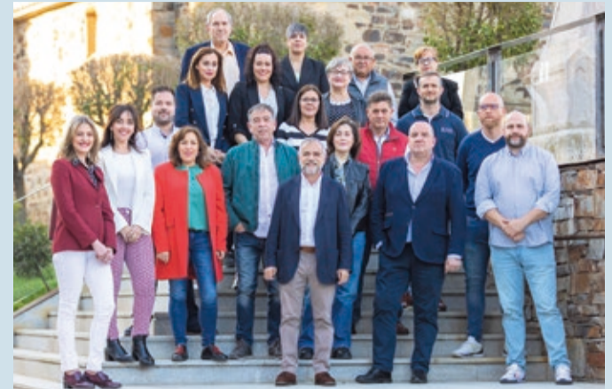
Estos son los hombres y mujeres con los que Palazuelo concurre a las elecciones.