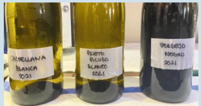
Ya se ha realizado en Rueda una microvinificación experimental.