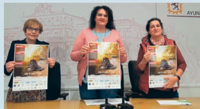
La concejala de Bienestar Social y 'Parkinson León' presentaron la carrera.

SOLIDARIDAD | LA INSCRIPCIÓN, 10 EUROS PARA ADULTOS Y 8 PARA NIÑOS