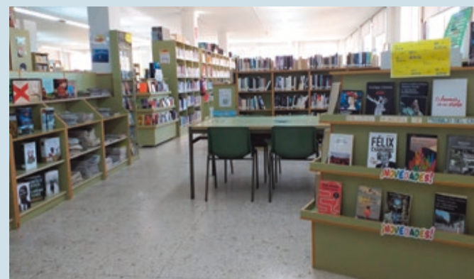
La biblioteca de Trobajo se suma a la celebración del Día del Libro.

CULTURA | PROGRAMA DE ACTIVIDADES DE FOMENTO DE LA LECTURA