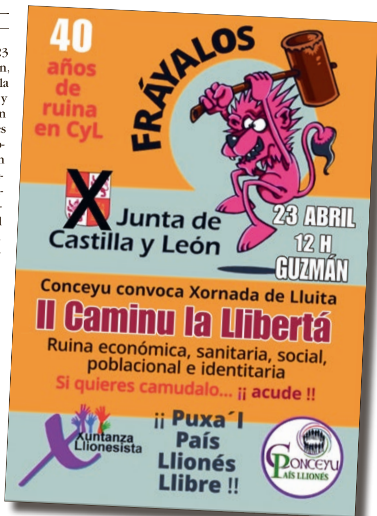
Cartel de la convocatoria de Conceyu con el homenaje al dibujane Lolo.

Por su parte, Conceyu del País Llionés con Xuntanza Llionesta ha convocado el 'II Caminu de la Llibertá', también