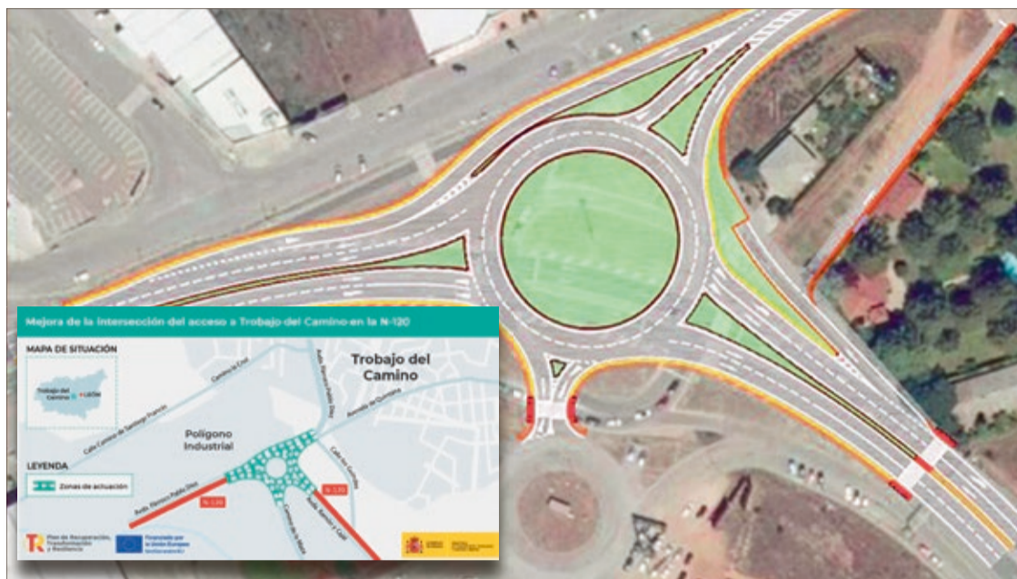
Proyecto de la glorieta de la N-120 en Trobajo del Camino que mejorará los accesos al polígono industrial y la seguridad de los peatones.