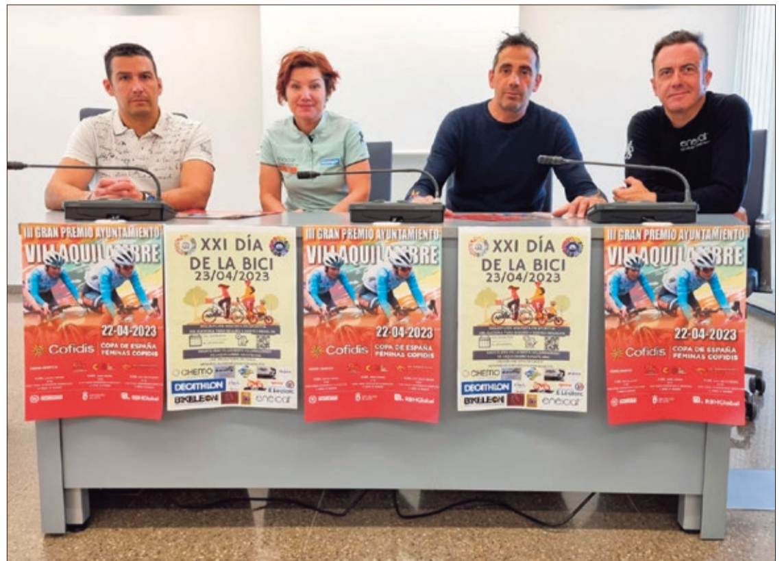
El concejal de Deportes del Ayuntamiento de Villaquilambre y los responsables del Eneicat presentaron la prueba ciclista.

El 'Día de la Bici' es una jornada dedicada exclusivamente a fomentar la actividad física, el deporte, la salud y el ciclismo en el municipio. Un evento gratuito y accesible a todos los participantes, con carácter familiar, que cuenta con más de 500 inscritos según ha indicado Rodrigo Valle. Asimismo, se realizará una campaña solidaria, para dar al evento un carácter filantrópico.