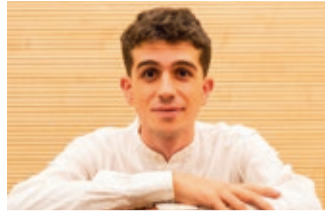
LUIS PRADES Piano • Viernes, 21 de abril, 19:30 h.