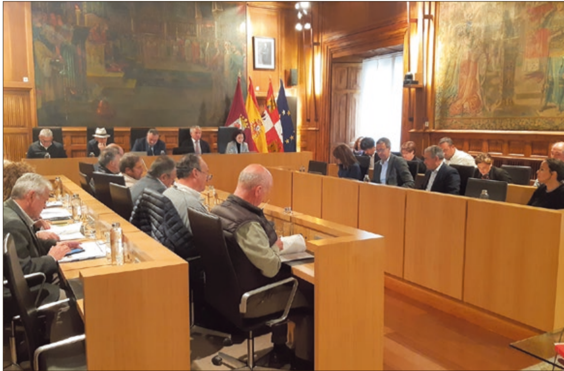
El Pleno extraordinario de la Diputación se celebró el viernes 14 de abril en el Palacio de los Guzmanes.