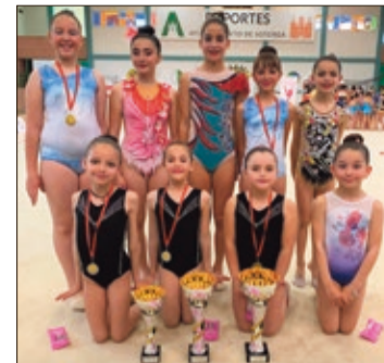
De las 10 participantes, 6 pisaron pódium.