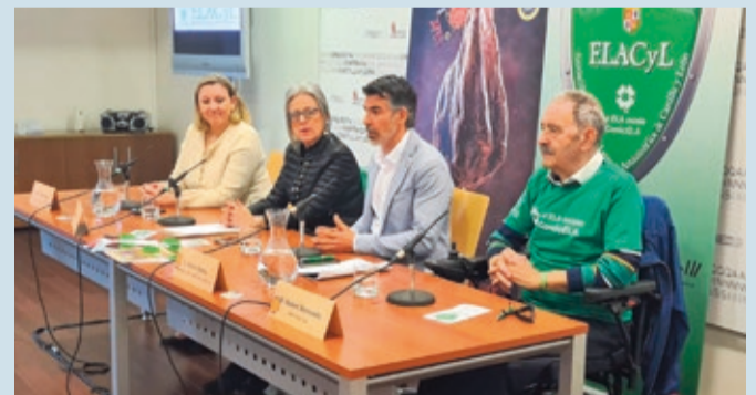
La cita gastronómica-solidaria tendrá lugar el 8 de mayo en Valladolid.

AGROALIMENTACIÓN | CON DESTINO A AFECTADOS DE ELA DE CASTILLA Y LEÓN