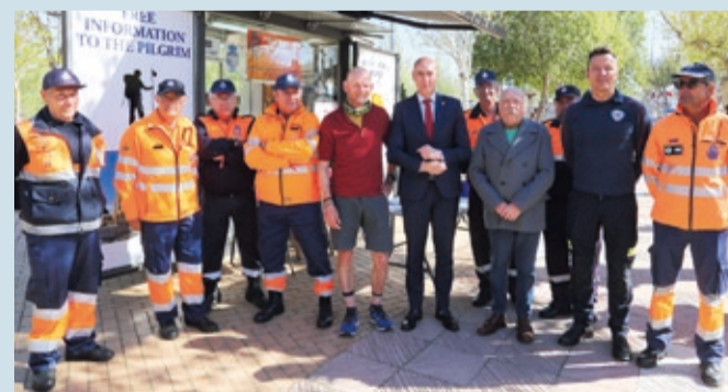
El alcalde de León visitó el Punto de Atención al Peregrino de Puente Castro.

CAMINO DE SANTIAGO | RECIBIÓ A CASI 13.000 PEREGRINOS EN 2022