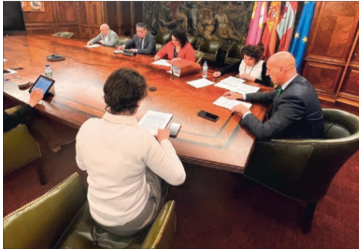
Junta de Gobierno Local del Ayuntamiento de León celebrada el 13 de abril.

Otra ayuda conseguida por el Ayuntamiento de León, en este caso de fondos Feder, es la