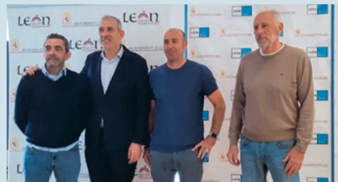
Presentación del torneo de pádel en el Ayuntamiento de León.

DEPORTES | PARTICIPARÁN 390 JUGADORES DE 10 CATEGORÍAS