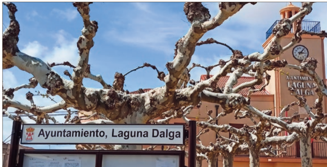
La situación económica del Ayuntamiento de Laguna Dalga es muy complicada a tenor del informe del secretario en el último Pleno.

Desde la formación leonesista denuncian que el alcalde desarrolla una política de inversiones