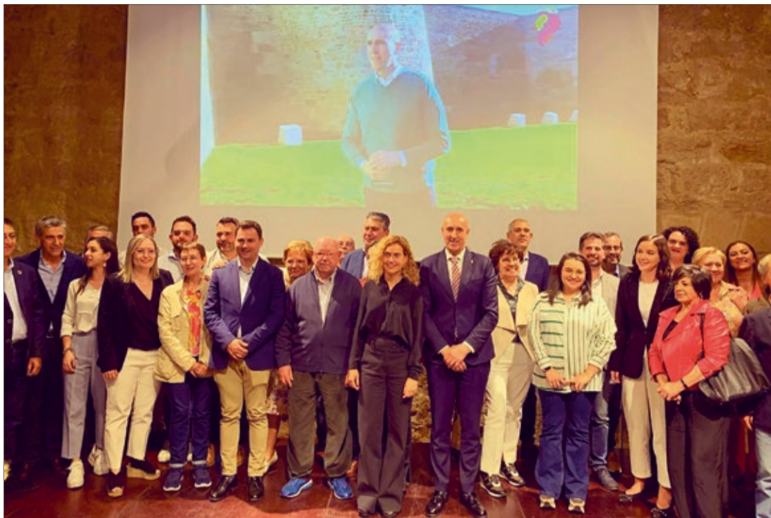
El PSOE de León presentó el 17 de abril la candidatura al Ayuntamiento de León con la participación de la presidenta del Congreso.