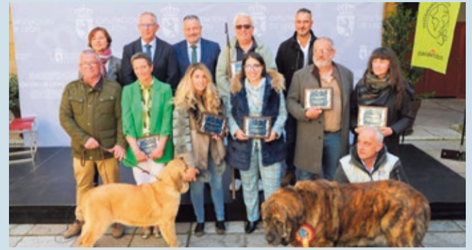
Foto de familia de los galardonados con el presidente Morán y el humorista Harlem.

MEDIO AMBIENTE | PROGRAMA QUE SE DESARROLLA EN LA CUETA DE BABIA